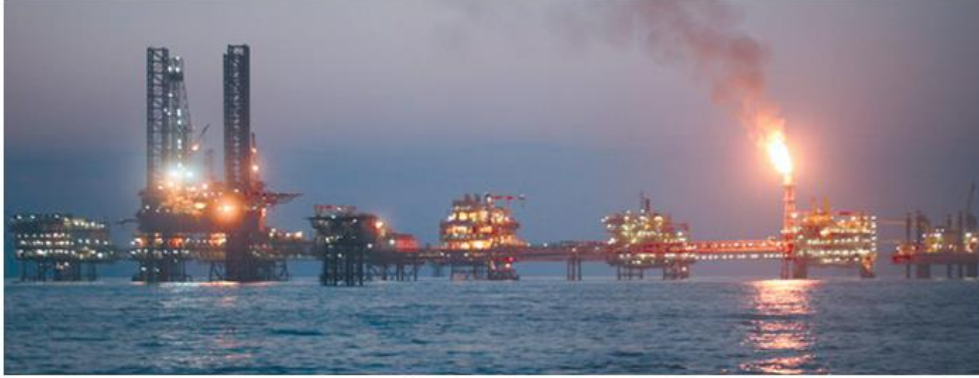
Katar'da bir petrol rafinerisi

Katar, topraklarında petrolün bulunmasından önce tek zenginlik kaynağı inci olan küçük bir ülkedir. Halkın başlıca ekonomik faaliyetleri balıkçılık ve hayvancılıktır. Ancak zengin petrol yataklarına sahip olduğunun anlaşılmasıyla birlikte Katar'da her şey değişti. Katar'ın başkenti Doha yakınlarındaki petrol yataklarının işletilmesiyle ülke sanayisinde hızlı bir gelişme yaşandı. Böylece geçmişte balıkçı teknelerine barınaklık yapan Katar kıyılarında petrol işleme ve petrol ürünleri yükleme tesisleri kuruldu.