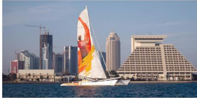
Katar'ın başkenti Doha'dan bir görünüş

Katar'da ekonomik refah düzeyinin yüksek olması nedeniyle yaşam standartları da yüksektir. Ortalama insan ömrü günümüzde kadınlar için 75, erkeklerde 70 yıldır. Ülkede okuma yazma oranı oldukça yüksek olup sağlık hizmetleri de gelişmiş ülkeler seviyesindedir.