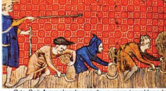
Orta Çağ Avrupa'sında senyör ve onun topraklarında çalışan serfleri gösteren bir tablo

Tımar sisteminde ise dirlik sahipleri ne toprağın sahibi ne de halkın efendisi durumundaydı. Halk hürdü ve devletin kiracısıydı. Dirlik sahipleri de aslında devletin vergi memuruydu. Bunların yetkileri devletin koyduğu kanunlar çerçevesinde sınırlandırılmıştı. Bu nedenle dirlik sahipleri kendilerine bırakılan toprakları satamaz, devredemez ve miras bırakamazlardı. Kanunlara aykırı davranışları hâlinde de topraklarına devlet tarafından el konulabilirdi. Buna karşılık feodalite yönetiminde krallar senyörlerin topraklarına el koyamazdı. Senyörler toprakları üzerindeki halkı kendi koydukları kurallara göre yönetir, gerektiğinde yargılar ve cezalandırabilirlerdi. Oysa tımar sisteminde dirlik sahibinin kural koyma, yargılama ve cezalandırma gibi yetkileri yoktu. Bu yetkiler kesin olarak devlete aitti.