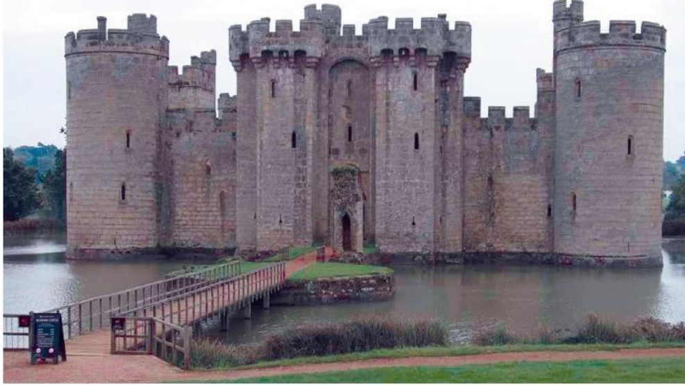
Bir derebeyi şatosu

Feodalite yönetiminde senyörler yetiştirdikleri askerlere kendileri komuta eder, gerekirse krallarına karşı kullanmaktan bile çekinmezlerdi. Tımarlı sipahilerin yetiştirdikleri askerler ise Osmanlı ordusunun bir parçası sayılırdı. Feodalite yönetiminde derebeyi adıyla da bilinen senyörler etrafı su ile doldurulmuş hendeklerle çevrili şatolarda yaşarlardı.