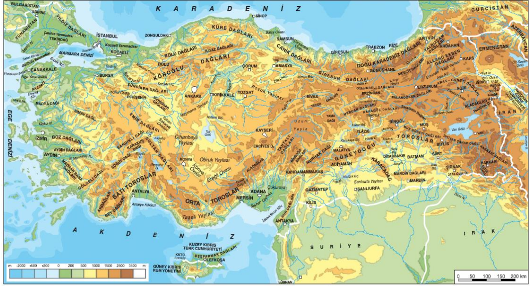
Harita 2.10: Türkiye fiziki haritası

Ülkemizde dağların uzanış şekli, iklim tipini etkiler. Ülkemizde Akdeniz ve Karadeniz Bölgeleri'nde dağlar, kıyıya paralel uzandığı için denizin ıltıctıcı etkisi kıyı kesiminde görülür. Dağlar, ıltıctıcı etkinin iç kesimlere geçmesine engel olur. Ege Bölgesi'nde ise dağlar kıyıya dik uzandığı için denizin ıltıctıcı etkisi, iç kesimlere kadar ulaşabilmektedir.