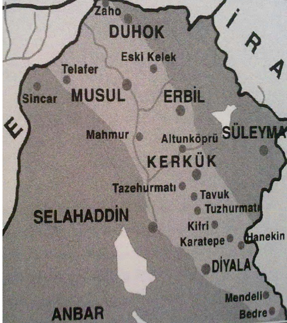
Türkmenele coğrafyasını gösteren bir harita