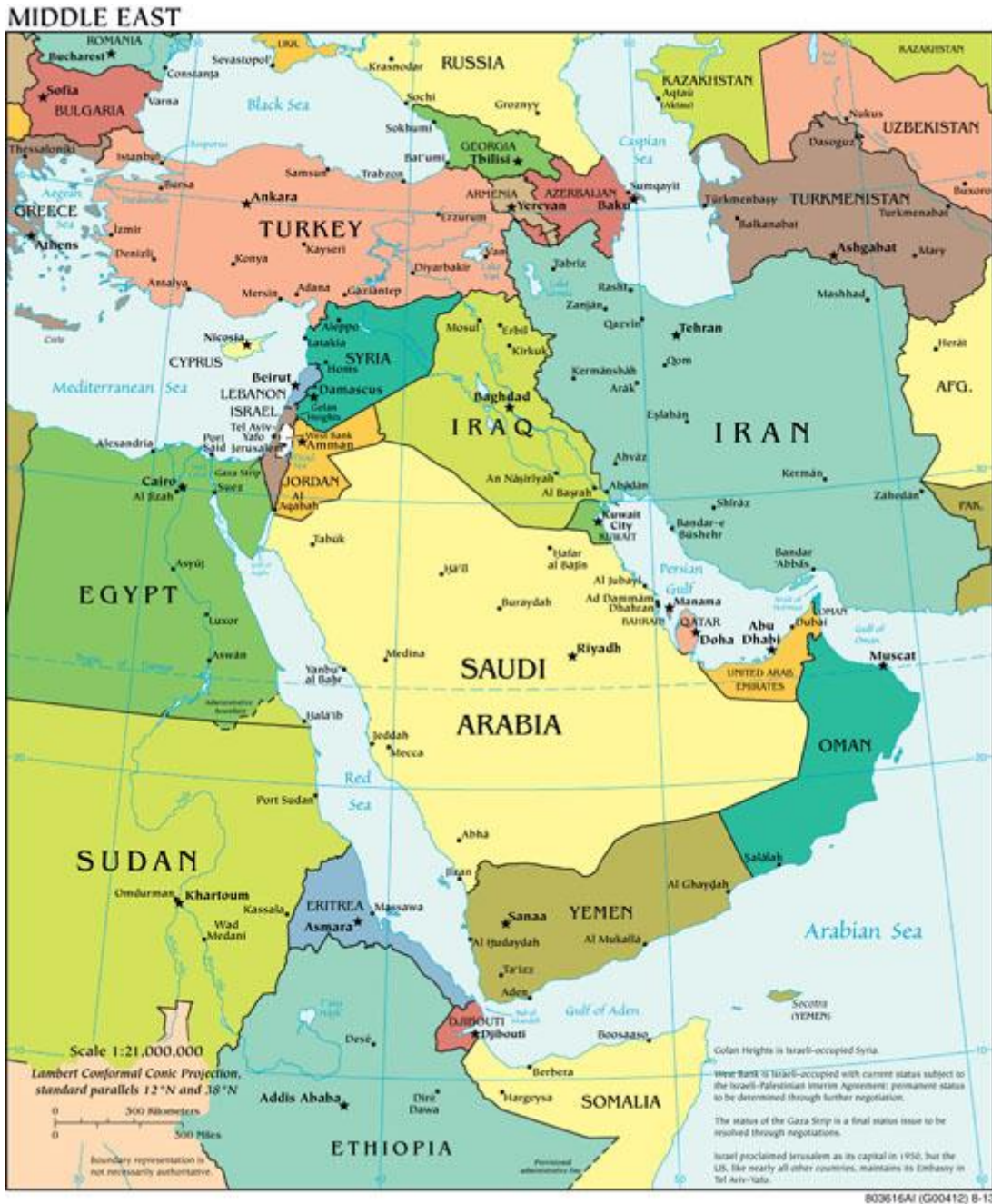
Şekil 2. Ortadoğu Siyasi Haritası