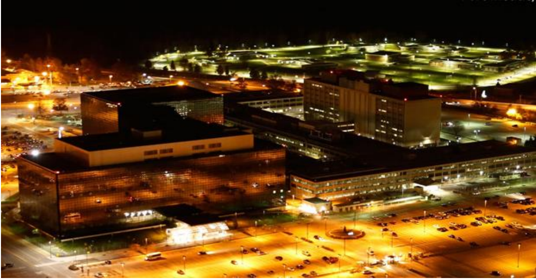
Şekil 7. NSA Binası, Fort Meade, Maryland

“gözetleme listesi (watch list)”, Mart 1976’da Church Raporu’na konu olmuş ve “NSA’in teknik imkânlarının, her an ABD halkına karşı bile kullanılabilir ve büyük bir tiranlık kurabilir” ifadesine yer verilmiştir (Kuzu, 2010, s. 244). Alman menşeli Der Spiegel dergisinin Şubat 1989 sayısında yayımlanan “NSA-ABD’nin Büyük Kulağı” başlıklı haberinde de yer aldığı üzere, Kuzey Denizi ile Alpler arasında her kim herhangi bir telefonun ahizesini kaldırırsa NSA’in öbür uçta olduğunu herkesin bilmesi gerekir, anayasal güvence ve iletişim özgürlüğü gibi kavramlar kâğıt üstünde kalır (Kuzu, 2010, s. 247).