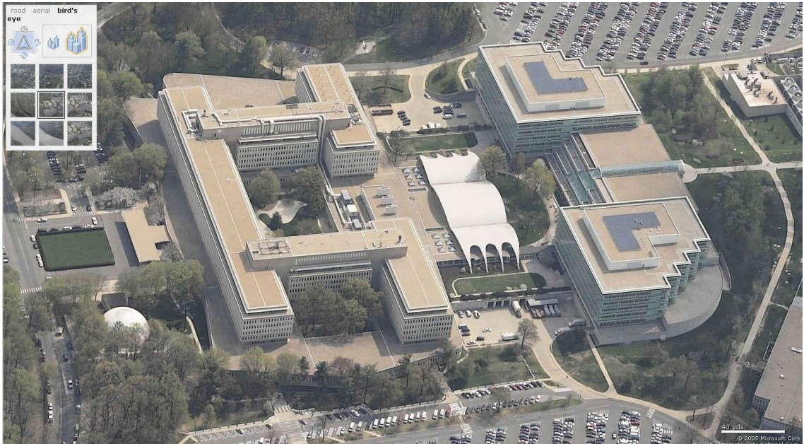
Şekil 9. CIA Karargâhı, Vaşington DC.

Merkezi İstihbarat Teşkilatı (CIA), 1947 yılında dönemin ABD Başkanı Harry S. Truman tarafından imzalanan Ulusal Güvenlik Yasası'yla faaliyetlerine başlamıştır. Bu yasa Birleşik Devletler İstihbarat Cemiyeti'nin başı olarak görev yapan Merkezi İstihbarat Başkanlığı'nı (DCI) da oluşturmuştur. DCI, ABD Başkanı'na ulusal güvenlikle ilgili istihbarat konularında baş danışmanlık yapmakla birlikte CIA'nin başı olarak görev yapar (www.cia.gov). 2004 yılında "İstihbarat Reformu ve Terörü Engelleme Yasası", "Ulusal Güvenlik Yasası"nda değişiklikler yapılarak "Ulusal İstihbarat Başkanlığı" birimi oluşturulmuştur. Ulusal İstihbarat Başkanı, CIA Başkanı'ndan ayrı bir birim olarak DCI'in önceden yapmakla yükümlü olduğu bazı görevleri üstlenmiştir. CIA, ABD'nin üst düzey politika oluşturucularına milli güvenlik istihbaratı sağlamaktan sorumlu bağımsız bir kurumdur.