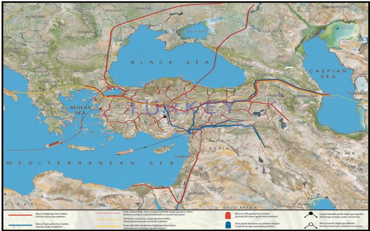
Şekil 6. Ulusal ve Uluslararası doğalgaz ve ham petrol boru hatları

hamlesi olmuştur. Bu çerçevede 2013 yılında temelleri atılan IKKY ile petrol sevkiyatı anlaşması çerçevesinde, Irak'ın kuzeyindeki Gulf Keystone şirketi tarafından işletilen Shaikan petrol sahasında Temmuz 2013 içerisinde başlayan ticari üretimden elde edilen ham petrol, boru hattı aracılığıyla 2014 yılı içerisinde Adana/Ceyhan'dan dünya pazarıyla buluşmuştur ( www.enerjienstitusu.com ).