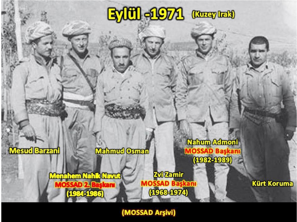
Şekil 4. Irak'ın kuzeyi Mesud Barzani ve MOSSAD yetkilileri