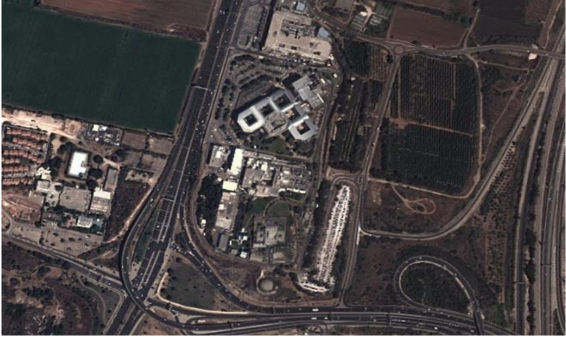
Şekil 10.MOSSAD Karargâhı, Tel Aviv

Kurumu'nun yerini alan MOSSAD'a, dönemin İsrail Başbakanı D.Ben Gurion; "Düşmanın işgali altında kurulan devletimiz için istihbarat savunmanın ilk aşamasını oluşturmaktadır, etrafımızda neler olduğunu iyi öğrenip, iyi tanımlamalıyız" şeklinde bir talimat vermiştir.