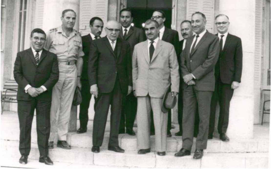
Şekil 5. İsrail Cumhurbaşkanı Zalman Şazar-Mustafa Barzani

בתמונה מימין ראש המוסד, האלוף מאיר עמית, המולא מוסטפה ברזני (מנהיג הכורדים), נשיא המדינה זלמן שזר, שלישי הצבאי, אל"מ אריה רז ודוד קרון. בשורה מאחור, מימין לשמאל: נציג משרד החוץ, חיימקה לבקוב, אלוף הר- אבן ושני אישים כורדים.