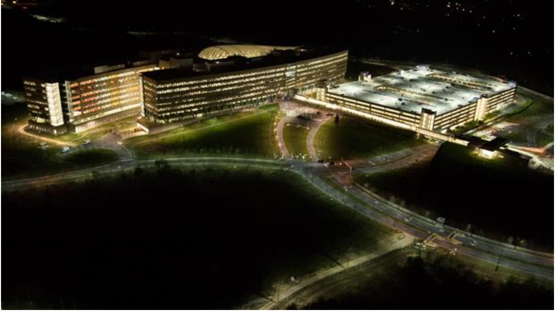
Şekil 8. Ulusal Coğrafi İstihbarat Ajansı (NGA) Springfield, Virginia