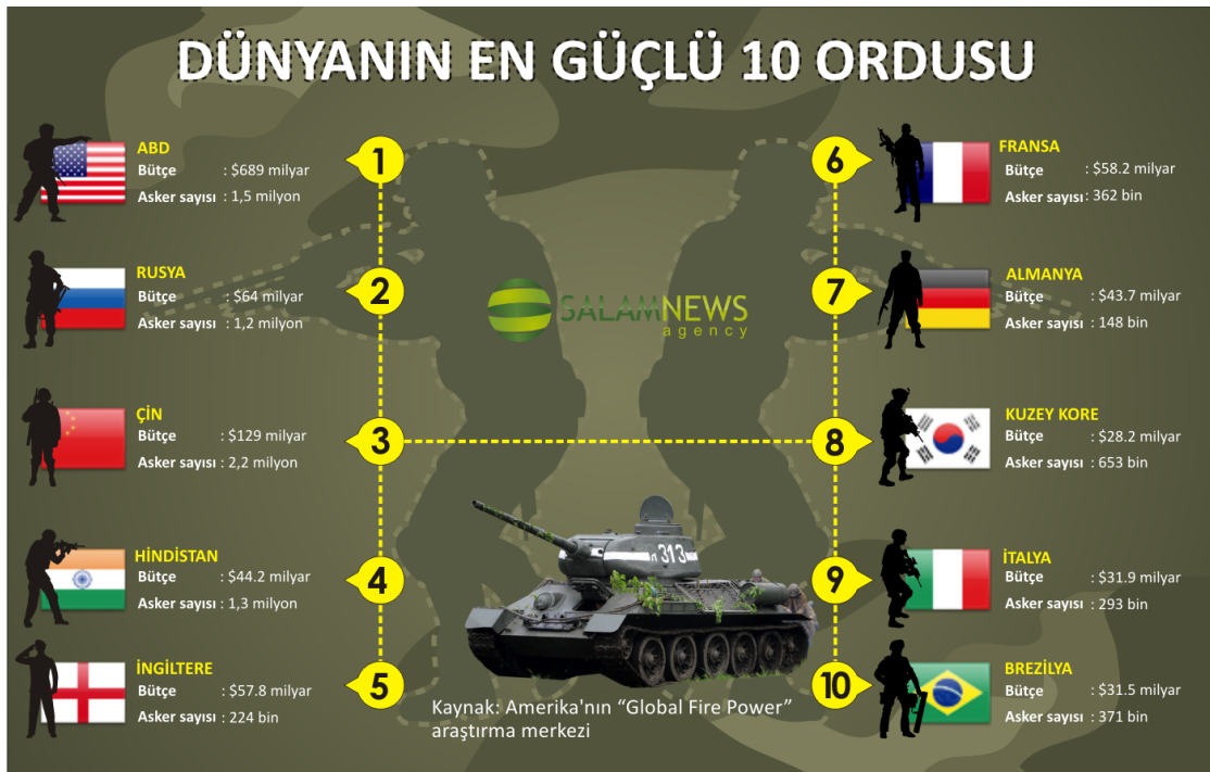
Şekil 1. Dünyanın en güçlü 10 ordusu