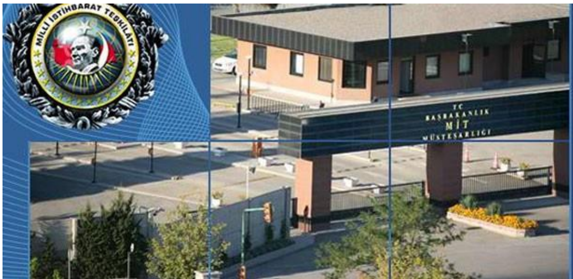
Şekil 11. MİT Karargâhı, Ankara.

Türkiye Cumhuriyeti’nin kuruluşundan önceki dönemde Osmanlı Devleti’nde Enver, Cemal ve Talat Paşalar’ın etkin oldukları İttihat ve Terraki’nin yönetimi ele geçirmesi ile birlikte, Sultan Reşat’ın resmi onayıyla Teşkilat-ı Mahsusa faaliyet göstermeye başlamıştır (Kuzu, 2009, s. 277). Bu teşkilat, bugünkü MİT’in de temellerini oluşturmuştur. Osmanlı’nın son dönemlerinde, siyasi birliğin korunmasını sağlamak, ayrılıkçı hareketleri önlemek ve yabancı ülkelerin Ortadoğu Bölgesi’ndeki istihbarat ve gerilla faaliyetlerine karşı koymak amacıyla kurulan Teşkilat-ı Mahsusa o dönem sadece Sadrazam ve Harbiye Nazırı (Genelkurmay Başkanı)’na bilgi vermekle yükümlüydü. Gazi Mustafa Kemal Atatürk’ün, çalışma arkadaşlarıyla 1925 yılında yaptığı sohbetlerde; “Muasır devletlerde olduğu gibi, bizde de modern bir istihbarat teşekkülü kurmak mecburiyetindeyiz” şeklindeki ifadesi, Türkiye Cumhuriyeti’nde istihbaratın kurumsallaşması noktasında ilk ciddi devlet iradesini ortaya koymuştur.