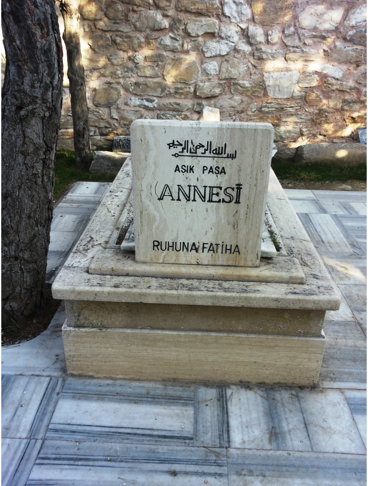
Şekil 4: Âşık Paşa'nın Annesinin Mezarı