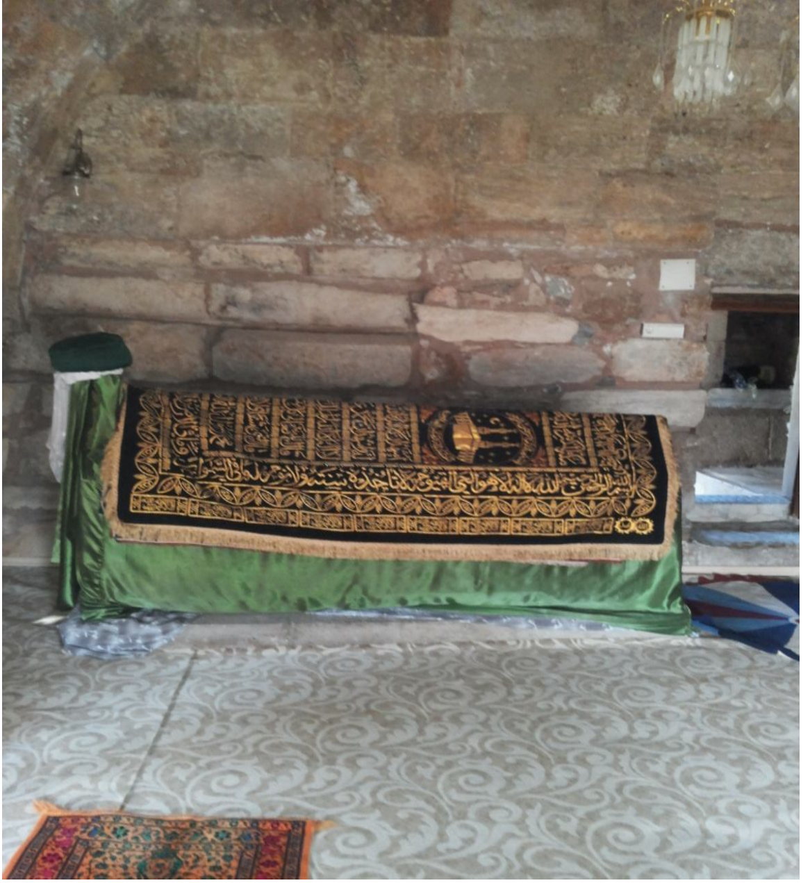
Şekil 2: Âşık Paşa Türbesi-2