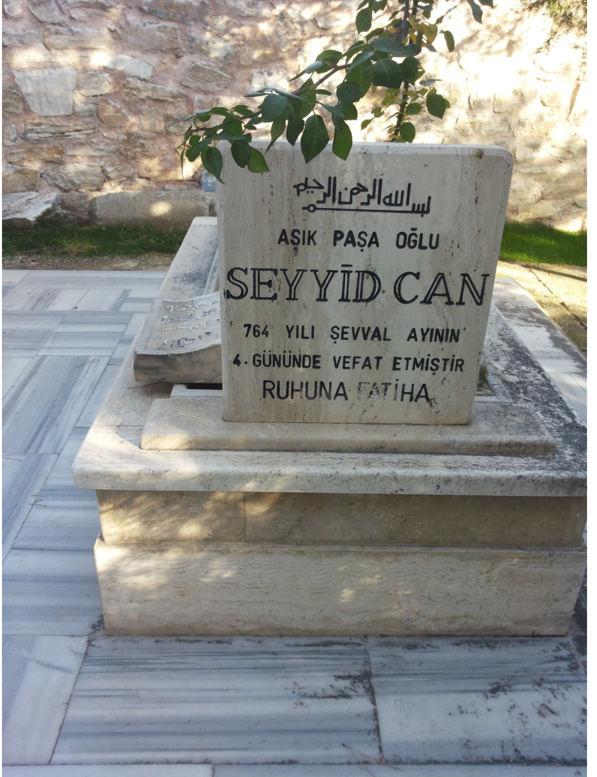
Şekil 5: Âşık Paşa'nın Oğlu Seyyid Can'ın Mezarı