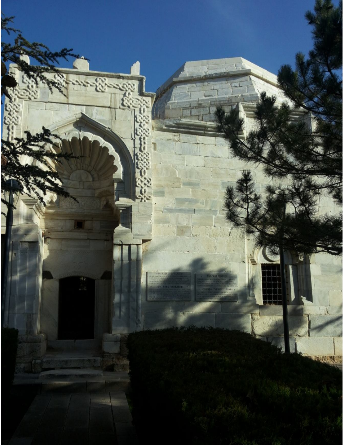
Şekil 1: Âşık Paşa Türbesi-1