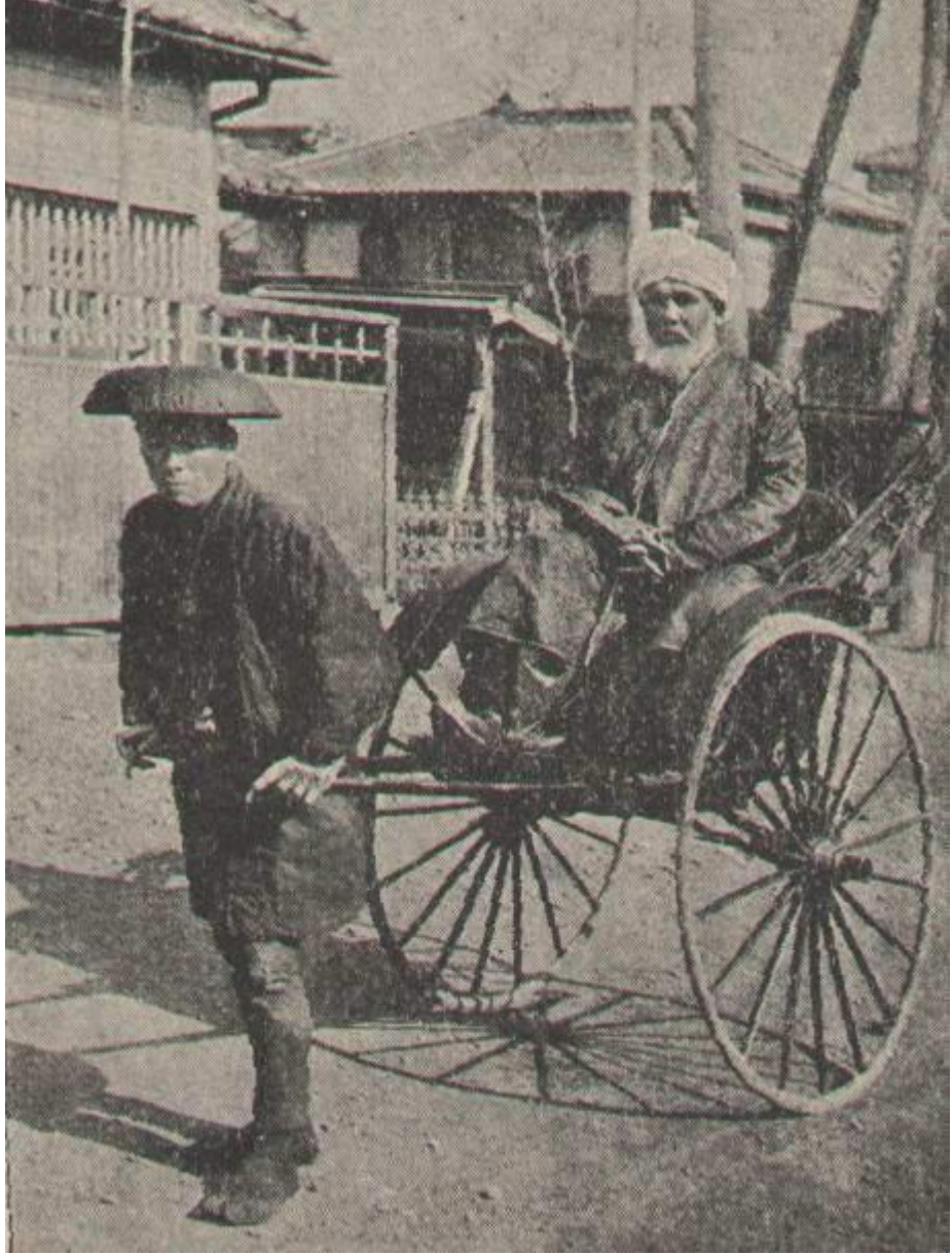
Japonya'da adam çeken araba, rikşe (alem-i islamdan alınmıştır)