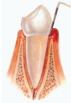
řekil 3. Dental plak muayene maddesinin alındıđı bölge (subgingival alan)

Muayene maddesi, diř hekimi tarafından sađlam veya řürük diřlerin subgingival plak bölgelerinden ađzın diđer bölümlerine deđdirilmeden, steril küret ucu ile alındı (řekil 3).