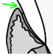
Şekil 1. Gingival kanal

alan oluşturup, dişeti cebi sıvısının devamlı akışı da bunlara ihtiyaçları olan çok zengin bir besi yeri sağlar (10).