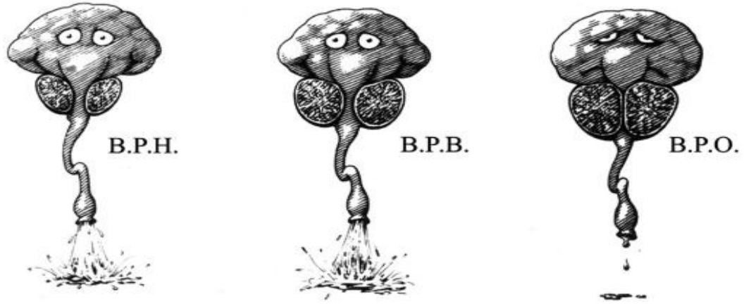
Şekil 2.2. Mesane Çıkım Tıkanıklığı (52).

akımıyla birlikte artmış detrusor basıncının bulunmasıdır (52). İşeme bozukluğuna yol açanın benign prostat hiperplazisi veya benign prostat büyümesi olmadığı, benign prostat büyümesine bağlı mesane çıkım tıkanıklığı olduğu Şekil 2.2’de görülmektedir.