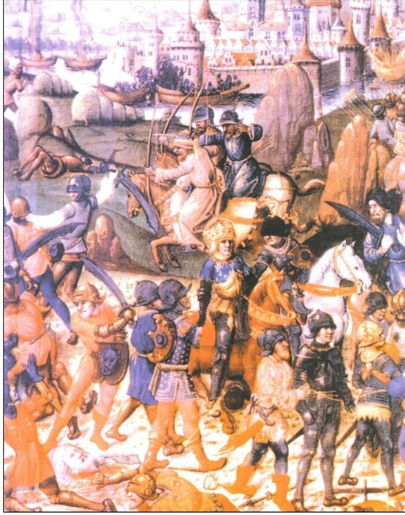
Resim: Fransa Kralı IX. Louis Memlûk ordusu tarafından esir alınıyor. Kanat-Burçak, Sorulara Haçlı , s. 223.