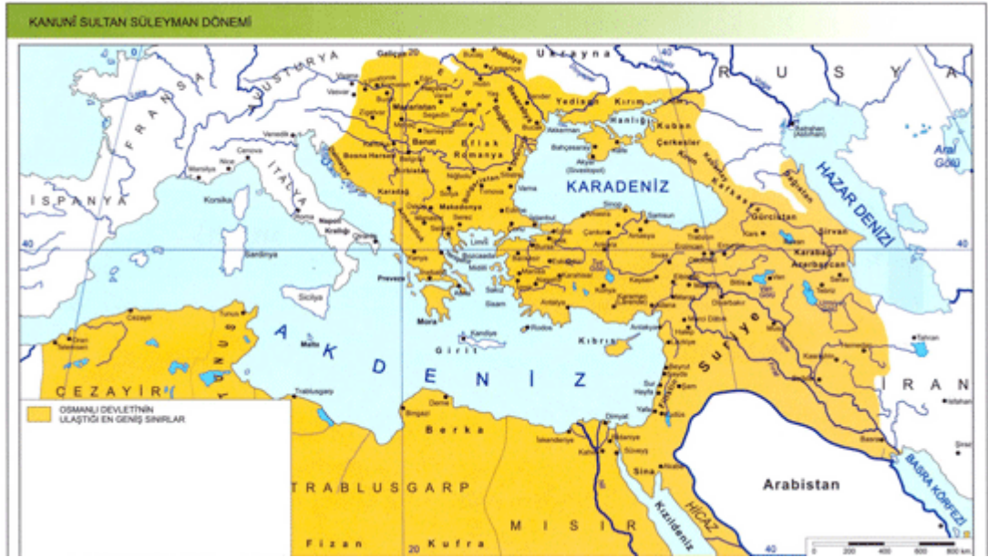
Harita I: Osmanlı Devleti'nin en geniş sınırları

Kaynak: http://www.osmanlipadisahlari.gen.tr/17-yuzyilda-osmanli-devleti.html