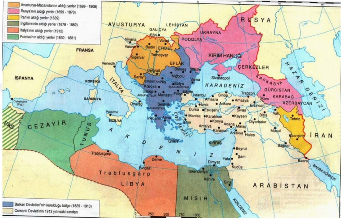
Harita II: 19. yüzyıla kadar Osmanlı Devleti'nin kaybettiği topraklar