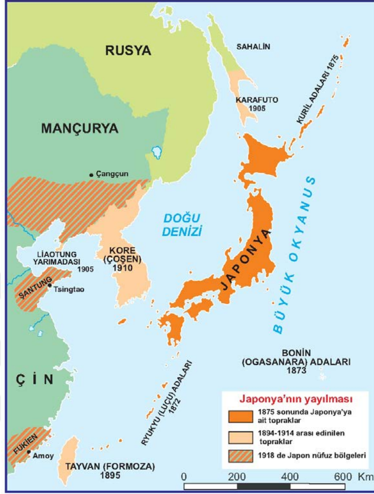
Harita III: 1868-1919 yılları arası Japonya'nın genişlemesi

Kaynak: http://dersimiztarih.net/unite-xx-yuzyil-baslarinda-dunya.html