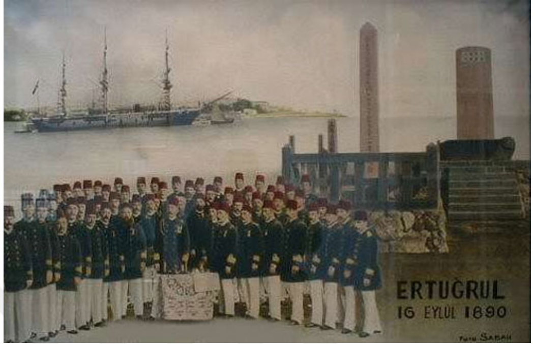
Resim II: Ertuğrul Firkateyni Japonya'da