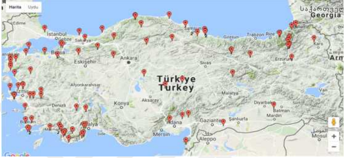
ekil 1: TaTuTa Çiftliklerinin Harita Üzerinde Gösterimi (www.TaTuTa.org)

Bölgesinde, 5 tanesi Do u Anadolu Bölgesinde, 6 tanesi ç Anadolu bölgesinde, 2 tanesi Güney Do u Anadolu Bölgesinde, 25 tanesi Karadeniz Bölgesinde ve 14 tanesi ise Marmara Bölgesinde bulunmaktadır.