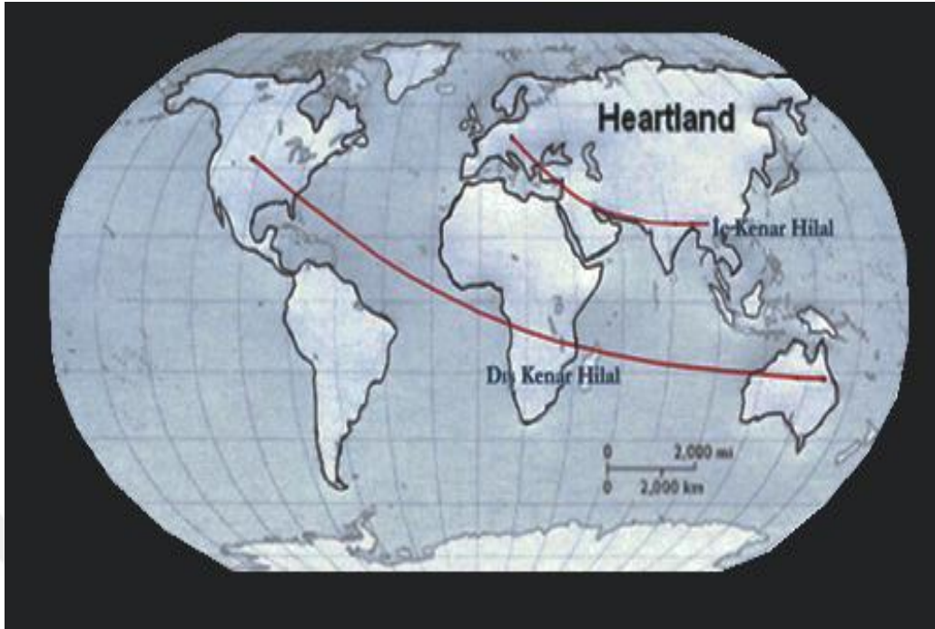
Şekil 1.1. Sir Halford Mackinder'in Jeopolitik Modeli

Mackinder'e göre bir devlet için coğrafya açısından en uygun bölge merkez bölgesidir. Bu bölge dünya adası üzerinde dünya çapında bir güç merkezini oluşturarak kendi kendine olabileceğini düşünmüştür. H. Mackinder'in geliştirdiği teorisi şu şekilde sonuçlandırılmıştır: "Doğu Avrupa'ya kim hükmederse Merkez bölgesine-Kalpgah'a hâkim olur; Kalpgah'a kim hükmederse Dünya Adası'na hâkim olur; Dünya Adası'na kim hükmederse dünyaya hâkim olur" 33