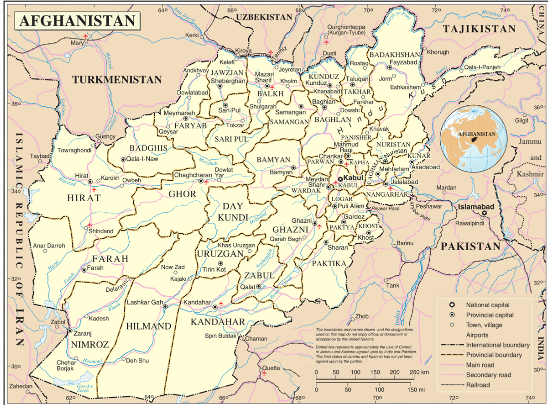
Şekil 2.1. Afganistan'ın siyasi haritası

Günümüzde Afganistan'ın siyasi haritası şu şekildedir.