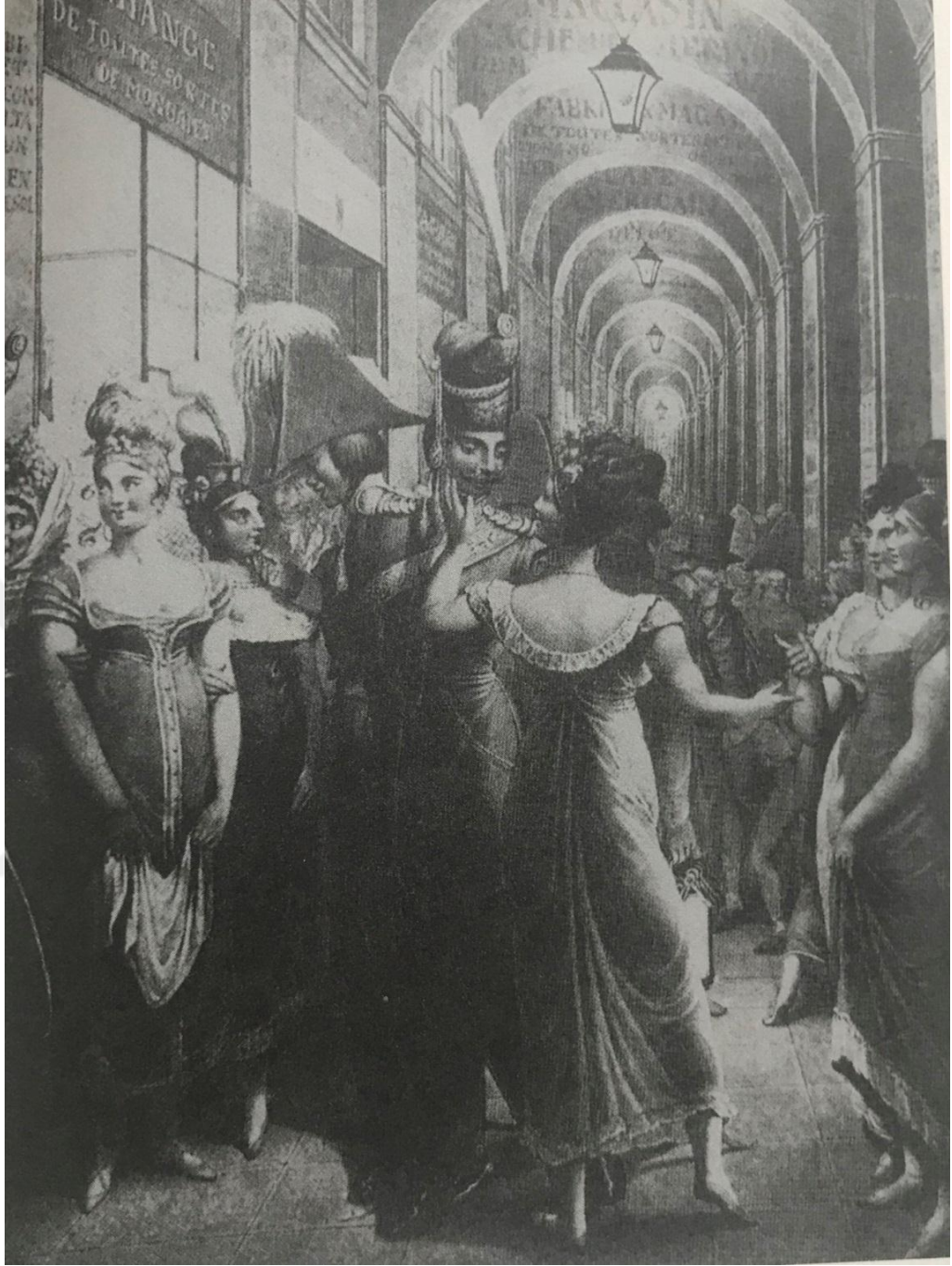
Şekil 3: Palais Royal, 1815