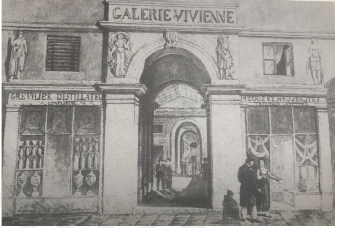
Şekil 2: Restore edilerek yeniden Paris'te hizmete giren Vivienne Pasajı