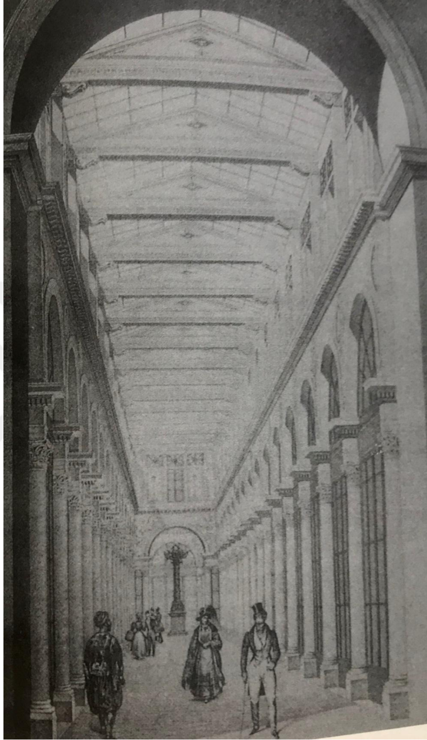
Şekil 1: Colbert "galleria"sı