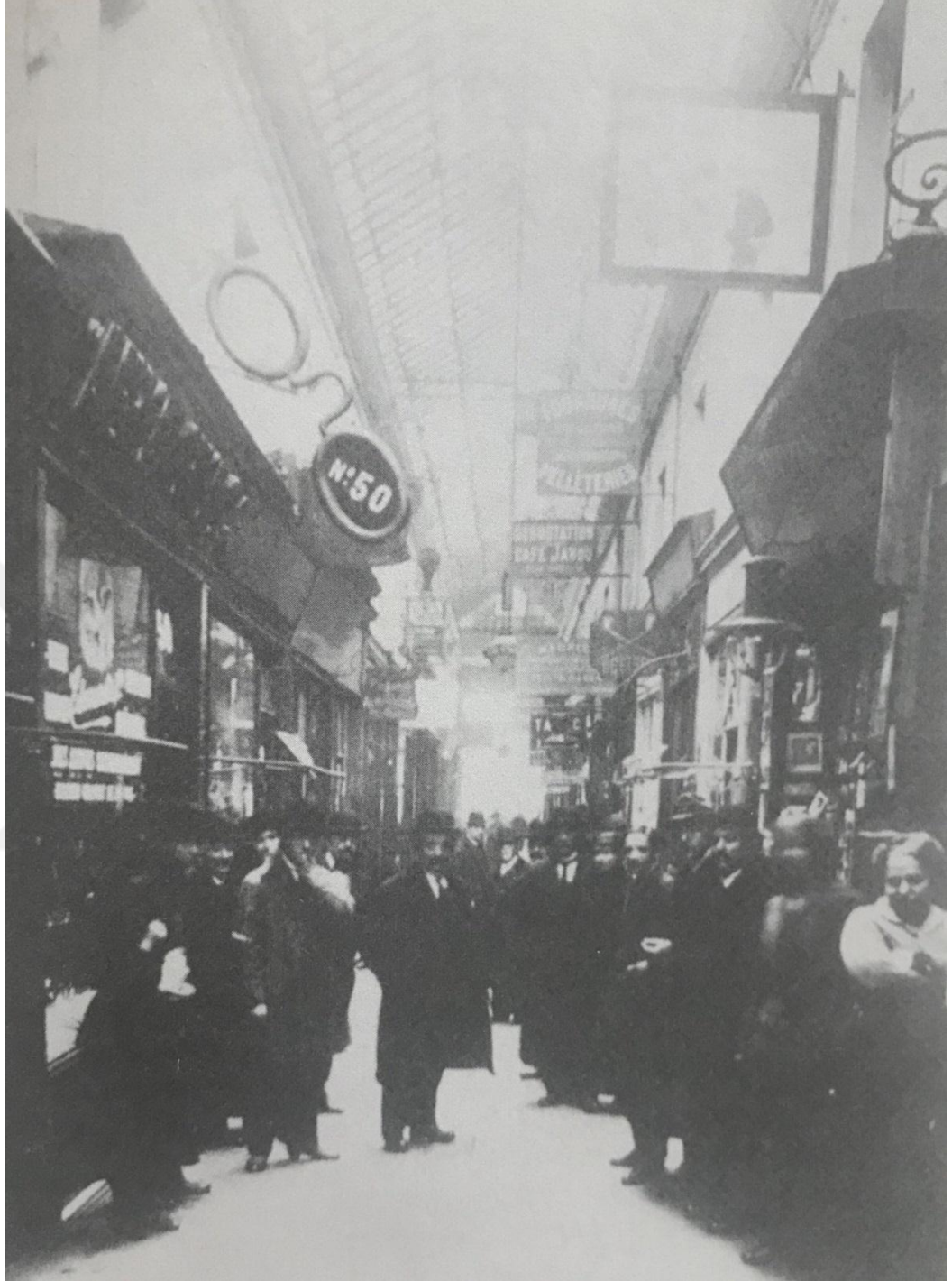
Şekil 7: Panorama Pasajı 'nın geçen yüzyılda müşteri profili