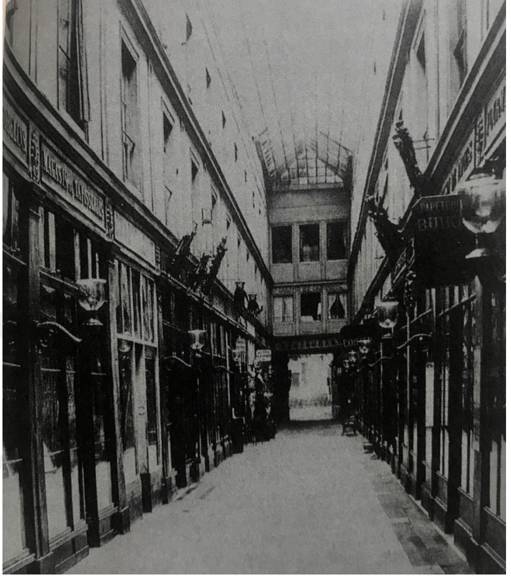
Şekil 9: Barometre Pasajı