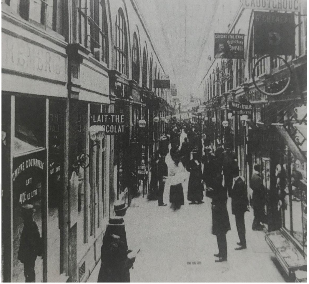
Şekil 5: Choiseul Pasajı, XIX. Yüzyıl