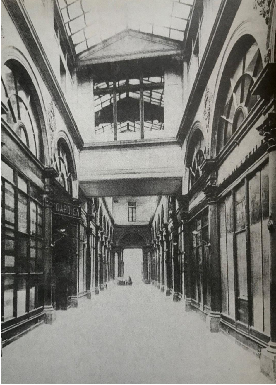
Şekil 10: Colbert Pasajı