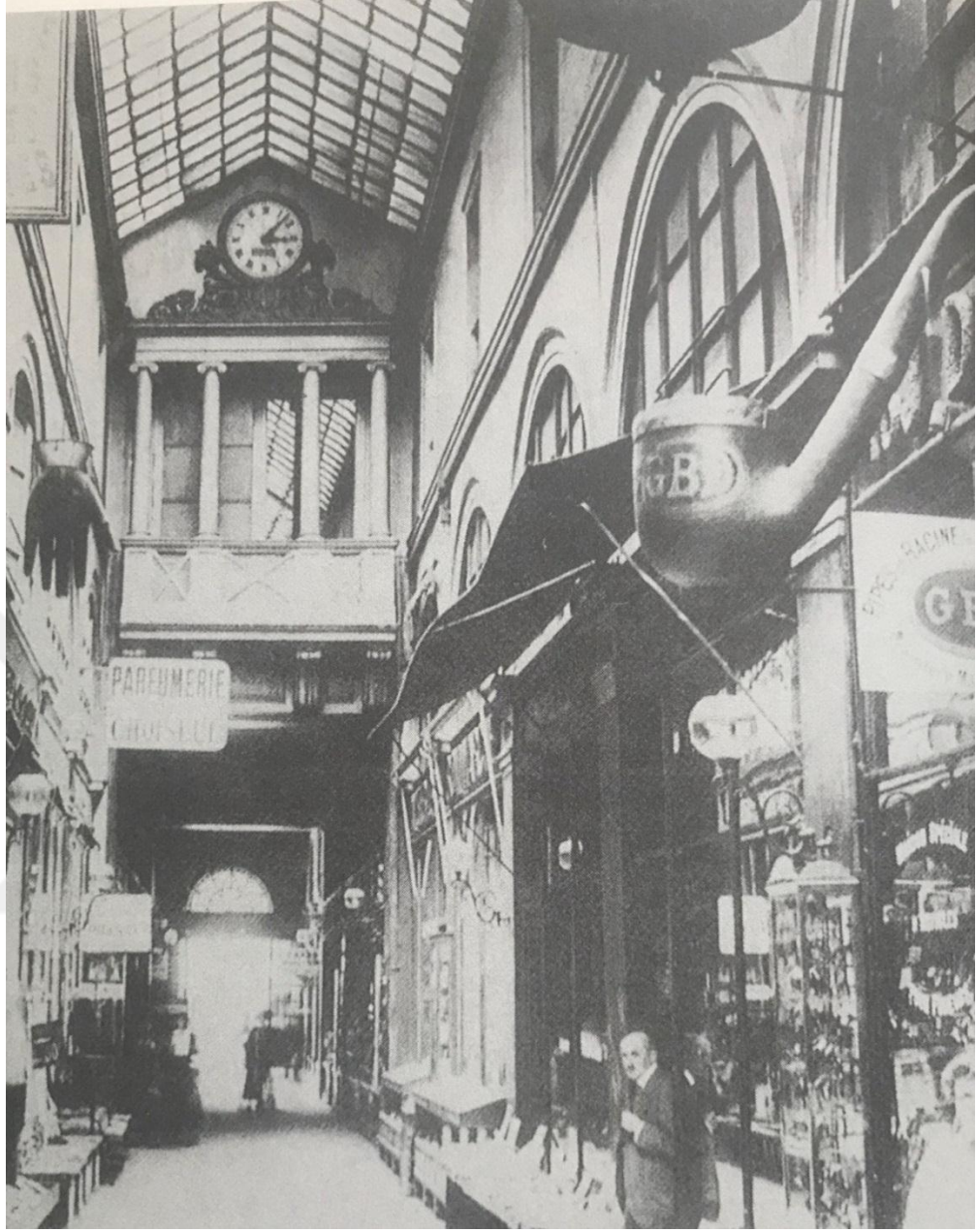
Şekil 6: Choiseul Pasajı, bugün de bu görünümde