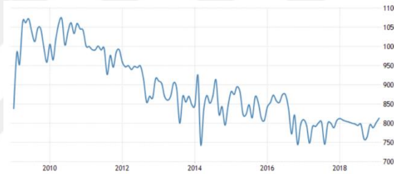
Şekil 1.2: Yıllara Göre Azerbaycan'da Petrol Üretimi (milyon ton)