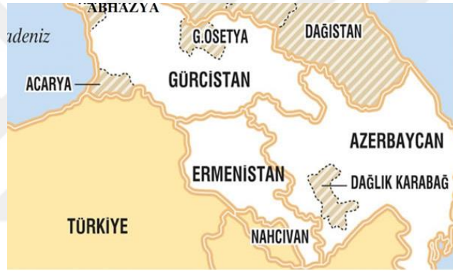
Şekil 1.1: Transkafkasya'nın Coğrafi Konumu

Güney Kafkasya kültürel açıdan çeşitliliğe sahip bir bölge olmasının yanında hem kıtalararası bir köprü hem de yüzlerce yıldan beri Doğu-Batı, Kuzey-Güney Avrasya arasında enerji ve nakliye alanında geçiş bölgesidir. Aynı zamanda Avrupa, Asya ve Afrika kıtalarını birbiriyle buluşturan önemli bir coğrafi konumdadır. Kafkasya ve Güney Kafkasya bölgeleri 19.yy'da İran, Türkiye ve Rusya arasında, 20.yy'da ise Doğu ile Batı arasında tampon bölge olması sayesinde önem kazanmıştır. Bunun yanında bölge sahip olduğu farklı etnik, toplumsal ve dini yapısıyla çeşitli medeniyet ve halklar arasında köprü görevi görmüştür (Karabayram, 2007: 132). Şekil 1.1'deki haritada Güney Kafkasya'nın coğrafi konumu gösterilmektedir.