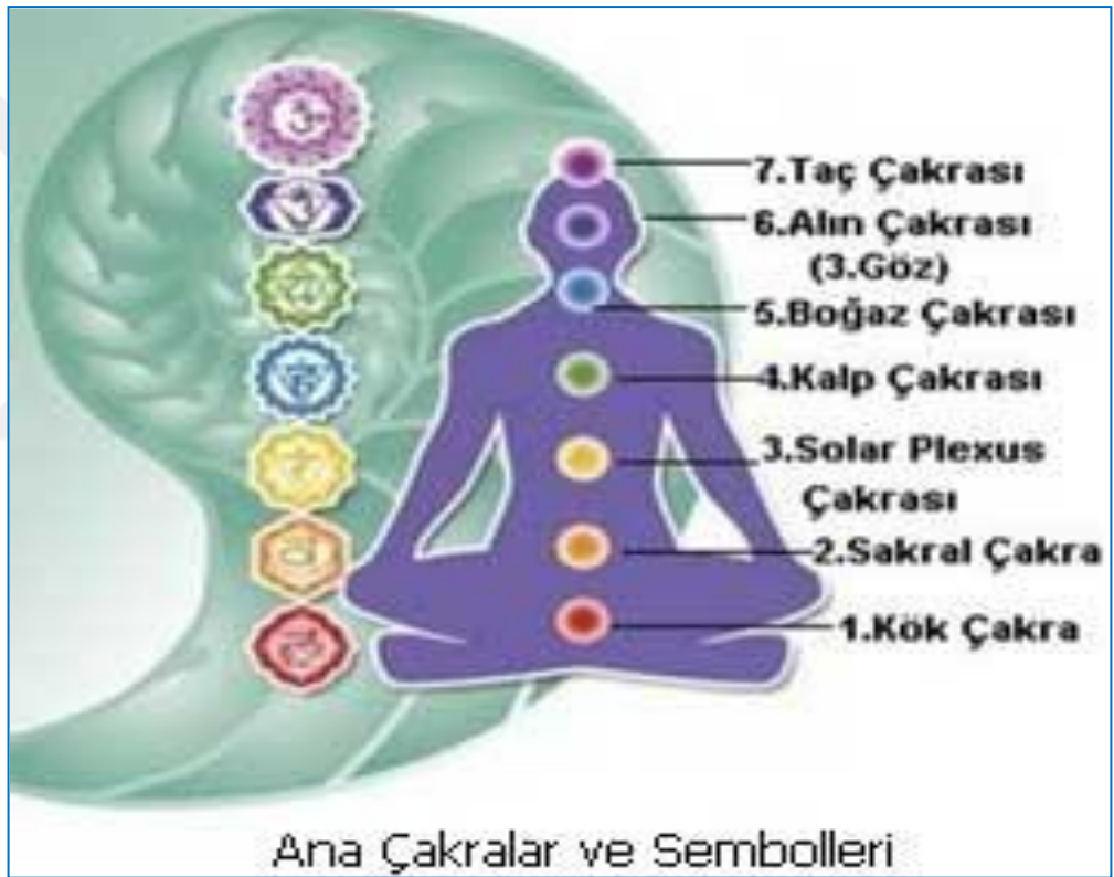
Şekil 3.1. Çakra Merkezleri (59)