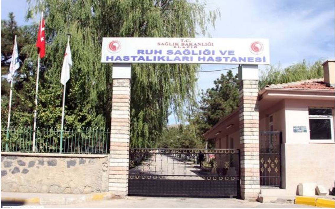
Şekil 3.1. Elazığ Ruh Sağlığı ve Hastalıkları Hastanesi

Araştırma Elazığ Ruh Sağlığı ve Hastalıkları Hastanesi'nde Haziran 2017-Haziran 2018 tarihleri arasında yürütülmüştür. 57 dönümlük bir alan üzerinde bulunan hastane 1925 yılında kurulmuştur. Hastane 488 yatak kapasitesi ile bölgedeki psikiyatri hastalarına hizmet vermektedir. Elazığ Ruh Sağlığı ve Hastalıkları Hastanesi Şekil 1 'de gösterilmiştir.