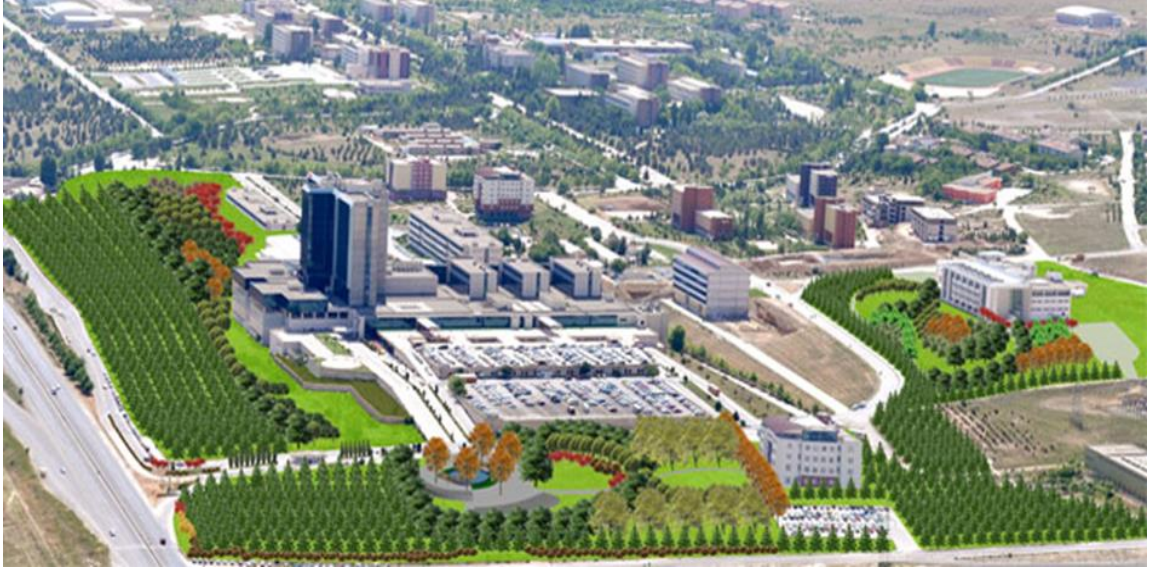
Şekil 3.1. İnönü Üniversitesi Turgut Özal Tıp Merkezi

İnönü Üniversitesi Turgut Özal Tıp Merkezi 1996 yılında hizmete açılmıştır. Turgut Özal Tıp Merkezi 24.000 m 2 alan üzerine kurulu 126.000 m 2 toplam kapalı alana sahiptir. On altı katlı hastane kulesinde aktif hizmet veren merkez toplam 950 yatak kapasitesine sahiptir. Psikiyatri kliniği 52 yatak kapasitesine sahiptir. 14 hemşire, 7 öğretim üyesi, 13 asistan ve 8 diğer personel olmak üzere toplamda 42 sağlık personelinde oluşmaktadır. İnönü Üniversitesi Turgut Özal Tıp Merkezi Şekil 3.1’de verilmiştir.