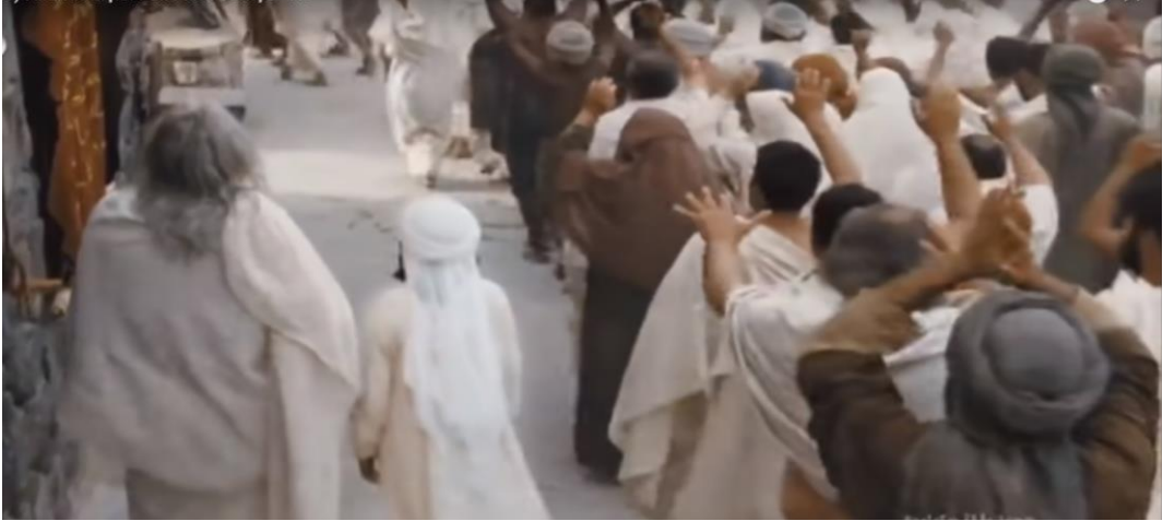
Kaynak: Mejidi, “ Hz. Muhammed: Allah'ın Elçisi”, 01:53:07

Hz. Muhammed'in dedesi belli bir süre sonra rahatsızlanır ve yatağa düşer. Hasta yatağında tüm akrabalarını toplayarak, Hz. Muhammed'i amcası Ebu Talip'e emanet eder. Abdülmuttalip, Ebu Talip'e Hz. Muhammed'i emanet ettiği sahnede şu ifadeleri kullanır. “Ebu Talip ona babalık yap, babası Abdullah'ı koklayamadı, anne şefkatini pek göremedi.” Bu sözlerde Hz. Muhammed'in yaşadığı duygusal anlamda boşluktan bahsedilmekte, Ebu Talip'ten Hz. Muhammed'i koruması, kendi evladı gibi görmesi ve hak ettiği sevgiyi gösterilmesi istenmektedir. [02:01:12 dk.]