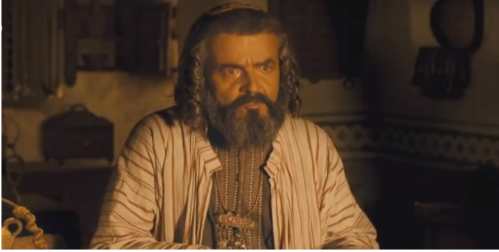
Kaynak: Mejidi, “ Hz. Muhammed: Allah’ın Elçisi”, 53:52.

Hz. Muhammed’in sütanesi olacak olan Halime, bir eşi, bir kızı olan yoksul bir aileye sahiptir. Mekke’ye sütannelik yapmak için ailesiyle gelir. Mekke içinde dolaşırken sütanne arayan bir kadını görür. Arkasından giderken başka bir sütanne adayı durumum çok kötü diye gördüğü kadının arkasına düştüğünü görerek, o kadının arkasından gitmeyi istemez. Halime bu davranışıyla kendinin, eşinin ve çocuğunun durumu sıkıntı olmasına rağmen fedakârlık etmektedir. Sütanne arayan kadının o sütannenin ihtiyacı olduğunu söylediğini işitince rızkını o kadına bırakmaktadır. Çok kısa, ara bir perdede kalan bu sahnede kendinden önce başkasını düşünmekle alakalı alt mesajlar işlenmektedir.