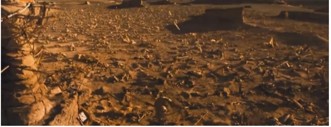
Resim 31: Ebrehe'in ordusunun kuşların ağızlarından attıkları taşlarla yok olması

Mejid Mejidi İslam kaynaklarında yer alan Ebrehe'nin ordusunun yok olmasına sebep olan kuşların 146 ağızlarından attıkları taşların, Ebrehe'nin ordusu üzerine alev taşları gibi düşmesi sahnesinde “mucize” kavramını işlemektedir. [29:51 dk.] Kâbe'ye karşı duyarlı olunması gerektiği, Allah'ın yeryüzünde bozgunculuk çıkaracaklara karşı neler yapabileceği bu sahnede en detaylı görsellerle işlenmektedir.