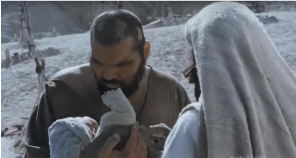
Kaynak: Mejidi, “ Hz. Muhammed: Allah’ın Elçisi”, 02:08:32