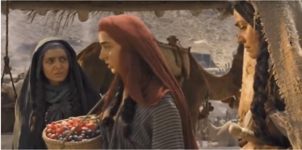
Kaynak: Mejidi, “ Hz. Muhammed: Allah’ın Elçisi”, 56:59.