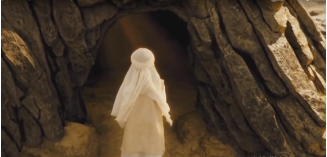
Kaynak: Mejidi, " Hz. Muhammed: Allah'ın Elisi", 01:17:19.