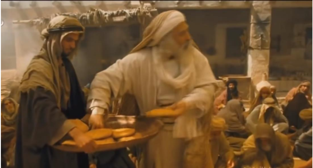
Kaynak: Mejidi, " Hz. Muhammed: Allah'ın Elçisi", 36:01.

Hz. Muhammed'in dedesi olan Abdülmuttalip, Hz. Muhammed'in dünyaya gelmesi sebebiyle Mekke'de bulunan tüm insanları yemeğe davet etme sahnesinde, özellikle aç olan insanları sofrasına çağırması, kendi elleriyle ikramlarda bulunması ile paylaşmanın zengin veya fakir gözetmeksizin herkese yapılması gerektiği vurgulanmıştır. [36:18 dk.]