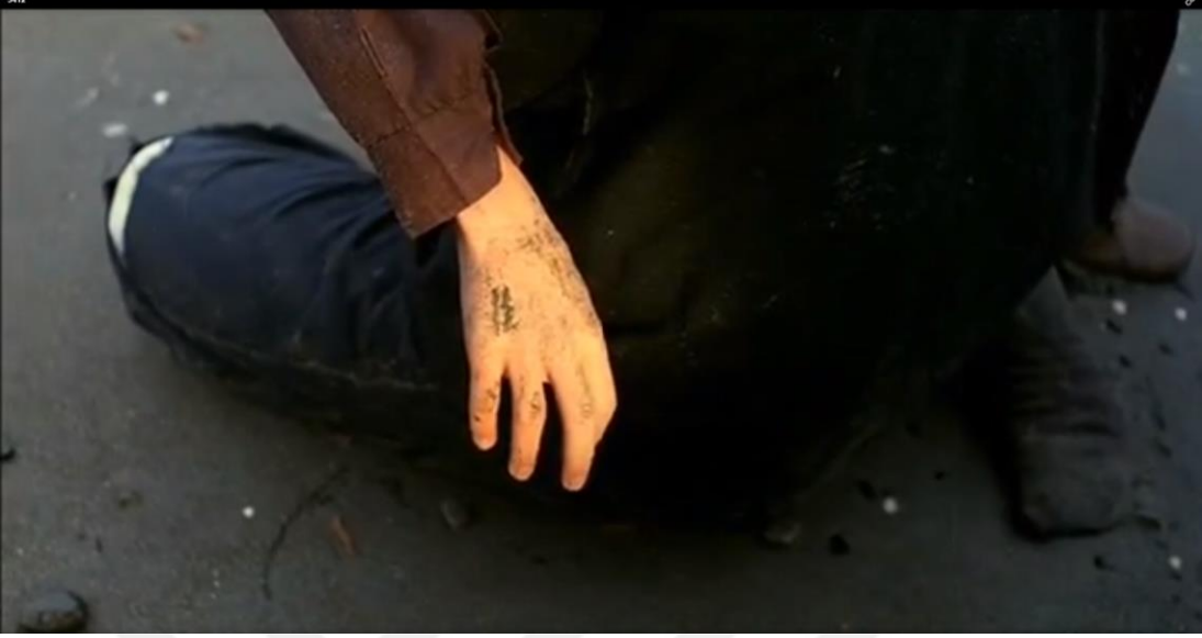
Resim 13: Muhammed'in Allah'ı bulduğuna dair tasvir edilen sahne, elinin parlaması anı.