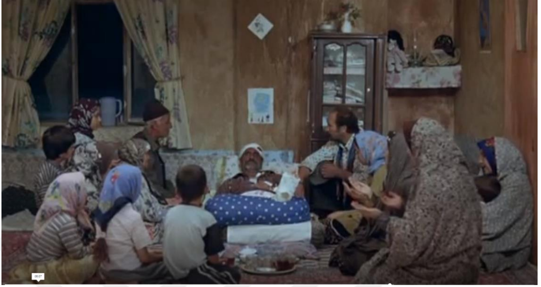
Kaynak: Mejidi, “Serçelerin Şarkısı”, (2008), 01:11:03

Bahçede biriktirdiği çöplerdeki parçalardan her gelen bir şey götürür. Onca biriktirme uçup gider gözlerinin önünde, ama şunun farkına varır ki, her giden parça onu kendine getirmeye başlar. Geri köyüne döner iyileştikten sonra belli bir süre sonra kaybolan deve geri gelir. Hayat yavaş yavaş eskisi gibi olur.