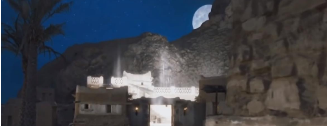
Resim32: Hz. Muhammed'in doğumu ve doğduğu evin ışıklarla nurlandırılması sahnesi