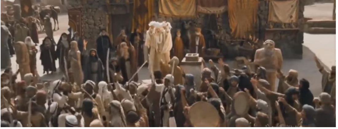
Resim35: Abdülmuttalip'in Kabe'de torununa isim verdiği sahne