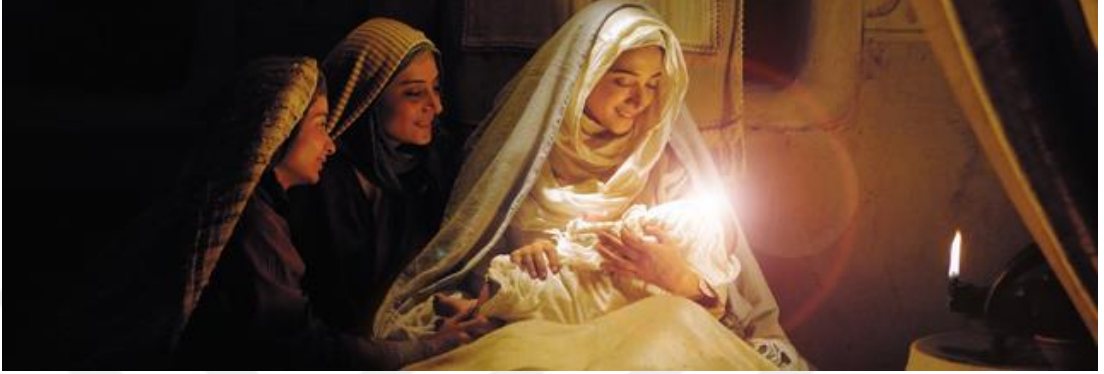
Kaynak: Mejidi, " Hz. Muhammed: Allah'ın Elçisi", 35:24.