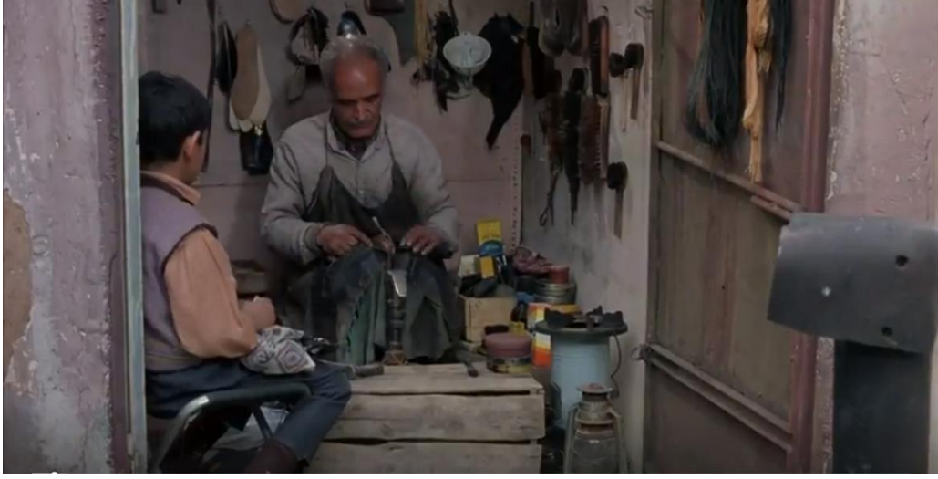
Resim 2: Filmin başlama sahnesi, pembe ayakkabının tamiri