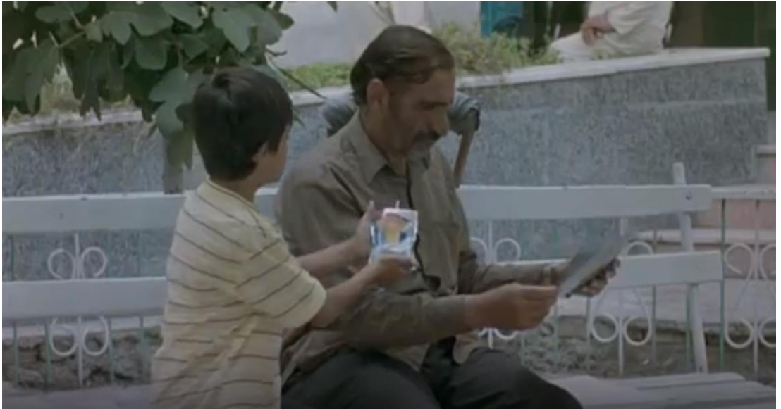
Kaynak: Mejidi, “Serçelerin Şarkısı”, (2008), 01:17:22