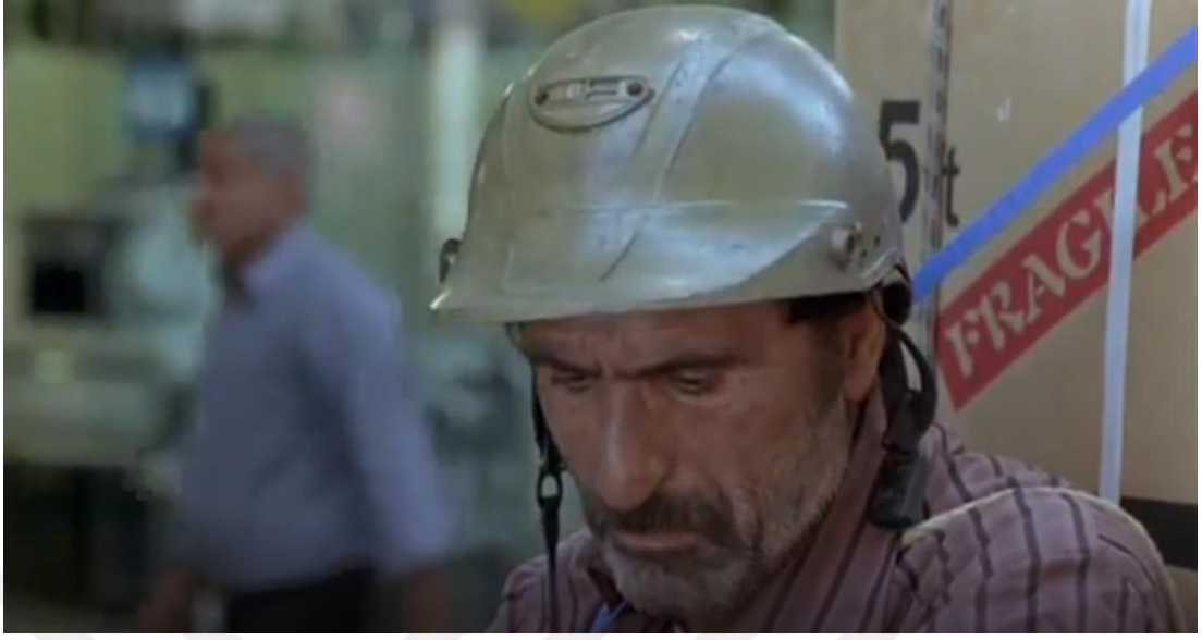
Kaynak: Mejidi, “Serçelerin Şarkısı”, (2008), 01:01:08

Taşımacılık yaparken, bir grup insan onu beyaz eşya taşımacılığına yönlendirir. Firma taşımacılara buzdolabı, televizyon, çamaşır makinası gibi beyaz eşyaları yüklerler. Karim'e buzdolabı gelir motosikletiyle firma sahiplerinin yüklediği beyaz eşyaları taşırken, taşıma ekibinden kopar motoru arızalanır ve taşıma ekibini bulamaz. İçinden bu mal benim de olabilirdi gibi bir his belirir. O anda deve kuşu çiftliğinden kaçan bir Deve Kuşu yüzünden işten atıldığını hatırlar ve malı firma sahibine teslim eder. İnsanın benliğinde eğer değerler kirlenmişse de, “özde olan iyi tarafın her zaman ortaya çıkabileceği” vurgulanmaktadır. [01:01:56 dk.]