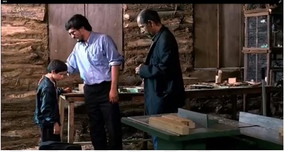
Kaynak: Mejidi, "Cennetin Rengi", (1999), 56:17

Muhammed, marangoza körler okulundaki öğretmenin ona Allah'ın körleri sevdiğini söylediğini söyler. Üzerine öğretmenin Muhammed'e istersen Allah'ı ellerinle bulabileceğini de söylemesi, Muhammed'e bir umut olur. Bu sahne ile din kavramı üzerinden Muhammed'in yaşama ve hayata tutunması istenmiştir. [57:59 dk.]