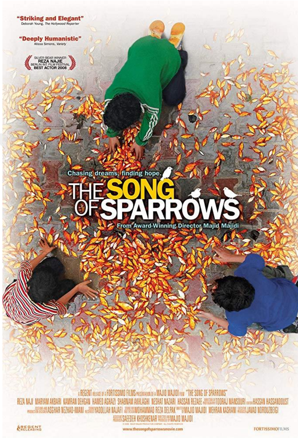
Resim 27: “Serçelerin Şarkısı (Avaze Gonjeshk-ha)” Film Afışı