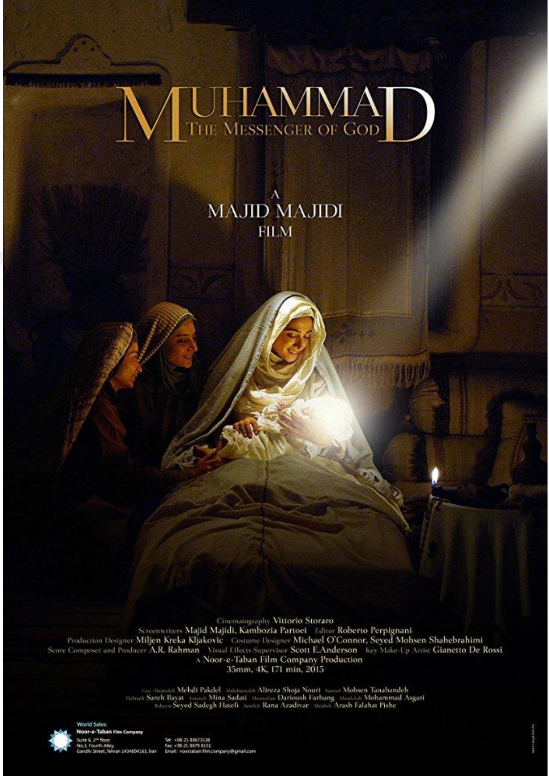
Resim 49: “Hz.Muhammed: Allah’ın Elçisi ( Mohammad Rasoolollah)” Film Afışı