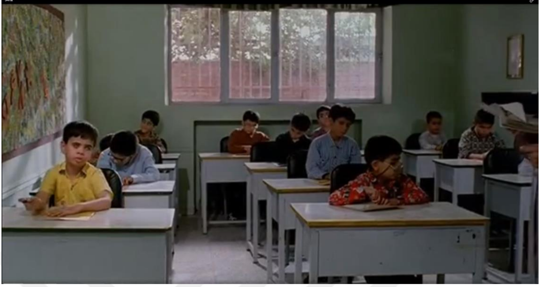
Resim 9: Körler okulunda Muhammed'in Braille alfabetiyle yazı yazdığı sahne.