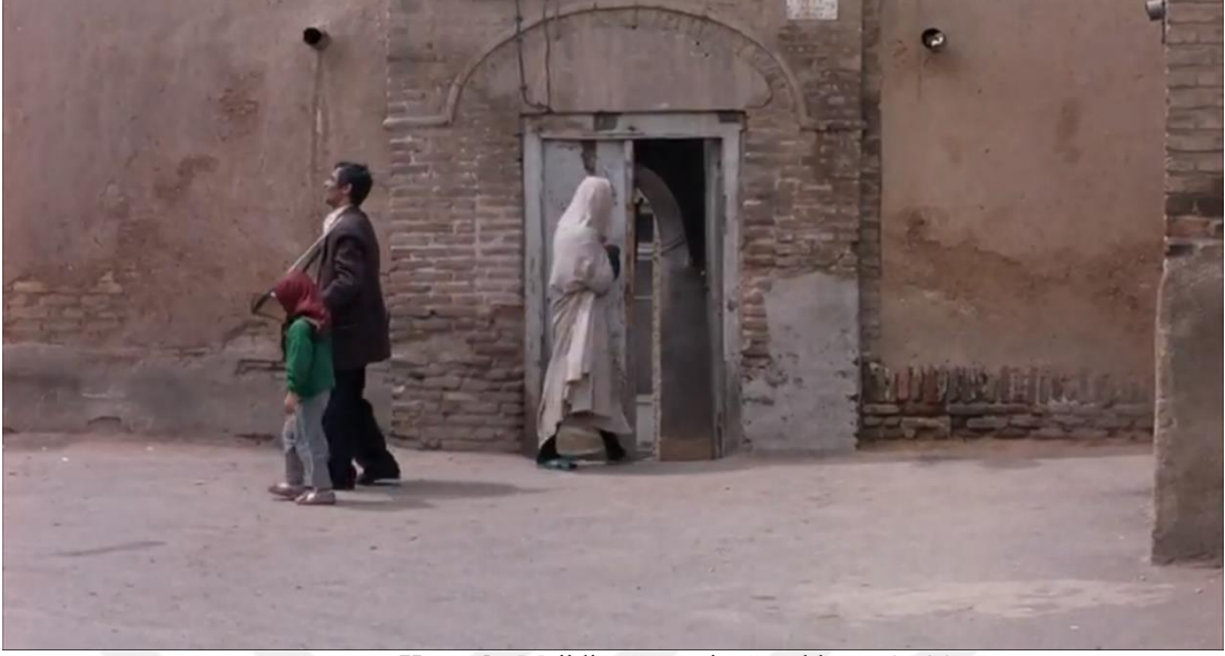
Kaynak: Mejidi, “Cennetin Çocukları”, 45:34

Ali ve Zehra'nın ayakkabıları alan kızın babasının kör olduğunu ve durumlarının kötü olduğunu görmeleri, kendilerinin de o ayakkabıya muhtaç olmalarına rağmen paylaşmanın söz konusu olabileceği vurgulanmaktadır.