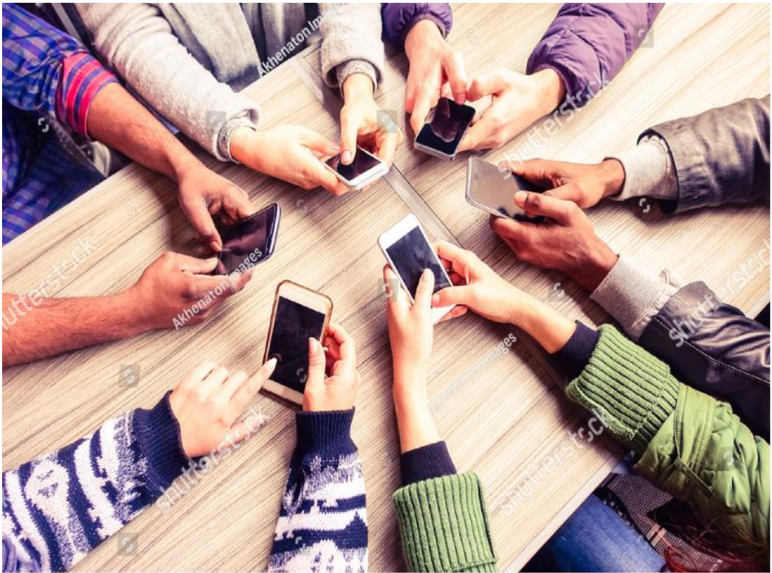
Şekil 2.2. Akıllı Telefonlar

Akıllı telefon, sadece arama ve mesajlaşma gibi temel telefon fonksiyonları ile sınırlı cihazlara ek olarak daha ileri seviyede işlem yapabilen, iyi bir mobil internet deneyimi sağlayan, üzerine farklı mobil uygulamalar yüklene bilen cihazlara denir. Bu cihazlarla dünya gündemini takip etmek, e-mail alıp gönderebilmek, internette gezinmek, sosyal ağlara bağlanmak, müzik dinlemek, oyun oynamak ve bilgi edinmek gibi ihtiyaçların karşılanmasında önemli etkileri vardır. Ancak akıllı telefonların bu gibi amaçlarla kullanabilmesi için internet bağlı olması gerekmektedir. Aslında insanları bu cihazlara bağımlılık yapacak kadar bağlı kılan en büyük etkenlerin başında internet ağının olduğunu söyleyebiliriz.(3, 33, 32).