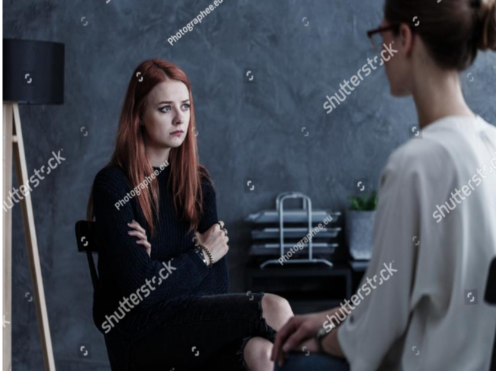
Şekil 2.1. Ergenlik Dönemi