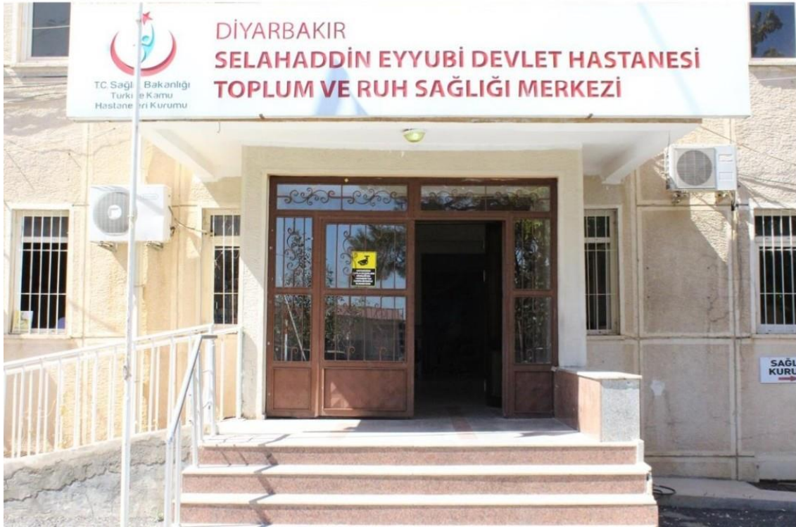
Şekil 3.1. Diyarbakır Toplum Ruh Sağlığı Merkezi

Araştırma Diyarbakır Toplum Ruh Sağlığı Merkezi'nde Mayıs 2018-Kasım 2018 tarihleri arasında yürütülmüştür. Diyarbakır Toplum Ruh Sağlığı Merkezi (TRSM); spor, eğitim, iş-uğraş, okuma, görüşme, televizyon ve yemek salonlarından oluşmaktadır. TRSM' de psikiyatri uzmanı, psikolog, hemşire ve diğer personeller görev almaktadır. Diyarbakır Toplum Ruh Sağlığı Merkezi Şekil 3.1. de gösterilmiştir.