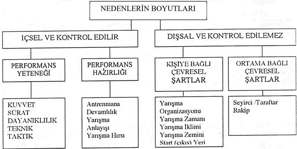
Şekil 4. Nitsch ve Allmer'in başarı ve başarısızlığa ilişkin sınıflandırma modeli

Nitsch ve Allmer (1976) yapmış oldukları sınıflandırma şemasını, iki ana bölüme ayırarak sporcuların başarı ve başarısızlık nedenlerini araştırmışlardır.