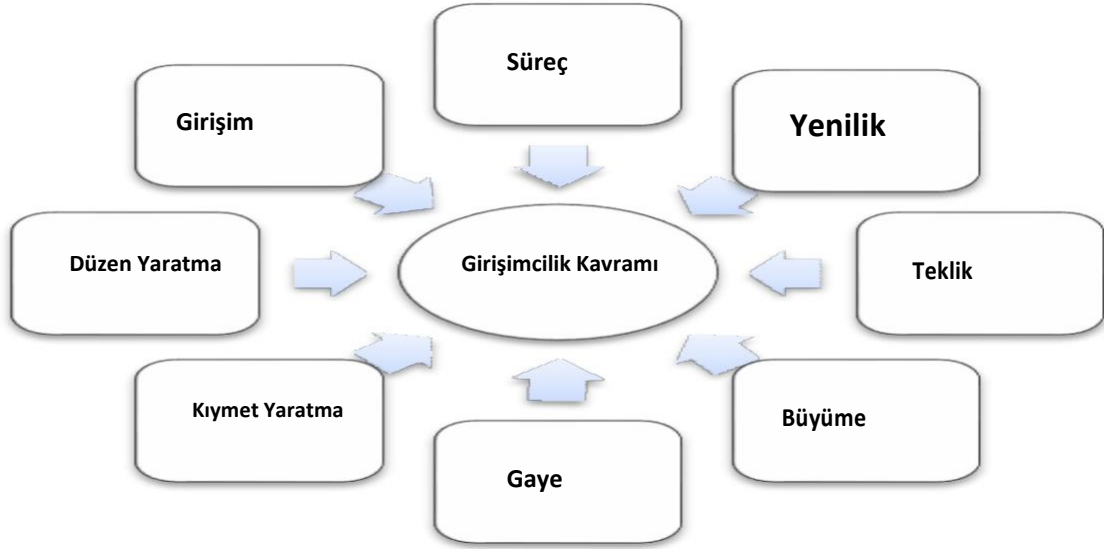
Şekil 2.1. Girişimcilik Kavramı (14).

Naktiyok girişimciliği açıklarken sekiz temel kavramdan söz etmektedir (14). Şekil 2.1' de belirtilmiştir.