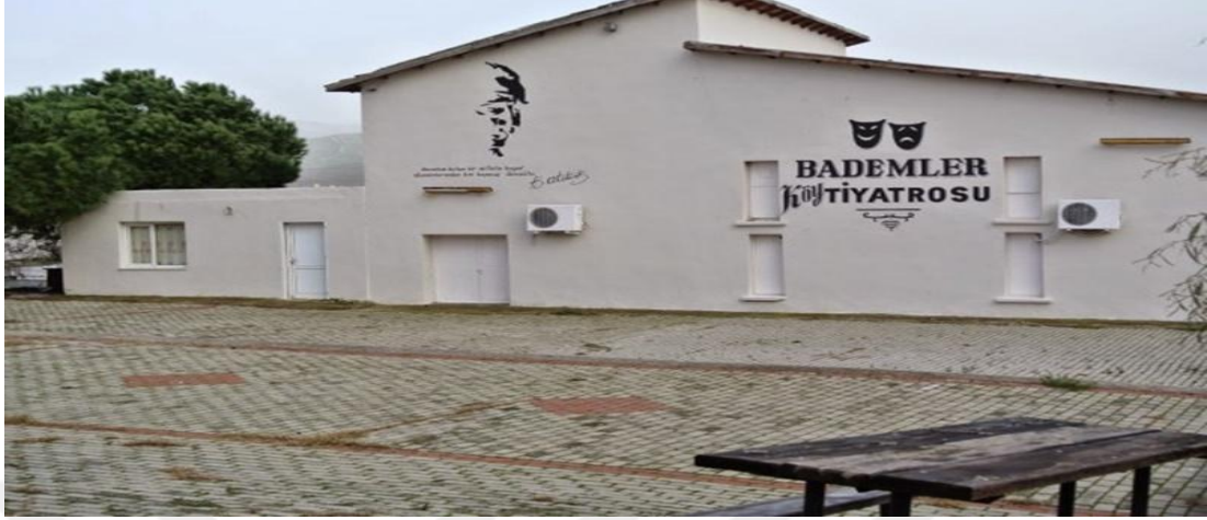
Şekil 4. Bademler Köy Tiyatrosu