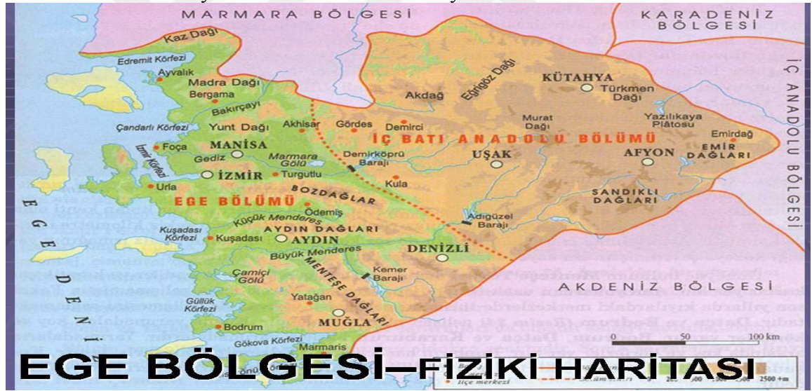
Şekil 2. Ege Bölgesi Fiziki Haritası

Urla, 38°18'K 26°45'D koordinatlarında yer almakta olup, İzmir il merkezine 35 km uzaklıkta bir ilçe. Doğusunda Güzelbahçe ve Seferihisar; batısında Çeşme; kuzeybatısında Karaburun; kuzeyinde ve güneyinde Ege Denizi ile sınırlanmıştır. Yüzölçümü 704 km 2 'dir. 16 köyü bulunmaktadır. Bademler ise Güzelbahçe'den başlayıp Seferihisar'a doğru uzanan geniş koridorun ortalarında, İzmir'e 35, Seferihisar'a ve Urla'ya 9'ar km. uzaklıkta bir köy