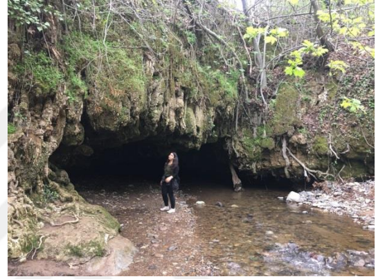
Şekil 3.7. Nebiler Vadisindeki Şelale ve Mağaralar ile Ağlayan Mağarası