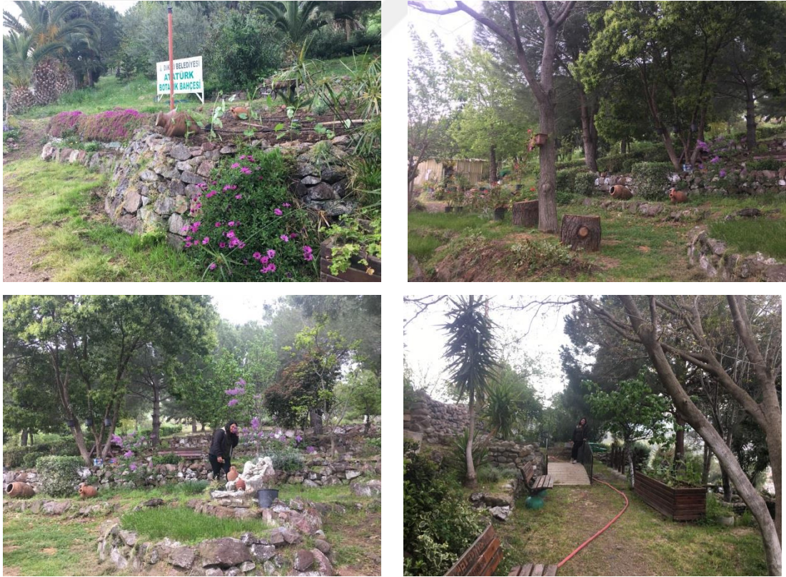
Şekil 3.10. Atatürk Botanik Bahçesi

Atatürk Botanik Bahçesi: İlçedeki en önemli botanik turizm alanı yapay da olsa Atatürk Botanik Bahçesi'dir. Doğa aşığı, merhum Macit Ersoy tarafından; Dikili Belediyesinin gösterdiği, 30 hektarlık alanda oluşturulmuştur. Ersoy, gezdiği tüm ülkelerden getirdiği bitki tohumlarını yetiştirerek, Türkiye'nin halka açtığı ilk botanik bahçesini oluşturmuştur. Evet, burası, ülkemizin en yetkin ve uluslararası nitelikteki tek botanik bahçesidir. Arboretum'da, yüzlerce ağaç ve çalı türü yetiştirilmektedir (Şekil 3.10).