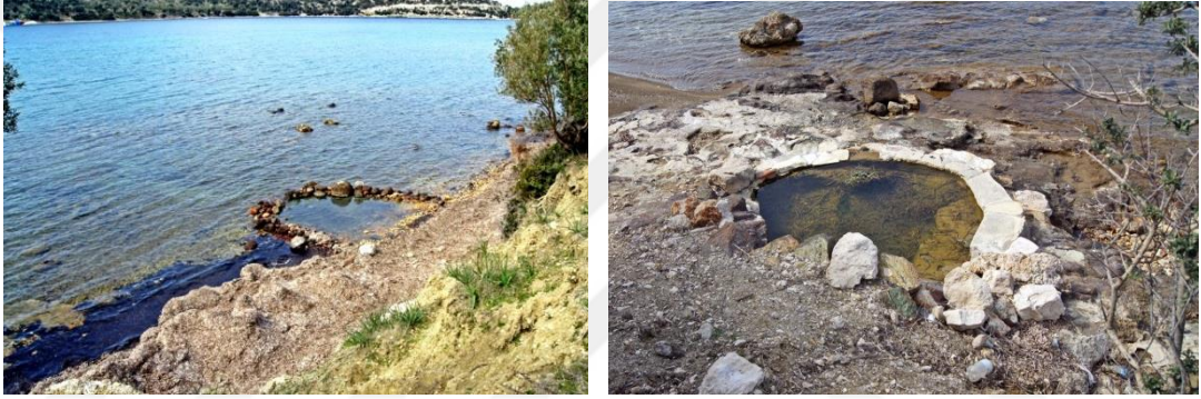
Şekil 3.12. Bademli Ilıcası

Bademli Deniz Ilıcası: Bademli'den, Denizköy'e giderken, 3 km ilerledikten sonra, asfalt yoldan sağa dönüp, toprak yoldan denize inilir. Yaş-kış, burada hem denize, hem de ılıcaya girmek mümkün. Bademli ılıcasının kaynak sıcaklığı: 65 derece. Hidroasenat ve arsenik bulunan su: ağrı, sızı, romatizma, böbrek taşı ve cilt hastalıklarına iyi geldiği söylenmektedir (Şekil 3.12).