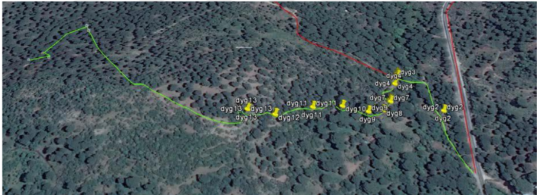
Şekil 3.6. Antik Perperene Yolu doğa yürüyüş güzergâhı Google Earth görüntüsü, [58] (Musa Genç 2017’den alınmıştır).