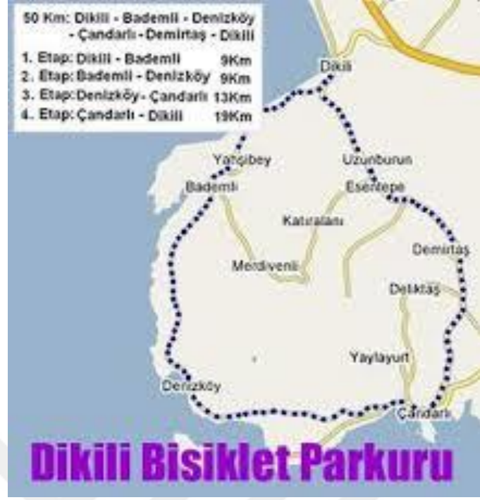
Şekil 3.8. Dikili Bisiklet Parkuru ( www.dikiliguide.com 'dan alınmıştır).

Öncelikle ilçenin doğal özellikleri ve çekiciliklerine uygun olarak “Dikili Bisiklet Turizmi Güzergahları” rehberi hazırlanmalıdır. Bu rehberde Farklı Malzemelerle Üstü Kaplanmış Patikalarda yapılacak olan Bisiklet Turizmi ile Kaplamasız Yol ve Patikalarda Bisiklet Turizmi ayrı ayrı gösterilebilir.