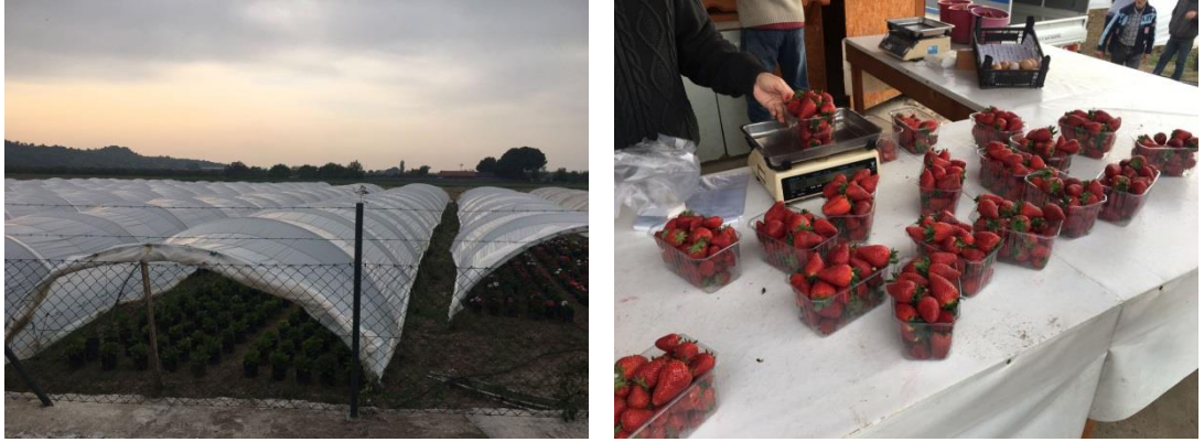
Şekil 3. 13. Bölgedeki Seralar ve Çilek Üretimi

İlçeye farklı tarihlerde yapılan gezilerde özellikle Dikili- Ayvalık karayolu üzerinde pek çok seranın olduğu ve bu seralarda sebzelerin yanında son yıllarda çilek üretiminin de arttığı tespit edildi. (Şekil 3.13).