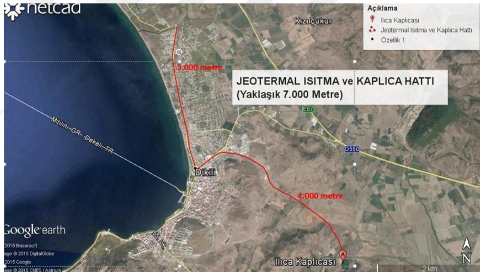
Şekil 3.11. Jeotermal Bölge Haritası ( www.dikiliarge.com 'dan alınmıştır)

Kaynak : MTA Genel Müdürlüğü, Türkiye Jeotermal Kaynakları Envanteri [80].