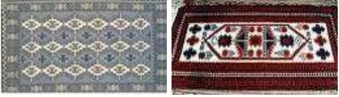
Şekil 3.17. Dikili Kilimleri (Karatepe- Merdivenli) ve Halıları (Yağcı Bedir)