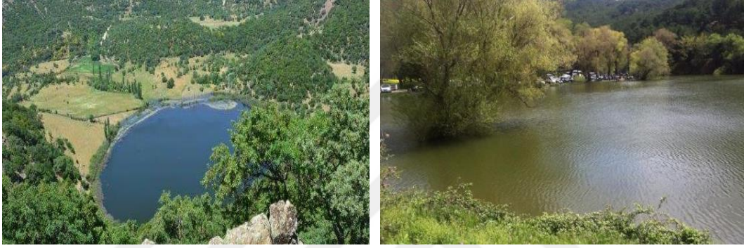
Şekil 3.9. Farklı Açılardan Karagöl

Ülkemizin hemen her kıyısında, göl ve nehirlerinde sportif olta balıkçılığı yapmak mümkündür. Kirlenmenin yoğun olduğu bölgelerde artık pek balık kalmasa da hala amatör balıkçıların yüzünü güldüren pek çok avlanma noktası vardır. İlçede denizde profesyonel balıkçılık yapan tekneler olduğu gibi amatör olarak sportif olta balıkçılığı yapanlar da bulunmaktadır. Ayrıca en önemli akarsu olan Bakırçay ırmağında da amatör olta balıkçılığı yapılmaktadır. Yine Karagöl bölgesinde sportif olta balıkçılığı yapılmaktadır. (Şekil 3.9.).