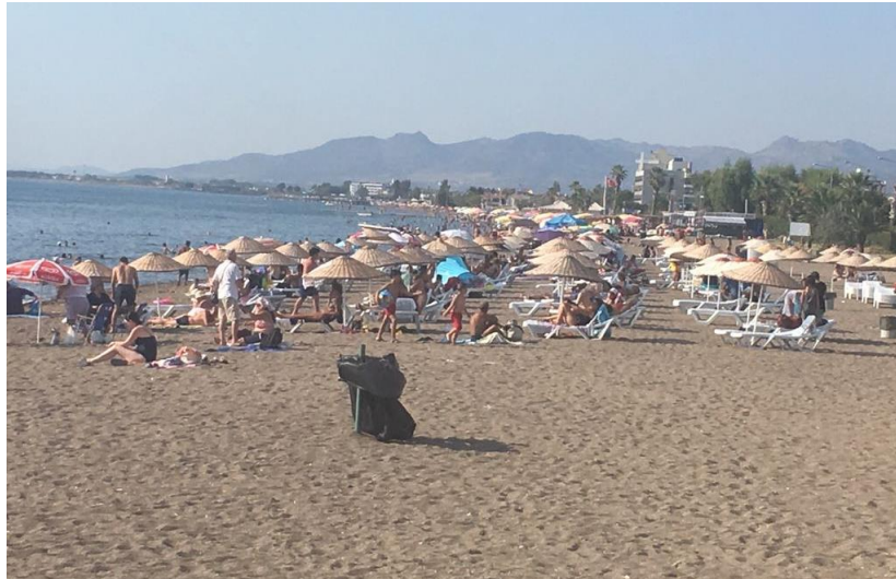
Şekil 3.3. Mavi Bayraklı Dikili Halk Plajı Fotoğrafları