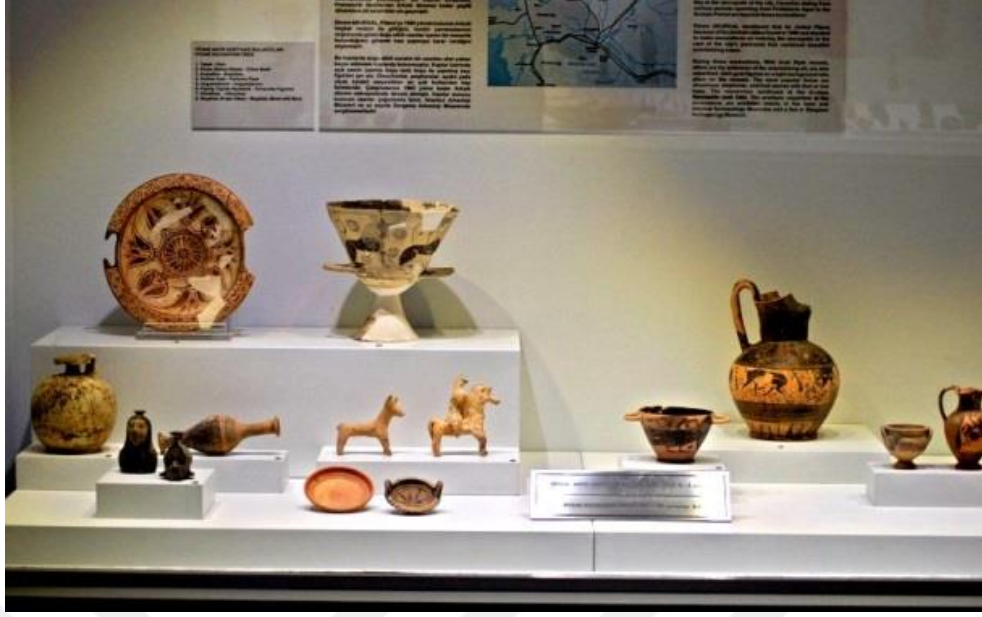
Şekil 3.15. Bergama Müzesi'ndeki Pitane Bölümü

Tarih, sağlık, kültür, doğa ve deniz turizminin bir arada bulunduğu Dikili, gelenleri kendine hayran bırakıyor. İlçe ayrıca, içinde olduğu kadar çevresinde de çok sayıda gezilecek yere sahip oluşuyla da dikkat çekiyor. Ziyaretçilerin rotasına almaları gereken yerler arasında Ayvalık, Bergama ve Assos gibi birbirinden güzel kentler bulunmaktadır. Özellikle sadece 28 km uzaklıktaki Bergama'nın Dünya Kültür Miras Listesine girmesi, Ayvalık ilçesinin 37 km mesafede olması ilçenin cazibesini artıran unsurlardır.