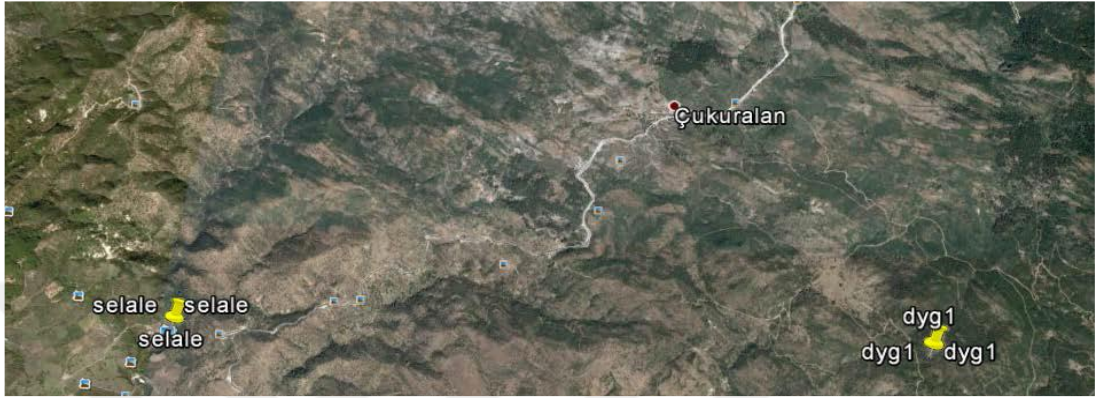
Şekil 3.5. Aşıklar Şelalesi ve Çukuralan bisiklet turizmi güzergahlarının Google Earth görüntüsü. [58] (Musa Genç 2017’den alınmıştır).

sınıfının her birinden asgari bir adet güzergâhı, kullanım dönemleri ve taşıma kapasiteleri ile birlikte belirlemek ve her güzergâh üzerinde sağlı – sollu 10’ar metrelik (URL-2) şeritlerde yer alan endemik, anıtsal ve/veya özellikli ot, çalı, ağaççık ve ağaçların bulunduğu yerlere ait konumsal ve fizyografik bilgileri, türlere ait sistematik ve morfolojik özelliklere yer verilmelidir [58].