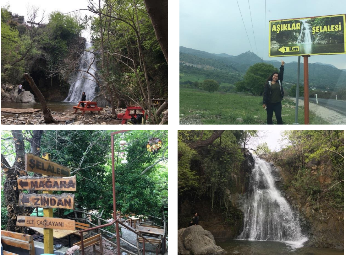
Şekil 3.16. Aşıklar Şelalesi

Aşıklar Şelalesi'nin Hikayesi: Bir rivayete göre, peri padişahının kızı Sümeyra, civar köylerden Yörük Ali'ye gönlünü kaptırır. Yörük Ali de Sümeyra'ya. Ne var ki peri padişahı kızını bir ölümlüye vermek istemez ve bu aşka izin vermez. İki aşık çaresiz kalır. ( Şekil 3.16.) Nebiler vadisindeki koca çınarın altında her gün gizlice buluşur, hasret giderirler. Sonra da birbirilerine sarılır saatlerce ağlaşırlar. Bunu öğrenen peri padişahı bu aşka son vermek için askerleri ile birlikte aşıkların peşine düşer. Amacı Yörük Ali'yi öldürmektir. Tam onları yakalamak üzereyken koca çınar yarılr ve aşıkları içine alır. Bu mucize karşısında peri padişahı insafa gelir. Ancak aşıklar aşklarının sonsuza kadar sürmesi için tanrıya dua ederler. Tanrı da onları kayalıklardan akan bir şelaleye çevirir. Aşkları sonsuza kadar sürer. Kızını sonsuza kadar kaybeden peri padişahı şelalenin yukarısındaki mağaraya çekilir, gözyaşları döker. Ağlama seslerini duyan çevre sakinleri mağaraya “Ağlayan Mağara” adını verir [67].