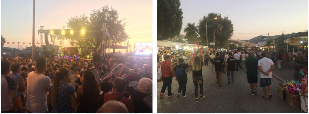
Şekil: 3.18. Dikili Kültür-Sanat Bilim-Düşünce ve Emek Festivali – 28-30 Ağustos 2017