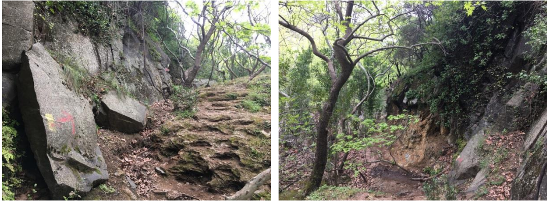
Şekil 3.4. Bölgedeki Doğa Yürüyüş Parkurlarından Görünüş

Çalışma alanındaki doğa yürüyüş güzergahları belirlemek amacıyla çalışmalar yapılmalıdır. Öncelikle "Dikili Doğa Yürüyüş Güzergahları" rehberini hazırlamalı, zorluk derecelerine (1- Çok kolay, 2- Kolay, 3- Orta, 4- Yorucu, 5- Çok zor) göre farklı güzergahlar belirlenmelidir. Diğer aktiviteleri etkilemeyecek ve beş güzergâh