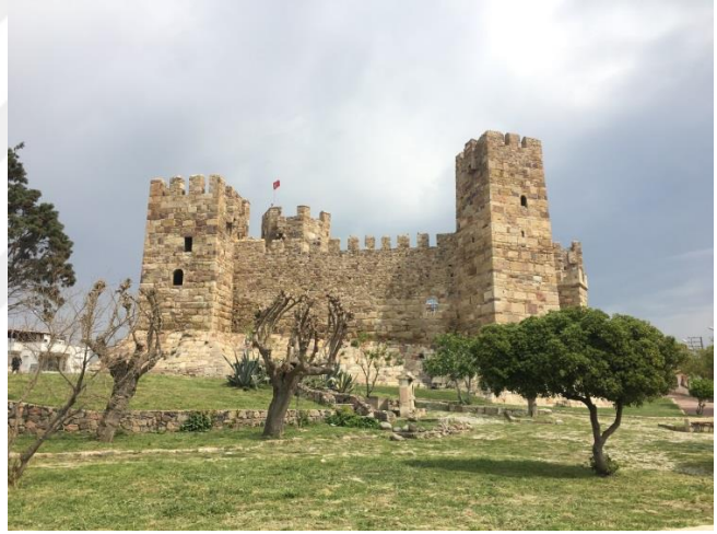
Şekil 3.14. Çandarlı Kalesi

Pitane Antik Kenti: Kelime anlamı olarak suyu bol anlamında gelen Pitane Antik Kenti, bölgede en çok ilgi gören yerler arasındadır. Çandarlı’da bulunan antik kentin kuruluş tarihiyle ilgili pek fazla bir bilgi bulunmasa da Helen öncesi dönemden olduğu söylenmektedir. Kent hakkındaki bilgi azlığına rağmen, burada çıkarılan vazolar, kadehler, mezarlar, ölü külü kapları ve en önemlisi arkaik bir erkek heykeli görülmeye değer kalıntılardandır. Eserlerin bir kısmı Bergama Müzesi’nde sergilenmektedir (Şekil 3.15).