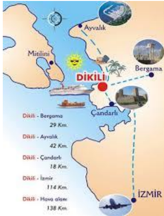
Şekil 3.2. Dikili Ulaşım Haritası ( www.dikiliguide.com adresinden alınmıştır).

Dikili-İzmir arası uzaklık: 118 km. Dikili-İstanbul arası uzaklık: 605 km. Dikili-Ankara arası uzaklık: 580 km. Dikili-Ayvacık arasındaki uzaklık: 42 km. Dikili-Altınova arasındaki uzaklık: 25 km. Dikili-Bergama arasındaki uzaklık: 24 km. Dikili-Kınık arasındaki uzaklık: 42 km. Dikili-Midilli arasındaki uzaklık ise: 18 mil. (Şekil 3.2).