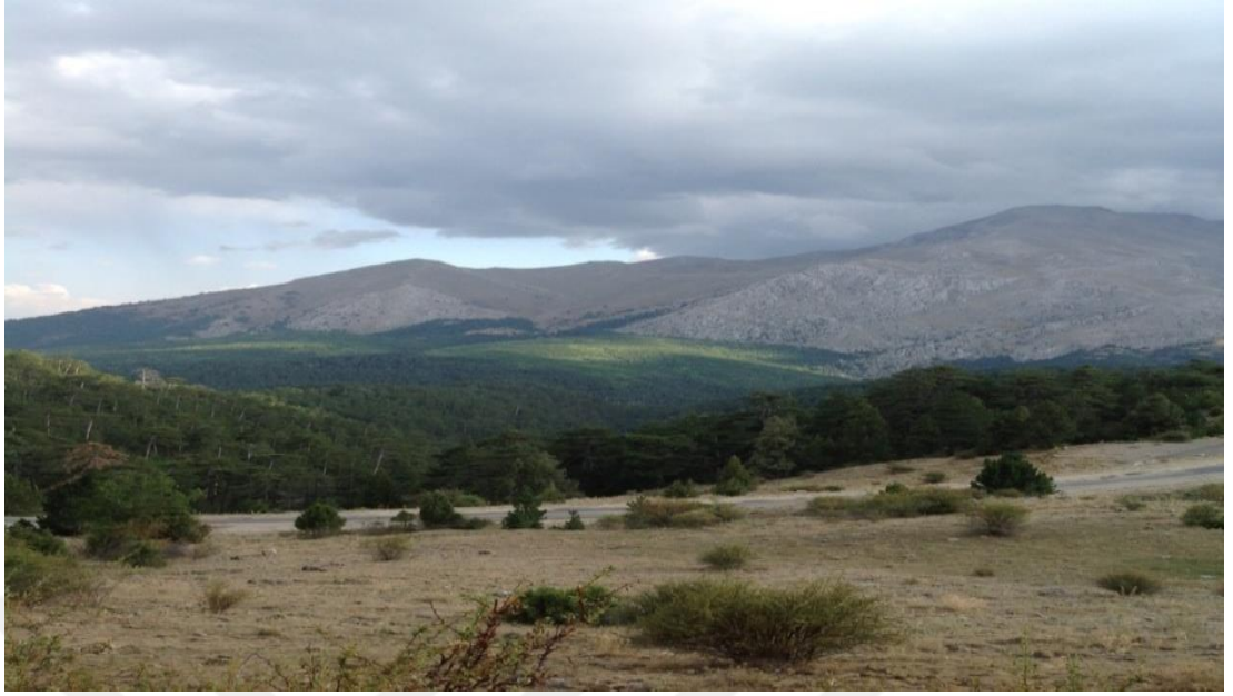
Şekil 4.26: Dedegöl Dağı etekleri [86].