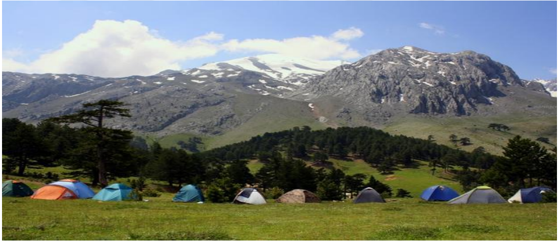
Şekil 4.25: Melikler Yaylası [103].

1996'dan bu yana mayıs ayında dünyanın her yerinden gelen dağcılar Melikler Yaylasında Dedegöl Dağı'nın zirvesine çıkmak için toplanmaktadır. Yaylalarda koyun ve keçi beslenmekte ve arıcılık yapılmaktadır [82].