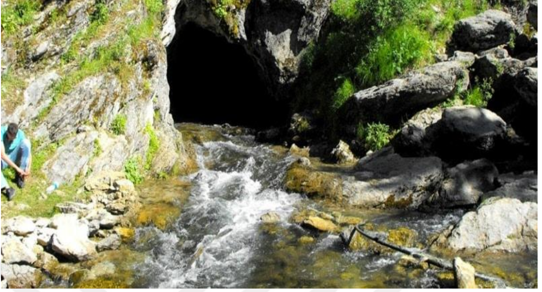
Şekil 4.7: Pınargözü Mağarası [93].