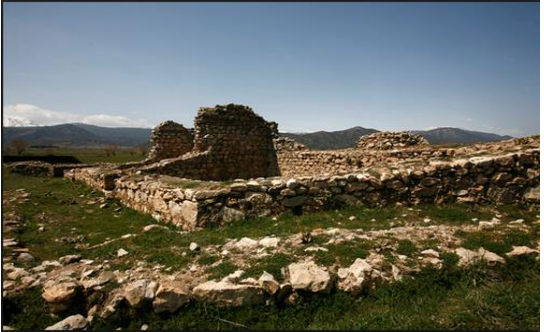
Şekil 4.12: Malanda köşkü [94].

Malanda Köşkü, Kubad-ı Abad sarayının 10 km. batısında çiftlik köşkü veya uç karakol binası olarak inşa edilmiştir (Şekil 4.12).