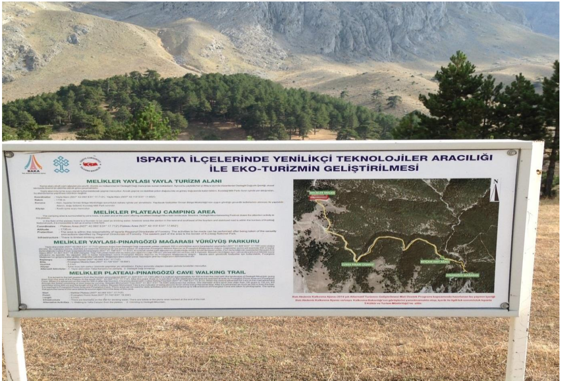
Şekil 4.27: Melikler Yaylası girişi [86].