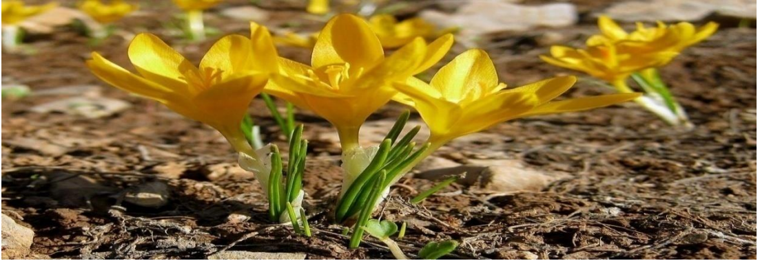
Şekil 4.21: Çiğdem çiçeği [87].

İlçede başlıca bulunan Çiğdem, Karahan Çalısı, Kardelen çiçeği, Gurbet çiçeği ve Ak Meşeyi de endemik türler içinde sayabiliriz. İlçede 213 endemik bitki türü bulunmaktadır [94]. Şekil 4.21’de Çiğdem Çiçeği ile ilgili görsel yer almaktadır.