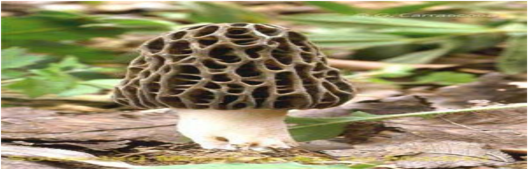
Şekil 4.18: Kuzugöbeği Mantarı [87].

Kuzugöbeği Mantarı: Latince adı Morchella esculanta olarak bilinir. İlçede bahar aylarında bol miktarda yetişen bu mantarın yapılan araştırmalara göre, kansızlığa faydalı, bağışıklık sistemini, zihinsel fonksiyonları güçlendirmede etkili olduğu, bağırsak ve mide rahatsızlıklarına bağlı şikâyetleri azalttığı, kansere karşı destek sağladığı ifade edilmektedir. Dünyaca tanınan ve ekonomik değeri olan Kuzugöbeği mantarını, ne yazık ki halkımız yeterince tanımamakta ve bu bitkinin sağladığı faydalardan yararlanamamaktadır. Bu değerli gıda kaynağının kendi ülkemiz insanları tarafından da tanınması, kolay ulaşılabilir olması, halk sağlığı açısından büyük avantajlar sağlayacaktır [98]. Şekil 4.18’de Kuzugöbeği mantarının görseli gösterilmektedir.