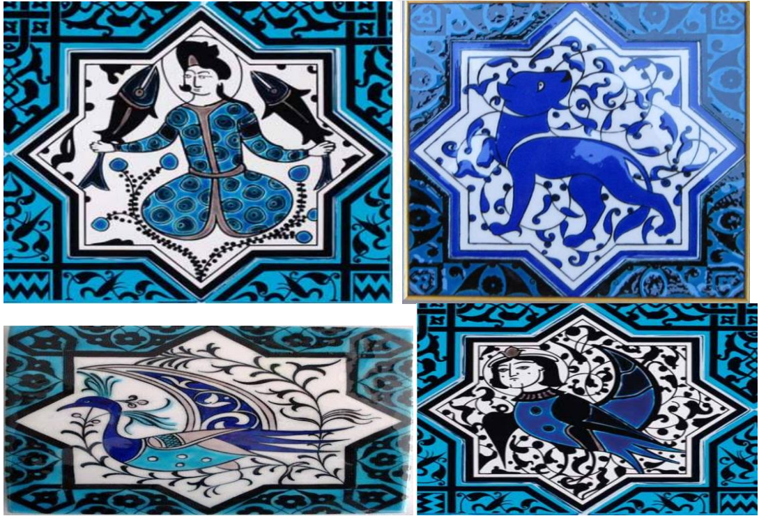
řekil 4.10: Bulunan çini örnekleri [87].