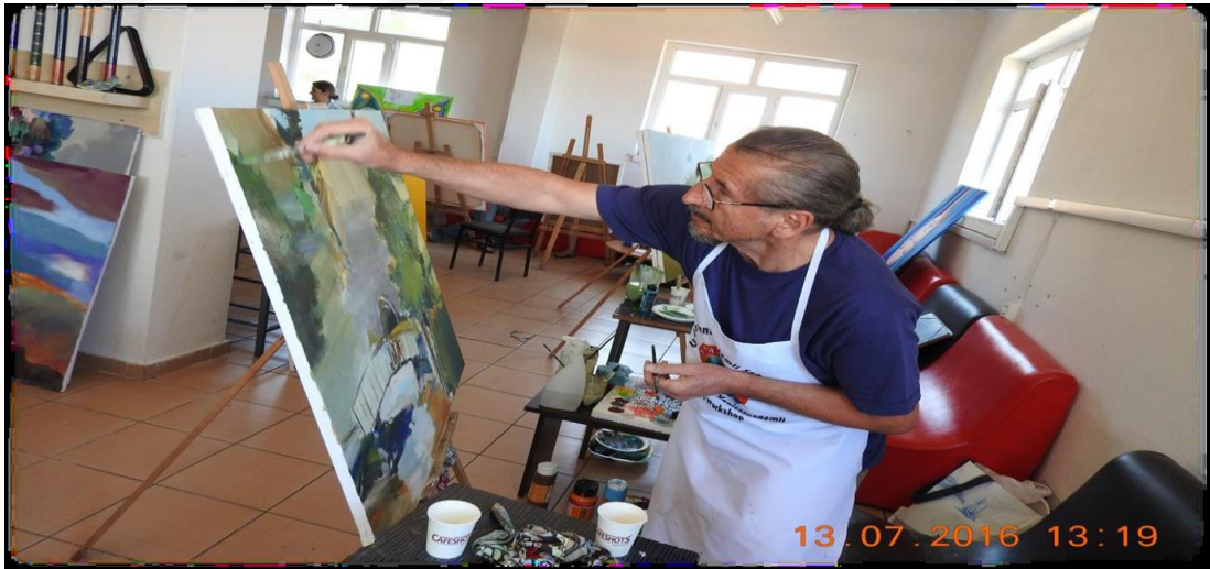
Şekil 4.29: Resim çalıştayı [107].

Yenişarbademli’yi sanatla bütünleştiren uluslararası boyuta taşıyan resim çalıştayı, Türkiye ve dünyanın her bölgesinden amatör ve profesyonel resim sanatçıları ağırlamaktadır. Temmuz 2016 yılında altıncısı düzenlenen çalıştayın resimleri, 12 ülkenin katılımı ve 23 sanatçı tarafından oluşturulan eserlerle Antalya’da sergilenmiştir. Bu sergi sayesinde Yenişarbademli’nin yöre özellikleri ve güzelliklerini tanıtmaya fırsatı olmuştur [106]. Şekil 4.29’da bir resim çalıştayı örneği gösterilmektedir.