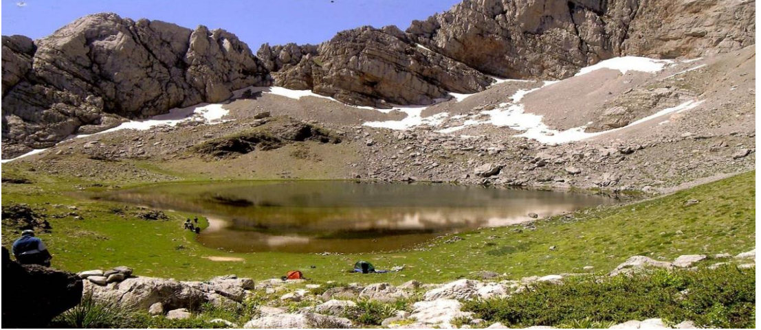
Şekil 4.17: Karagöl [97].