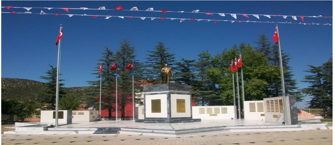
Şekil 4.5: Şehitler Anıtı [87].

Yenişarbademli Belediye Başkanı Mustafa Erdem tarafından yaptırılan ve 2010 yılında açılışı yapılan anıt, hükümet konağı meydanındadır (Şekil 4.4). Selçuklu kültür ve sanatının temel figürlerinden, müslüman ve ortadoğu toplumlarında sıkça kullanılmış olan sekiz köşeli yıldız esas alınarak inşa ettirilen anıt üzerinde 1877-1878 Osmanlı-Rus Savaşından (93 harbi) günümüze kadar 163 Şehit ve Gaip ile 25 resmi Gazisinin künyeleri yer almaktadır. Yıldızın Sekiz köşeli olması, buranın Selçuklu Devleti'nin başkenti olduğunu göstermesi açısından önemlidir. Üzerinde bulunan, Türkiye Cumhuriyeti'nin kurucusu Mustafa Kemal Atatürk heykeli, tarihteki 16 büyük Türk devletinin kültürü ile yoğrulmuş Türkiye Cumhuriyetini temsil etmektedir [89]. Şekil 4.5'te Şehitler Anıtı görseline yer verilmektedir.