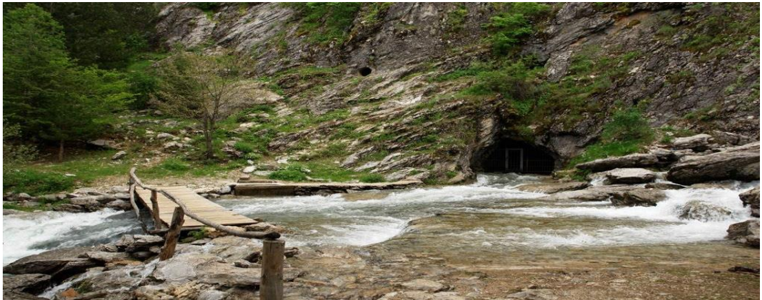
Şekil 4.6: Pınargözü Mağarası ağız kısmı [92].

Bölgede bulunan dünyanın en büyük yeraltı ırmağı, Beyşehir Gölü ile Manavgat Çağlayanı arasında akar. Mağaranın içinde değişik büyüklükte gölcükler, şelaleler, damlataş havuzları ve her türden damlataş birikimleri geniş yer kaplar. Aynı zamanda bir su kaynağı olan mağaranın bulunduğu bölge, zengin bitki örtüsüne sahip olup, çevre ilçelerde yaşayan halk tarafından piknik alanı olarak kullanılmaktadır, Pınargözü mağarasının etüdünün yapılması halinde ülke turizmine katkısının büyük olacağı ifade edilmektedir [91]. Şekil 4.6/Şekil 4.7 / Şekil 4.8 / Şekil 4.9'da Pınargözü mağarası ile ilgili çeşitli resimler gösterilmektedir.