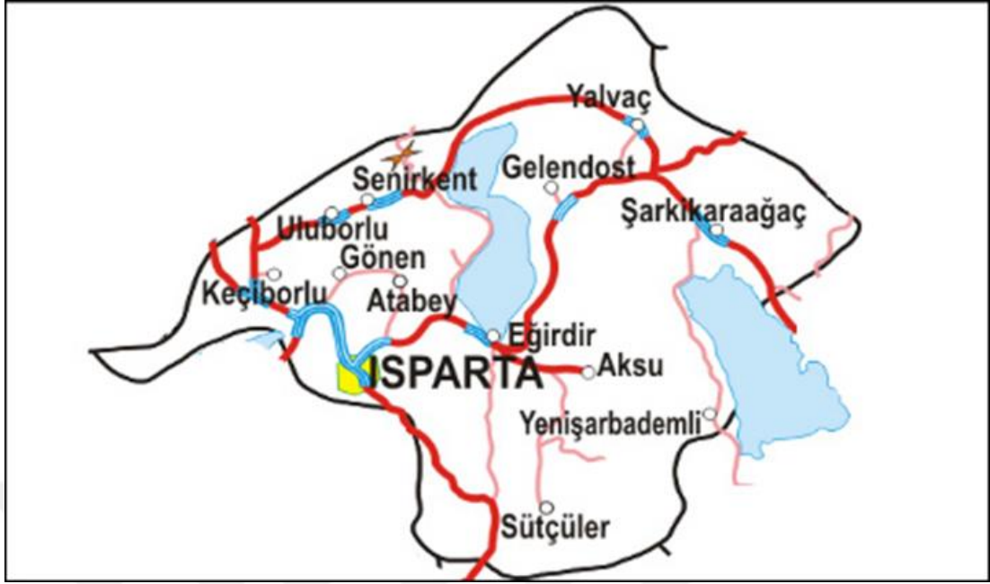
Şekil 4.2: Isparta ilinin ilçeleri [85].