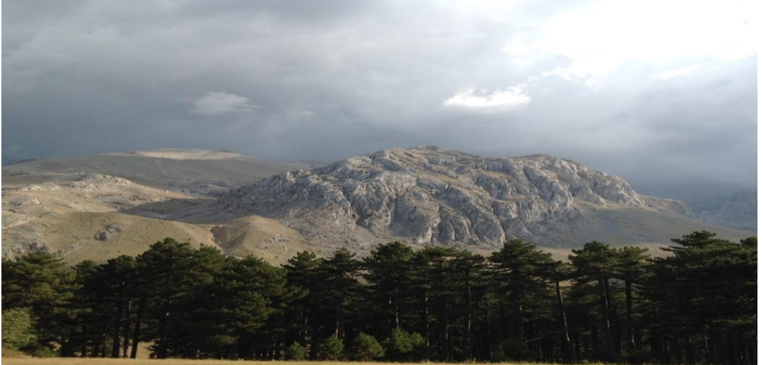
Şekil 4.14: Dedegöl Dağı'na Melikler Yaylası'ndan bakış [86].

Dedegöl Dağı, dağ yürüyüşü, kamp, tırmanma için uygun yer ve imkânlarla sahiptir. Dağın eteğindeki Melikler yaylasında her yıl mayıs ayında dağcılar çadır kurarak dağcılık şenliği kapsamında dağın zirvesine tırmanmaktadırlar. Çevresinde endemik bitkiler vardır. Dedegöl Dağı üzerindeki Karagöl ve sadece dağın eteklerinde yetişen Dedegöl Çiçeği dağcıların ilgi odağıdır [95]. Şekil 4.14/ Şekil 4.15 / Şekil 4.16'da Dedegöl Dağı ile ilgili resimler gösterilmektedir.