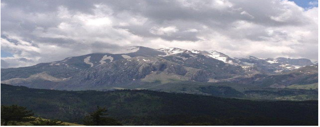
Şekil 4.15: Dedegöl Dağı [96].