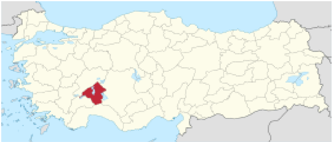
Şekil 4.1: Isparta ilinin Türkiye haritasındaki yeri [84].

İlçe toprakları dağlık olup batısında Dedegöl Dağı yer almaktadır. İlçenin ekonomisi tarım ve hayvancılığa dayalı olup doğal bitki örtüsünü bozkır bitkileri oluşturmaktadır. Yenişarbademli'nin, başlıca gelir kaynakları, tarım, hayvancılık, orman işçiliği ve balıkçılıktır. İlçede buğday, arpa, çavdar, nohut, fasulye, şekerpancarı, afyon, ayçiçeği, elma, üzüm, armut yetiştirilmekte; koyun, keçi, sığır beslenmektedir. Evlerde halı dokumacılığı yaygındır. İlçe merkezi Dedegöl Dağı eteklerindedir [83]. Şekil 4.1, Şekil 4.2 ve Şekil 4.3 ve Şekil 4.4'te Isparta ili ve Yenişarbademli'nin yeri gösterilmektedir.