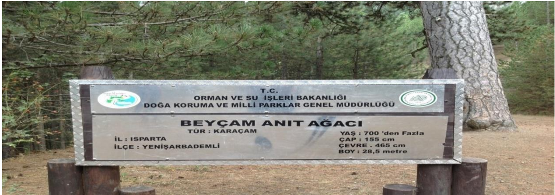
Şekil 4.23: Beyçam anıt ağacı bilgi tabelası [86].