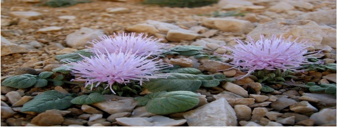
Şekil 4.19: Dedegülü bitkisi [99].

Jurineamoschus olarak da isimlendirilir [82]. Şekil 4.19’de Dedegül Çiçeği ile ilgili görsele yer verilmektedir.