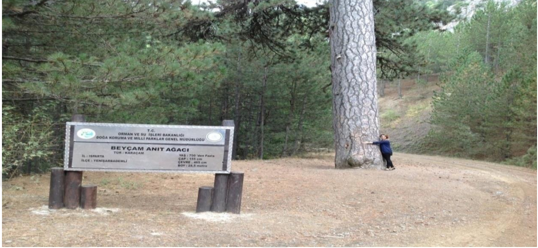
Şekil 4.22: Beyçam Anıt Ağacı [86].

Mağarasından Melikler Yaylası istikametinde giden yolun hemen yanında bulunan Beyçam 700 yaşının üzerinde, 28,5 metre boyunda, 155 cm çapındadır [102]. Şekil 4.22 / Şekil 4.23'te Beyçam Anıt Ağacı ile ilgili resimler gösterilmektedir.