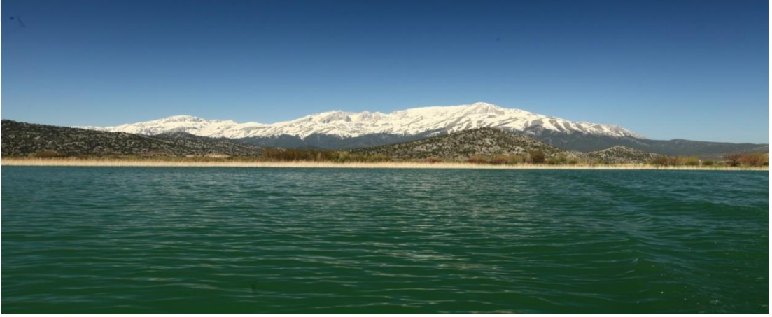
Şekil 4.16: Beyşehir Gölü ve Dedegöl Dağı [87].