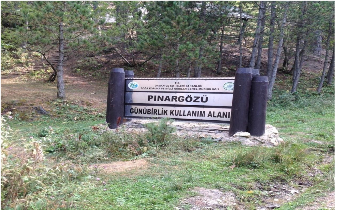
Şekil 4.8: Pınargözü piknik alanı [86].