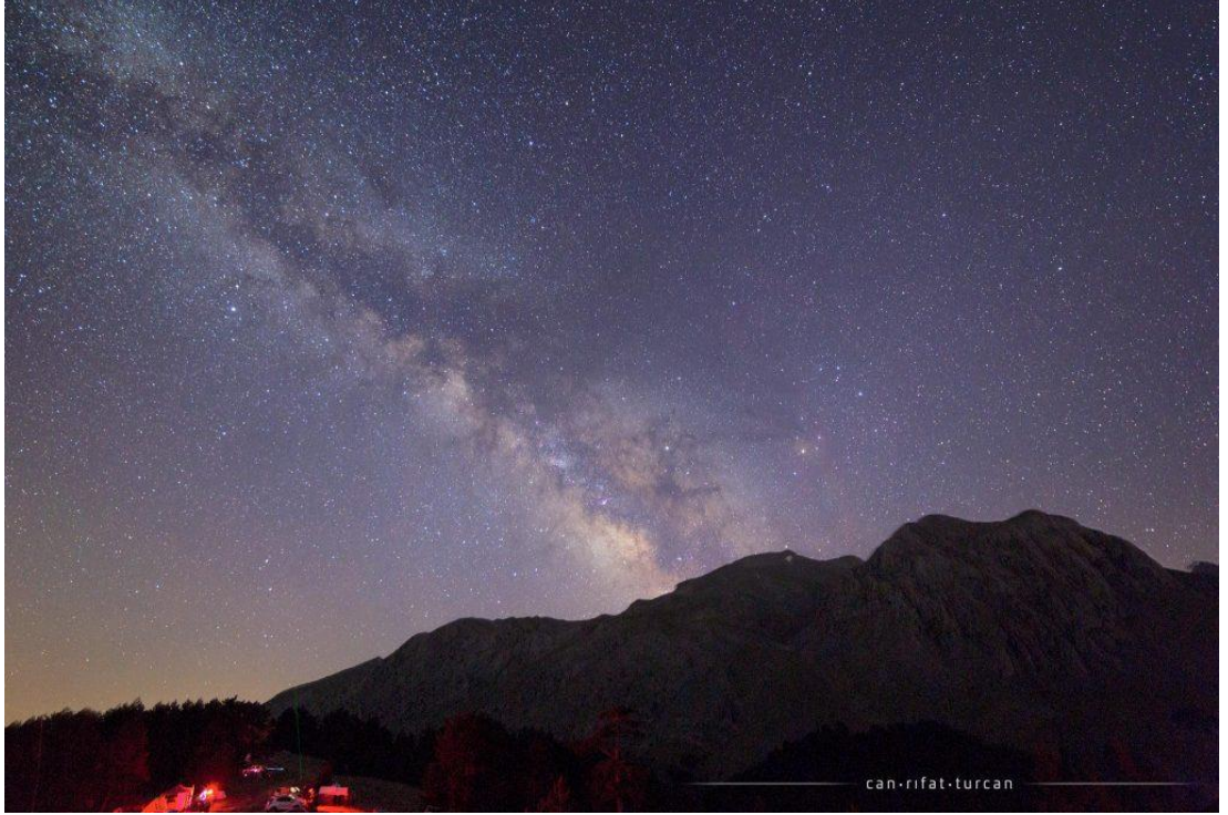
Şekil 4.28: Dedegöl Dağı'nın üzerindeki Samanyolu [104].

Gökyüzü Gözlem Şenliği: Yenişarbademli ilçesi deniz seviyesinden 1180 m yükseklikte bulunmaktadır. Etkinliğin yapıldığı Melikler Yaylası'ndaki "Cennet" adı verilen şenlik alanı ise 1700 m yüksekliktedir. 2017 yılı temmuz ayında düzenlenen şenlikte yapılan karanlık ölçümüne göre Yenişarbademli ölçüm yapılan en karanlık yer olarak bulunmuştur [104]. Şekil 4.28'de Dedegöl Dağı'nın üzerindeki Samanyolu görüntüsü görsel olarak gösterilmektedir.