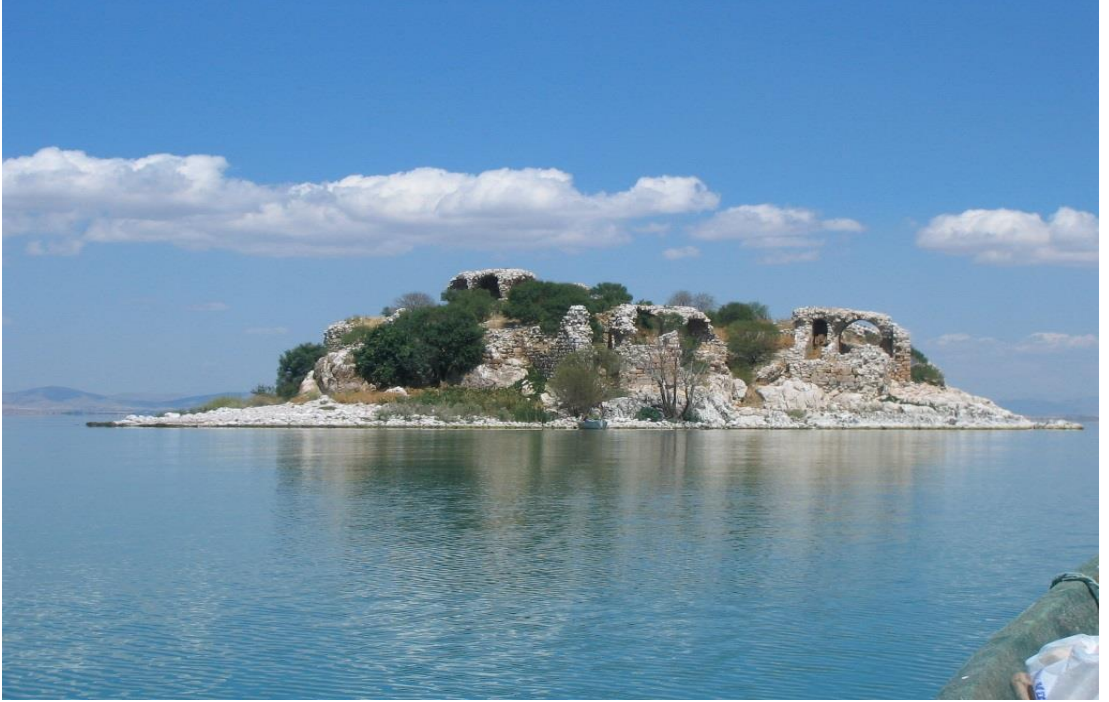
Şekil 4.13: Kız Kalesi Adası [84].

Kız Kalesi Adası, Kubad-1 Abad'ın 4,5 km kuzeydoğusunda, Konya ili Beyşehir İlçesi Gölyaka Kasabası sınırları içerisinde olup çevresi 270 metredir. Alaaddin Keykubad tarafından Kubad-1 Abad'ın haremliğı olarak inşa ettirildiğı sanılır. Arkeolojik araştırması bugüne kadar yapılmadığı için hala gizemini korumaktadır. Kalenin kaya işlemeciliğı Roma kültürünün izlerini taşımaktadır. Kubad-1 Abad'ın haremliğı ve tersaneliğı olan 5 dekarlık bu tarihi ada, 10'un üzerinde kuş türüne ev sahipliğı yapmaktadır. Kız Kalesi Adası, Türkiye'nin Manyas'tan sonra önemli kuş cennetlerinden biri konumundadır. Şimdilerde Beyşehir Gölü kuşlarına ev sahipliğı yapmaktadır. Kız Kalesi ya da diğeri adıyla Kızlar Adası kuş gözlemcileri için adayı bir cennete dönüştürmektedir [82]. Şekil 4.13'de Kız Kalesi Adası'nın görseline yer verilmektedir.