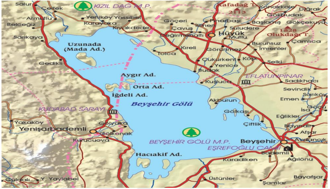
Şekil 4.4: Beyşehir Gölü çevresinde Yenişarbademli'nin yeri [87].