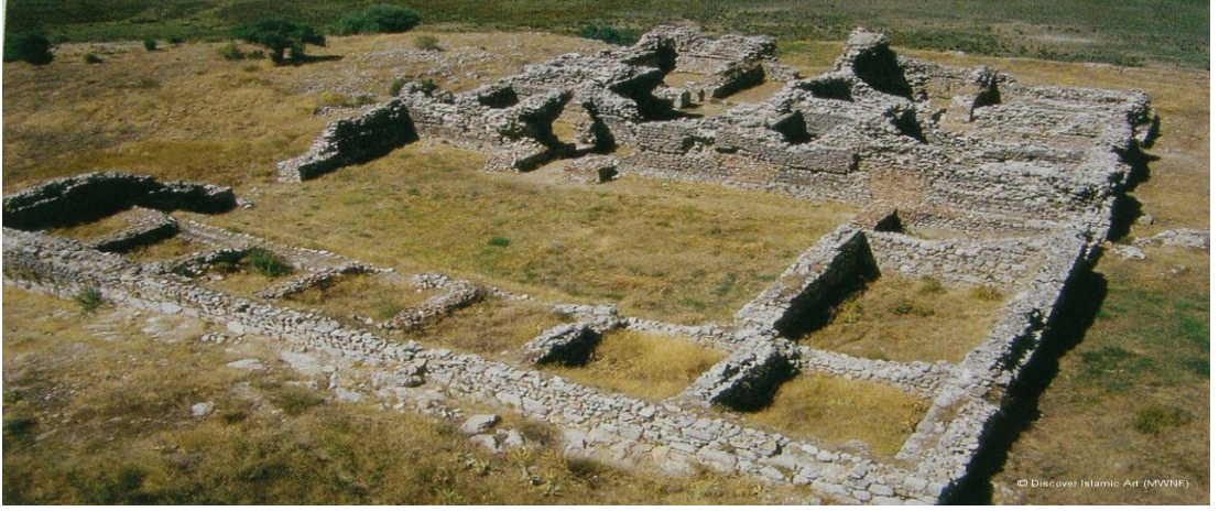
Şekil 4.11: Kubad-ı Abad Sarayı [84].