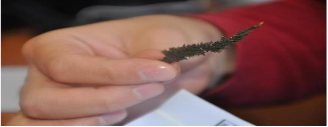
Şekil 4.20: Kara yosunu [100].

İlçede başlıca bulunan Çiğdem, Karahan Çalısı, Kardelen çiçeği, Gurbet çiçeği ve Ak Meşeyi de endemik türler içinde sayabiliriz. İlçede 213 endemik bitki türü bulunmaktadır [94]. Şekil 4.21’de Çiğdem Çiçeği ile ilgili görsel yer almaktadır.