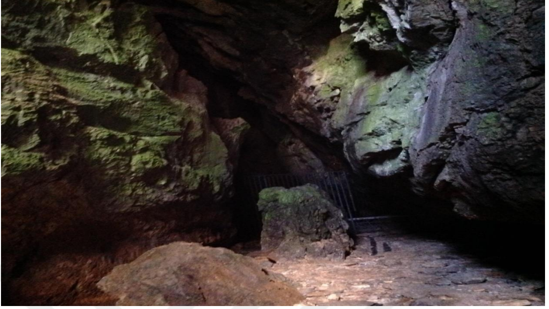
Şekil 4.9: Pınargözü Mağarası'nın içi [86].