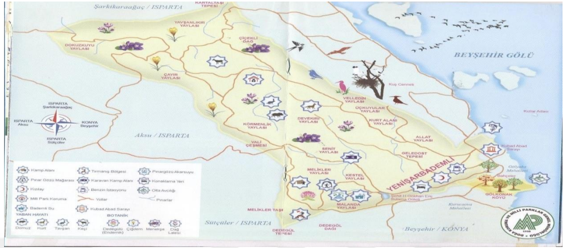
Şekil 4.24: Yaylalar haritası [82].

1996'dan bu yana mayıs ayında dünyanın her yerinden gelen dağcılar Melikler Yaylasında Dedegöl Dağı'nın zirvesine çıkmak için toplanmaktadır. Yaylalarda koyun ve keçi beslenmekte ve arıcılık yapılmaktadır [82].