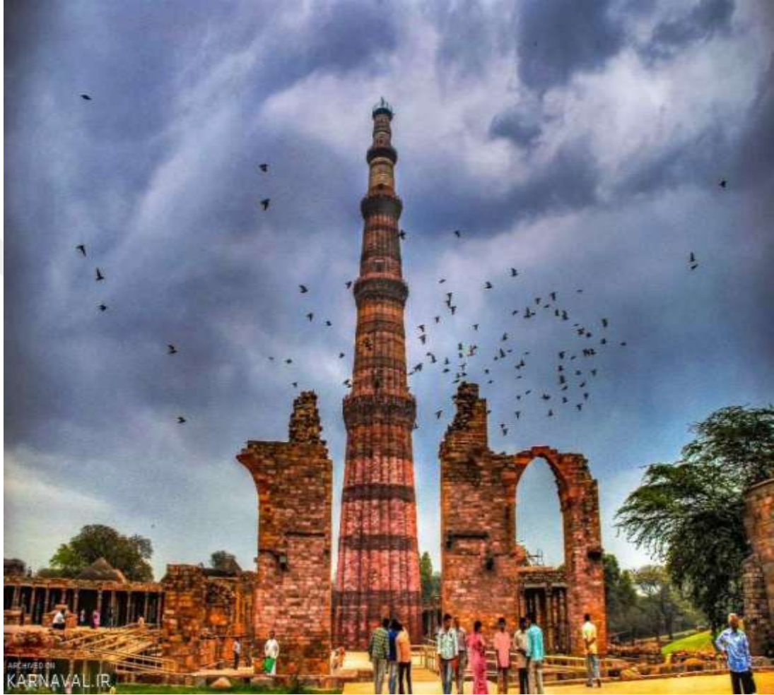
Resim 4. Kutb Minaresi

mermerin yüzünde Sultan Şihabeddin, Kutbeddin Aybek, İskender ve Firuzşah'ın isimleri bulunmaktadır. 1368 yılında Firuzşah tarafından restore edilerek beşinci kat eklenmiştir. 168