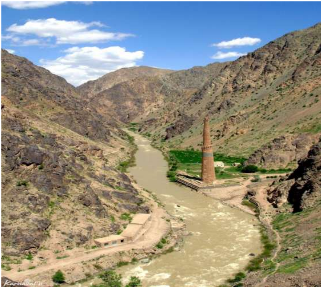
Resim 2. Cam Minaresi

yazılar bulunmaktadır. Minarenin alt ve üst kısmındaki değerli mermer taşlara şekilli yazılar işlenmiştir. Mermerin 3. ve 5. numaralarında 19.cüz, Meryem Sûresi; 976. ayet yazılmaktadır. Düzeni şu şekildedir: “Üçüncü mermerin yüzüne 31. Dördüncüye, 43. Beşinciye, 54. Altıncıya, 77. ve sekizinciye de 92. ayetler yazılmıştır. Ayrıca Sultan Gıyaseddin Muhammed’in ismi de geçmektedir. Resim 1’de Cam Minaresi gösterilmiştir.