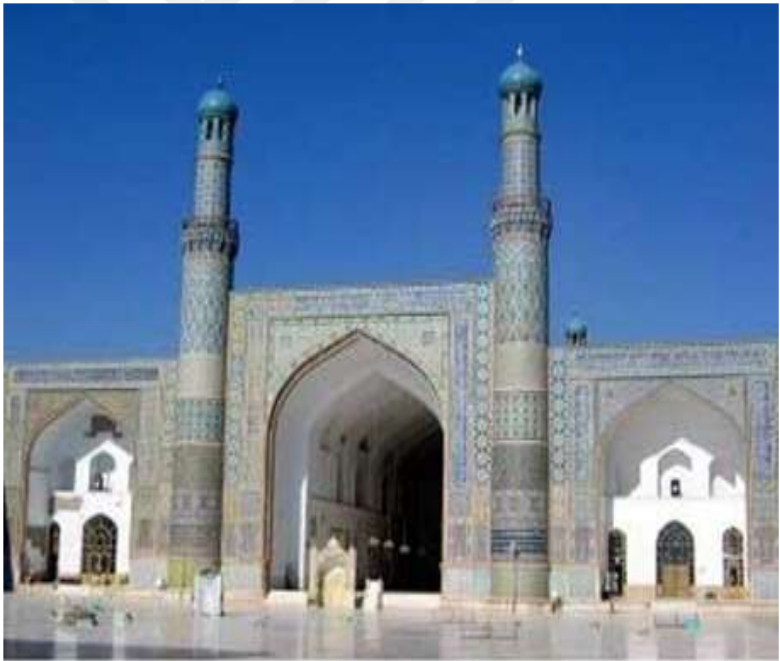
Resim 3. Herat Camisi

Herat Camisi; 254 metre uzunlukta, 150 metre genişlikte inşa edilen büyük bir camidir. Ağaçtan yapılmış olan caminin İslam'dan önce de ibadethane olarak kullanıldığı iddiası vardır. Fakat bugünkü halini, İmam Fahreddin Razi(1149-1209)'nin isteği ile Sultan Gıyaseddin inşa ettirmiştir. 444 orta sütun, 460 kubbe, 4 kapı, 12 tane taş finial sahip olan caminin yan yüksekliği 17 m ve ortası 38 m'dir. Cami dikdörtgen şeklinde olup her tarafı mermerdir. Duvarlarına kiremit, içinde ise renkli mermer kullanılmıştır. Yüzeyine Kur'an-ı Kerim ayetleri yazılmıştır. O zamana ait büyüklerin mezarları bu cami'nin bahçesinde yer almıştır. Sultan Gıyaseddin Muhammed'in mezarının da caminin bahçesi'nin kuzey tarafında yer aldığı bilinmektedir. 166 Resim 2'de Herat Camisi gösterilmiştir.