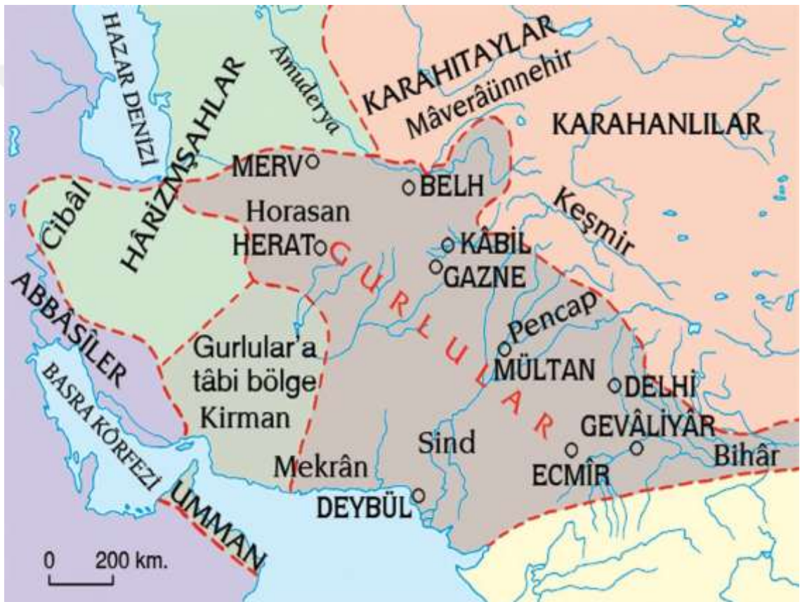
Resim 1. Gur Bölgesi'nin Coğrafi Konumu 18

Yazarı belli olmayan “Hududü'l-Âlem”de Gur bölgesi şöyle tarif edilir: “Gur Bölgesi, Sistan, Maveraünnehir ve Horasan bölgesini içine alan birçok şehir ve köye sahiptir. Bu bölgede askeri açıdan iyi zırh ve silahlar bulunmaktadır. Gur bölgesi, tarihte “Paropamisus” ve Garcistan olarak da geçmektedir.” 17