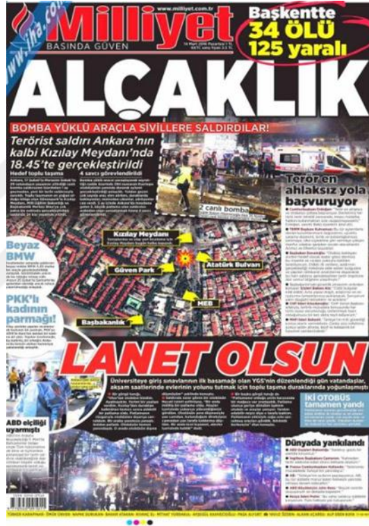
Görsel 4.15. Milliyet Gazetesi Ankara Güvenpark Saldırısına İlişkin İlk Sayfa Haberi (Milliyet, 23 Mart 2016: 1)

saldırganlar hakkında içeriklere sahiptirler: ‘Örgüt PKK, bombacı Seher’ (Milliyet, 15 Mart 2016: 1), ‘İşte bu evde saklandılar’ (Milliyet, 16 Mart 2016), ‘İşte O Araba’ (Milliyet, 17 Mart 2016: 1), ‘İkinci bombacı kafa karıştırdı’ (Milliyet, 19 Mart 2016: 1) başlıklarla çoğu öznel içeriğe sahip kaynağı belli olmayan ve normal fotoğraflarla verilmiştir. 20 Martta sayfa eteğinde ‘Hepsi akraba ve akraba’ (Milliyet, 20 Mart 2016: 1) başlıklı nesnel içerikli ve normal fotoğrafla yapılmış bir haberdir. Milliyet gazetesi üç saldırıya da önemli ölçüde yer vermiştir. Haberlerde öznel ifadeler, neredeyse tamamı normal fotoğraflar kullanılmış, kaynağı belirtilmemiştir.