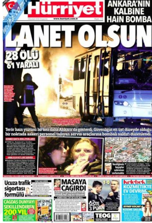
Görsel 4.8. Hürriyet Gazetesi Ankara Genelkurmay Saldırısına İlişkin İlk Sayfa Haberi (Hürriyet, 18 Şubat 2016: 1)

Ankara Genelkurmay saldırısı gazetenin iç sayfalarında da geniş yer bulmuştur. 18 Şubat 2016 de konuyla ilgili iç sayfada haber yapılmamıştır. Saldırıdan iki gün sonra gazete ‘Ankara’da acılı sabah’ (Hürriyet, 19 Şubat 2016: 22) başlığıyla Merasim sokakta saldırının bilançosunu ortaya koyan bilgilere yer vermektedir. Gazete hayatını kaybedenlerin kimliklerini ‘Hayatları romandı’ (Hürriyet, 19 Şubat 2016: 16) başlıklı haberinde açıklamaktadır. Saldırıyı gerçekleştiren bombacının kim olduğu ile ilgili ‘4 kamerada var’ (Hürriyet, 20 Şubat 2016: 18) başlığının devamında detaylı olarak aktarmaktadır. Şehit cenazelerinde ailelerin üzüntüleri de gazetede ‘Oğlumun Düğünü’ (Hürriyet, 21 Şubat 2016: 19) başlıklı haberde verilmeye çalışılmıştır. Saldırganın kimliği netleşirken hakkında edinilen bilgiler ‘Metin A.’nın şifreleri’ (Hürriyet, 22 Şubat 2016: 25) başlıklı haberde yer almaktadır. Saldırıyı gerçekleştiren bombacı için taziye evi açılması ve HDP’li vekillerin taziyeye katılması gazetede ‘İnsanlık ayıbı’ (Hürriyet, 23 Şubat 2016: 18) başlıklı haberde belirtilmektedir. 24 Şubat 2016 tarihinde gazetede saldırı haberi yapılmamıştır.