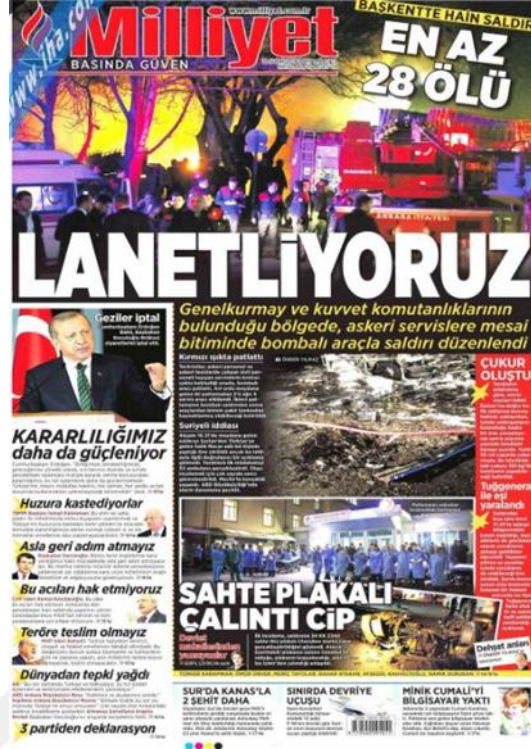
Görsel 4.14. Milliyet Gazetesi Ankara Genelkurmay Saldırısına İlişkin İlk Sayfa Haberi (Milliyet, 18 Şubat 2016: 1)

Gazete ‘Terörle Yok Olan Hayaller’ (Milliyet, 18 Şubat 2016: 15) başlıklı iç sayfa haberinde Kızılay saldırısında hayatını kaybedenlerin kısa hikâyelerine yer vermiştir. Ayrıca ‘Ankara’nın Kalbine Bomba’ (Milliyet, 18 Şubat 2016: 15) başlıklı haberde gazete saldırının geride bıraktığı enkaz, ölü ve yaralı sayıları verilmiştir. Gazetede terör saldırısında hayatını kaybedenler hakkında iç sayfalarda yeni bilgiler ‘5 dakika önce anne servisteyim dedi’ (Milliyet, 19 Şubat 2016: 11) başlıklı haberle yayınlanmıştır. Gazete şehitlerin cenazesinde yaşananları ‘Kocatepe’de yürek dağlayan feryatlar’ (Milliyet, 20 Şubat 2016: 14) başlıklı haberiyle okuyucularına aktarmaktadır. Terörist saldırının arkasında kim veya kimler olduğu sorusunu gazetede ‘Saldırıyı TAK üstlendi’ (Milliyet, 21 Şubat 2016: 16) başlıklı bir haberle açıklığa kavuşturmaya çalışmıştır. Saldırının nasıl gerçekleştiği ile ilgili detaylar ise gazetenin ‘Katliam böyle planlandı’ (Milliyet, 22 Şubat 2016: 11) başlıklı haberinde anlatılmaktadır. Gazetenin 23 – 24 Şubat 2016 baskısında iç sayfalarda ikinci saldırıyla ilgili haber yapılmamıştır.