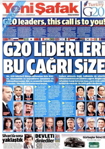
Görsel 4. 27. Yeni Şafak Gazetesinin Paris Saldırısına İlişkin İlk Sayfa Haberi (Yeni Şafak, 14 Kasım 2015: 1)

İkinci saldırı gazetenin 14 Kasım 2015 tarihli baskısında verilmemiştir. ‘Avrupa Panikte’ (Yeni Şafak, 15 Kasım 2015: 1) manşetiyle saldırının ikinci günü ölenlerin sayısı, Fransa’nın aldığı tedbirler, dünyadan saldırıya yönelik tepkileri, liderlerin taziye ve destek mesajları aktarılmaktadır. Gazetenin 16 Kasım 2015 tarihli saldırı haberi yoktur. ‘Türkiye iki kez uyardı’ (Yeni Şafak, 17 Kasım 2015: 1) başlıklı haberde Fransa’nın güvenlik zafiyeti gösterilmektedir. Fransız yetkililer saldırılardan Müslümanları sorumlu tutmakla kalmayıp onlara yönelik ayrımlar yapmaya başlayınca ‘Müslümanlara kırmızı çarpı!’ (Yeni Şafak, 18 Kasım 2015: 1) başlığıyla ilk sayfasına taşımıştır. ‘Paris abluka altında’ (Yeni Şafak, 19 Kasım 2015: 1) haberinde Fransız polisinin ülke çapında gerçekleştirdiği operasyonlara değinmektedir. Pek çok gazete terör saldırısını gerçekleştiren teröristle ilgili aynı başlığı: ‘Katliamın beyni öldürüldü’ (Yeni Şafak, 20 Kasım 2015: 1) olarak kullanmışlardır.