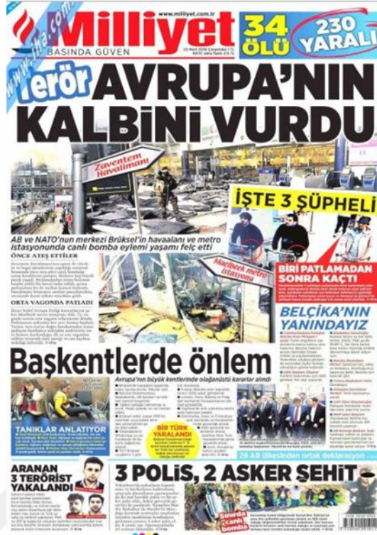
Görsel 4.18. Milliyet Gazetesinin Brüksel Saldırısına İlişkin İlk Sayfa Haberi (Milliyet, 23 Mart 2016: 1)

Milliyet Brüksel saldırısının hemen ardından iç sayfalarda saldırı hakkında bilgiler vermeye başlamıştır. ‘Terör AB’nin Başkentinde’ (Milliyet, 23 Mart 2016: 18) başlıklı haberde gazete saldırılarda 34 kişinin hayatını kaybettiğini, saldırıyı IŞİD’İN üstlendiğini, THY’nin ise saldırıların ardından seferleri iptal ettiği bilgisini vermektedir. Brüksel AB’nin neredeyse tüm kurumlarına ev sahipliği yaptığı için saldırının etkileri de tüm AB’de yankılanmıştır. Bu konuya Milliyet gazetesi ‘Avrupa’da OHAL’ (Milliyet, 24 Mart 2016: 12) başlıklı haberinde alınan önlemlere değinmektedir. Avrupalı yetkililerin saldırının ardından yaptıkları açıklamalar ‘Açık toplum kültürü teröre karşı savunmasız’ (Milliyet, 24 Mart 2016: 12) başlığıyla gazetede yer bulmuştur. Saldırıyı gerçekleştiren terörist belirlendikten sonra Türk yetkililerden gelen açıklamalarda gazetede yer almaktadır. Bu açıklamalardan ilki gazetede ‘Sadece Bakraoi İle Sınırlı Değil Belçika’yı İki Defa Uyardık’ (Milliyet, 25 Mart 2016: 17) başlığı altında detaylandırılmıştır. Gazete ikinci açıklamada terörist şüphesi taşıyan diğer şüphelilerinde kimliklerine ‘Türkiye’nin gönderdiği rotayı FT’de yayınladı’ (Milliyet, 26 Mart 2016) başlıklı haberin devamında yayınlamıştır. Gazete ihmallerin ardından alınan önlemleri ‘Terörizme Karşı 7/24 Sıcak