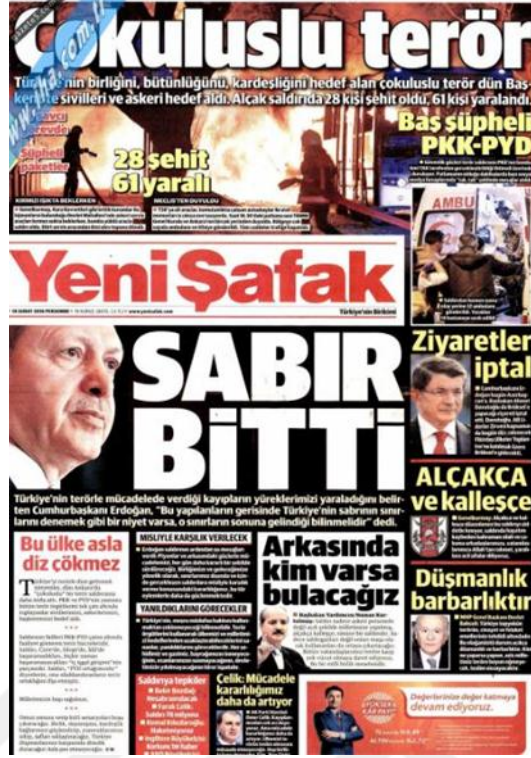
Görsel 4.24. Yeni Şafak Gazetesinin Ankara Genelkurmay Saldırısına İlişkin İlk Sayfa Haberi (Yeni Şafak, 18 Şubat 2016: 1)

Yeni Şafak Ankara Merasim sokakta gerçekleşen saldırıya iç sayfalarda geniş yer vermektedir. 'Başkent'te kalleş saldırı' (Yeni Şafak, 18 Şubat 2016: 14) başlıklı haberde gazete 28 kişinin hayatını kaybettiği, 61 kişinin yaralandığı bilgisi verilmiştir. Gazete saldırıda yaralanan vatandaşların ziyaretlerine giden Başbakan Davutoğlu'nun açıklamalarını 'Bedeli ödetilecek, (Yeni Şafak, 19 Şubat 2016: 13) başlıklı haberinde aktarmaktadır. Saldırının detayları ile ilgili son gelişmeleri gazete 'Profesyonel işi' (Yeni Şafak, 20 Şubat, 2016: 15) başlıklı bir haberle yayınlamıştır. Haberde saldırının gerçekleştiği alanda yapılan çalışmalardan elde edilen sonuçlara yer verilmiştir. Gazete Ankara'nın karşı karşıya kaldığı üçüncü saldırının ardından Başbakan Davutoğlu bazı önlemler alınacağına sinyallerini 'Başkent güvenlik anlayışı geliyor' (Yeni Şafak, 21 Şubat 2016: 16) başlıklı haberde vermektedir. 22 Şubat 2016'da gazetenin iç sayfalarında saldırı haberi yapılmamıştır. Yeni Şafak teröristlerin kimler tarafından desteklendiği konusunda 'Terörü gizleme telaşı' (Yeni Şafak, 23 Şubat 2016: 10) başlığıyla yaptığı haberde ABD'nin teröristlere yardım ettiğini gösteren fotoğraflar paylaşmaktadır. Teröristlerin cenazelerinde sıkça göze çarpan HDP'li vekiller Yeni Şafağa da konu olmuş