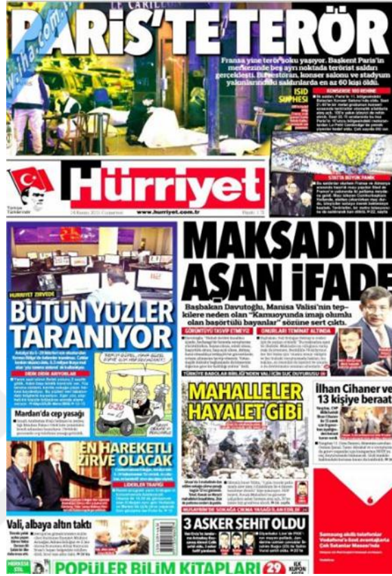
Görsel 4.11. Hürriyet Gazetesi Paris Saldırılarına İlişkin İlk Sayfa Haberi (Hürriyet, 14 Kasım 2015: 1)

Saldırganlarla ilgili pek çok soru olmasına rağmen ‘Elebaşı Öldürüldü’ (Hürriyet, 20 Kasım 2015: 1) haberinde saldırının yakalanıp öldürüldüğü bilgisi verilmektedir.