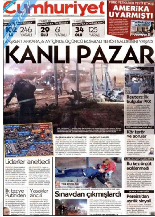
Görsel 4. 20. Cumhuriyet Gazetesinin Ankara Genelkurmay Saldırısına İlişkin İlk Sayfa Haberi (Cumhuriyet, 18 Şubat 2016: 1)

İkinci saldırı iç sayfalarda ilk olarak 'Araç Gezmiş Devlet İzlemiş' (Cumhuriyet, 18 Şubat 2016: 11) başlığıyla bombalı aracın ülkede sahte plakayla nasıl yakalanmadan dolaştığını konu edinmektedir. Saldırının yetkililer tarafından sorumluluğunun üstlenilmediği '181 Ölüm, İstifa Yok' (Cumhuriyet, 19 Şubat, 2016: 11) başlıklı haberde eleştirilmektedir. 'Bu Acının Tarifi Yok' (Cumhuriyet, 20 Şubat 2016: 10) başlığının altında hayatını kaybedenlerin cenaze törenlerinde yaşanan üzüntü dile getirilmiş, saldırıyla ilgisi olduğu şüphesiyle 20 kişinin tutuklandığı bilgisi verilmektedir. 'Bombacı Bilmecesi' (Cumhuriyet, 21 Şubat 2016: 13) saldırıyı kimin gerçekleştirdiği konusunda net bir bilgi olmadığını, illerde OHAL ilan edileceğini de açıklayan bir haberdir. 'Bombacı benim oğlum' (Cumhuriyet, 22 Şubat 2016: 10) başlıklı haberde bombacıya taziyeye evi açılması ve HDP'li milletvekillerinin katılması büyük tepki çekmiştir. 23 Şubat 2016'da saldırı haberi yapılamamıştır. Ayrıca bombacının kim olduğu kesinleşmesine rağmen bombacı bilmecesi çözülmemiş ve konuyla ilgili 'Bombacı bulundu, örgüt bilmece' (Cumhuriyet, 24 Şubat 2016: 5) başlığıyla bir haber yapılmıştır.