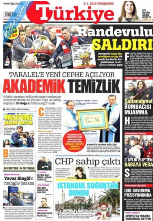
Görsel 4.4. Türkiye Gazetesi Charlie Hebdo Saldırısına İlişkin İlk Sayfa Haberi (Türkiye, 8 Ocak 2015: 1)

temsilcisinin olmayışı tepki toplayınca Amerika'nın özür dilemek amacıyla ünlü Empire State binasının ışıklandırmasında Fransız bayrağının renkleri kullanmış olduğu bilgisi verilmektedir. 'Ce n'est pas ça la liberte Charlie' (Türkiye, 14 Ocak 2015: 1) şeklinde Fransızca başlıklı bu haberde mizah dergisinin saldırıdan sonrada Müslümanlara karşı hakaret içeren karikatürler yayınlamaya devam etmekte oluşunu eleştirmektedir. Bu haberlerde dikkat çeken nokta ise dünyanın her yerinde terör saldırısı ile karşılaşılabilceğinin sinyallerini vermektedir.