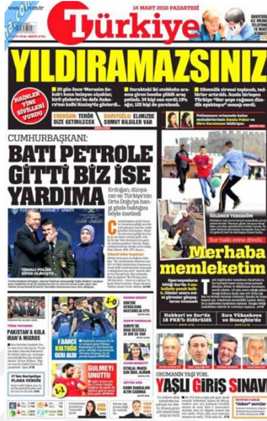
Görsel 4.3. Türkiye Gazetesi Ankara Güvenpark Saldırısına İlişkin İlk Sayfa Haberi (Türkiye, 15 Mart 2016: 1)

Araştırmaya Türkiye’den konu edinilen üçüncü ve son saldırı gazetesinin önemli gördüğünü iç sayfalarına taşıyarak da göstermektedir. ‘Yılmayacağız’ (Türkiye, 14 Mart 2016: 9) başlıklı haber Türk halkının saldırılar karşısında teröre karşı duruşunun değişmeyeceğini terörle kararlılıkla mücadele edilmeye devam edileceğini gösteren bir haber yapılmıştır. Güvenpark saldırısının hemen ardından Başbakan tarafından toplanan güvenlik zirvesinin yanı sıra Cumhurbaşkanının açıklamaları da haberde aktarılmıştır. ‘İşte O Canlı Bomba’ başlıklı haberin içeriğinde (Türkiye, 15 Mart 2016: 10) teröristin kimliği, fotoğrafı ve hakkında toplanan bilgiler detaylı bir şekilde verilmiştir. ‘Acılı Aneden Teröristlere Tokat Gibi Sözler: Allahım canilerin hepsini sen yok et’ (Türkiye, 16 Mart 2016: 13) şeklindeki ifadelerde şehit cenazeleri sırasında şehit yakınlarının acılı ifadelerinden birinin başlıklarda yer bulmuş hali olan bu haber hayatını kaybedenlerin hayatını anlatan küçük bilgilerde içermektedir. ‘Şehitlerimize karşı mahcup olmayacağız’ (Türkiye, 17 Mart 2016: 13) Cumhurbaşkanının açıklamalarının bir sayfalık haberinin başlığıdır. Haberin devamında teröristlere mecliste de yer verilmeyeceğini, sonuna kadar