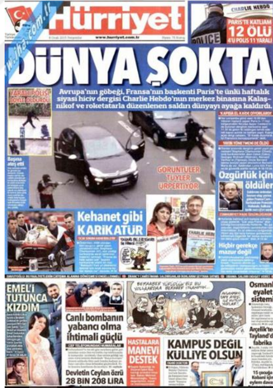
Görsel 4.10. Hürriyet Gazetesinin Charlie Hebdo Saldırısına İlişkin İlk Sayfa Haberi (Hürriyet, 8 Ocak 2015: 1)

saldırlardan nasıl olumsuz etkilendiğini de göstermektedir. ‘Her Yer Paris’ (Hürriyet, 11 Ocak 2015) başlıklı haberde saldırıya tepkilerini göstermek amacıyla dünya liderlerinin katılacağı yürüyüşün detaylarını aktarmaktadır. ‘İnsanlık Yürüdü’ (Hürriyet, 12 Ocak 2015: 1) başlıklı haberde Paris’te gerçekleştirilen terörü kınama yürüyüşüyle ilgili tam sayfa boyunca detayları aktarmaktadır. Yürüyüşe tüm dünyadan liderler katılmıştır. ‘Hayat Meselesi’ (Hürriyet, 13 Ocak 2015: 1) ifadeleriyle Hebdo saldırısının arkasından meydana gelen market saldırısının bombacısının sevgilisinin Türkiye’de olduğu bilgisinin paylaşıldığı bu haberde bombacının ve sevgilisinin ellerinde AB pasaportu bulunduğu Türk yetkililer bu nedenle ülkeye girişlerinde önlem alınmadığını belirtmektedirler. ‘Hollende’ den saygı duruşu’ (Hürriyet, 14 Ocak 2015: 1) sayfa eteğinde verilen bu haberde Fransız Cumhurbaşkanı’nın saldırıda ölenlerin cenaze töreninde onların Fransız halkının özgür yaşaması için hayatlarını kaybettiklerini ifade etmiştir.