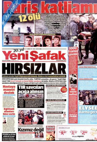
Görsel 4. 26. Yeni Şafak Gazetesinin Charlie Hebdo Saldırısına İlişkin İlk Sayfa Haberi (Yeni Şafak, 8 Ocak 2015: 1)