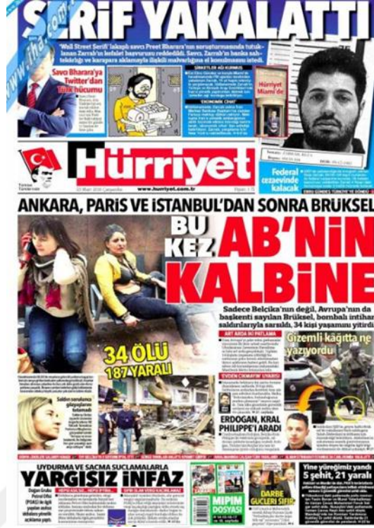
Görsel 4.12. Hürriyet Gazetesi Brüksel Saldırısına İlişkin İlk Sayfa Haberi (Hürriyet, 23 Mart 2016: 1)

Üçüncü saldırının iç sayfalarda Türkiye’de yakın zamanlı gerçekleşen terör eylemleri nedeniyle daha seyrek yer bulduğunu görülmüştür. İlk sayfada verilen başlığın iç sayfalarda da aynı şekilde verilmesinin yanında saldırılarla ilgili daha çok detay ‘Avrupa’nın kalbine saldırı’ (Hürriyet, 23 Mart 2016: 27) başlıklı haberde verilmektedir. Haberde bütün dünyanın kınama mesajları ve saldırının nasıl gerçekleştirildiği detaylandırılmıştır. İstihbarat sorunu Brüksel saldırısında da gündemde önemli yer tutmuştur. Gazete bu duruma ‘Türkiye, o bombacıyı Sınır Dışı Etmiş’ (Hürriyet, 24 Mart 2015: 31) başlıklı haberinde değinmektedir. Saldırının önlenmesi için gerekli tedbirlerin alınmamış olduğu bilgisi üzerine gazete ‘Belçika’da İhmal Krizi’ (Hürriyet, 25 Mart 2016: 23) başlıklı haberi yayınlamıştır. 26 Mart 2016’da gazetenin iç sayfasında saldırı haberi yapılmamıştır. Gazete Belçika’nın ihmallere karşı tutumunu ‘Belçika tek suçluyu buldu’ (Hürriyet, 27 Mart 2016: 22) başlıklı haberle aktarmaktadır. Gazetenin 28 – 29 Mart 2016 tarihli sayılarında iç sayfalarda saldırı haberi bulunmamaktadır.