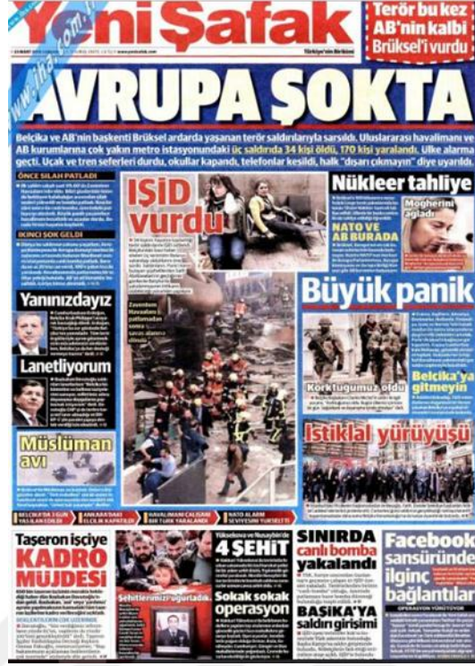
Görsel 4. 28. Yeni Şafak Gazetesinin Brüksel Saldırısına İlişkin İlk Sayfa Haberi (Yeni Şafak, 23 Mart 2016: 1)

Brüksel saldırısı gazetenin iç sayfalarında da nasıl yer aldığı incelenmiştir. Gazetede saldırının hemen ardından Cumhurbaşkanı Erdoğan'ın açıklamaları 'Belçika'nın yanındayız' (Yeni Şafak, 23 Mart 2016: 13) başlığıyla verilmiştir. Cumhurbaşkanı Erdoğan Belçika'da ki saldırı konusunda çarpıcı açıklamalarda da bulunmuştur. Bunlardan biri gazetede 'Belçika umursamadı' (Yeni Şafak, 24 Mart 2016: 15) başlıklı haberde Türkiye'nin teröristi Belçika'ya bildirmesine rağmen önlem alınmadığı ifade edilmiştir. Cumhurbaşkanının bu açıklamalarının Belçika'yı nasıl etkilediğini Yeni Şafak 'Erdoğan'ın Sözleri Avrupa'yı Salladı İstifa depremi' (Yeni Şafak, 25 Mart 2016: 14) başlıklı haberinde istifa eden adalet ve işleri bakanlarının bilgisi ile yer vermektedir. Teröristlerin Belçika'ya kadar nasıl geldikleri konusunu açıklığa kavuşturmak amacıyla gazete 'Avrupa baskına başladı' (Yeni Şafak, 26 Mart 2016: 13) başlıklı bir haber yayınlamıştır. Bu haberde teröristlerin mülteci olarak Avrupa'ya geldikleri bilgisi dikkat çekmektedir. Konu ile ilgili olarak tüm Avrupa'da terörist şüphesi taşıyanlara yönelik operasyonlara başlandığı bilgisi de haberde verilmektedir.