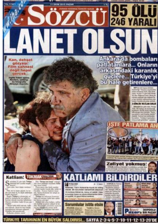
Görsel 4. 29. Sözcü Gazetesinin Ankara Gar Saldırısına İlişkin İlk Sayfa Haberi (Sözcü, 11 Ekim 2015: 1)

Ankara’da gerçekleşen ilk saldırının iç sayfalarda da yoğun bir şekilde işlendiği görülmüştür. ‘Son Yılların En Kanlı Katliamı’ (Sözcü, 11 Ekim 2015: 13) haberin başlığında belirtildiği gibi çok fazla insanın hayatını kaybettiği (95 ölü) barış mitinginin nasıl can pazarına dönüştüğünü açıklamaktadır. Saldırının ardından yapılan güvenlik kontrolünün eleştirisi de haberde yer bulmuştur. 11 Ekim’de iç sayfalarda dört sayfa boyunca katliamın ayrıntıları başlıklara taşınmıştır. Mitingde ölenlerin cenazeleri sırasında yaşananlar ve şehit yakınlarının görüşleri 12 Ekim 2015 Sözcü, (12 Ekim 2015: 10) basımında ayrıntılı bir şekilde gazetede verilmiştir. 13 Ekim 2015’ de barış mitinglerine katılanlar hakkında bazı bilgiler verilmiştir (Sözcü, 13 Ekim 2015: 4). Patlama anını görüntüleyen üniversiteli gencin açıklamaları da yer almıştır. ‘Olay yerinde rezalet’ (Sözcü, 14 Ekim 2015: 11) başlıklı haberde hayatını kaybeden vatandaşların anılması için toplanan bir gruba polisin gazlı müdahalesi eleştirilmektedir. Gazete saldırının beraberinde sosyal medyanın yavaşladığını da iddia etmektedir. ‘Erdoğan 4 gün sonra olay yerinde’ (Sözcü, 15 Ekim 2015: 10) gazetesinin haberinde Cumhurbaşkanı’nın saldırının gerçekleştiği meydana günler sonra gelmesi eleştiri konusu olmuştur. 16 ve 17 Ekim 2015 tarihli yayınlarında gazetede saldırı haberleri iç sayfalara taşınmamıştır.