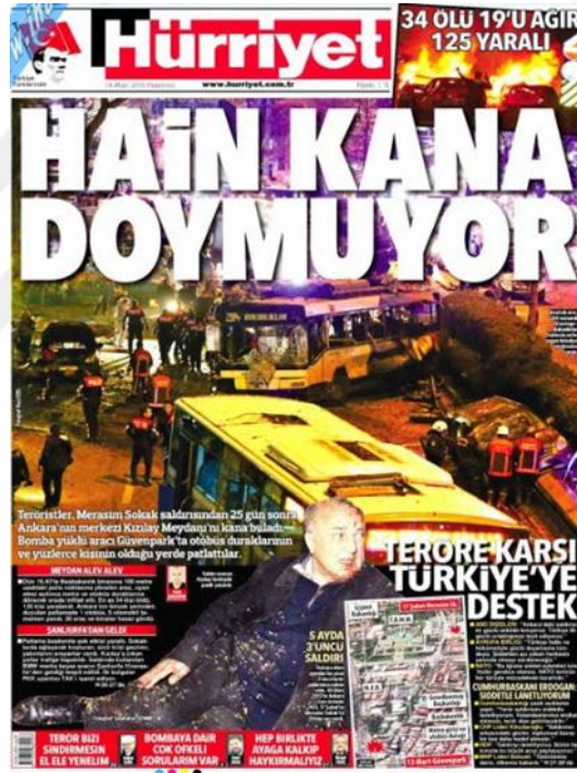
Görsel 4.9. Hürriyet Gazetesi Ankara Güvenpark Saldırısına İlişkin İlk Sayfa Haberi (Hürriyet, 14 Mart 2016: 1)

Ankara Güvenpark saldırısı (üçüncü) ise Hürriyette 5 gün boyunca haber olarak yayınlanmıştır. Haberler 5 gün boyunca da manşette yer almıştır. Olayın hemen ardından 14 Martta gazetenin yaptığı haber kanlı bir fotoğraf eşliğinde verilmiştir. ‘Hain kana doymuyor’ (Hürriyet, 14 Mart 2016: 1), ‘Yazıklar olsun’ (Hürriyet, 17 Mart 2016: 1) şeklinde yoruma dayalı başlıklarla haber yapılmıştır. ‘3 yıldır aranıyor’ (Hürriyet, 15 Mart 2016), ‘Üçüncü el şüphesi’ (Hürriyet, 16 Mart 2016: 1), ‘Bomba valizi otobüsle geldi’ (Hürriyet, 18 Mart 2016: 1) başlıklarının altında ise saldırgan ya da saldırganların saldırıyı nasıl gerçekleştirdiği ile ilgili elde edilen bilgiler ve şüpheler konusunda haberlere yer verilmiştir. 19 – 20 Mart 2016’da gazetenin ilk sayfasında saldırı haberi verilmemiştir.