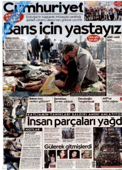
Görsel 4. 19. Cumhuriyet Gazetesi Ankara Gar Saldırısına İlişkin İlk Sayfa Haberi (Cumhuriyet, 11 Ekim 2015: 1)

Cumhuriyet gazetesi Ankara'da 10 Ekim 2015'de gerçekleşen Gar (birinci) saldırısını manşetten 'Barış için Yastayız' (Cumhuriyet, 11 Ekim 2015: 1) başlığı ile yer vermiştir. Haberin devamında kanlı bir fotoğraf kullanılmıştır. Haber, öznel bir üslup ve yoruma dayalı bir başlıkla yazılmıştır. Cumhuriyet gazetesi suçlayıcı bir üslupla saldırıları ele almıştır. 'Bomba patladı, polisler izledi' (Cumhuriyet, 12 Ekim 2015: 1), 'Onlara bir barış sözümüz var' (Cumhuriyet, 13 Ekim 2015: 1), 'Erdoğan: Her olayda istifa mı olur?' (Cumhuriyet, 14 Ekim 2015: 1), 'Besle kargayı' (Cumhuriyet, 15 Ekim 2016: 1), 'Polis her şeyi biliyordu' (Cumhuriyet, 17 Ekim 2015: 1) haberlerinin tamamını bu suçlamalar üzerine öznel bir ifade kullanarak, normal fotoğraflarla, kaynak belirtilmeden yapılmıştır. Saldırı ile ilgili tek bilgi 'Katliam planı Kilis'te yapıldı' (Cumhuriyet, 16 Ekim 2015: 1) başlıklı yine öznel ifadeler ve normal bir fotoğrafla, kaynak belirtilmeden yer verilmiştir. Cumhuriyet saldırılardan güvenlik güçlerini 'polis uyuyor' haberinde olduğu gibi halka korumasız olduğunu belirtmektedir.