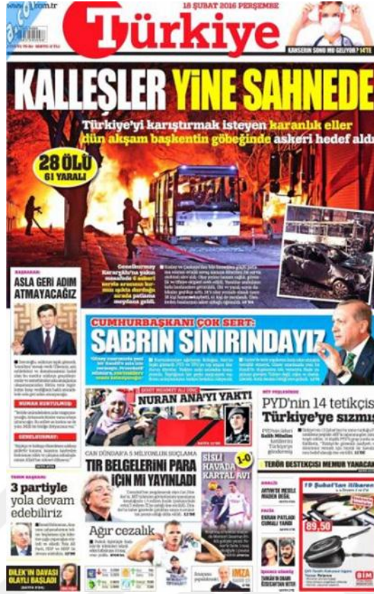
Görsel 4.2. Türkiye Gazetesi Ankara Genelkurmay Saldırısına İlişkin İlk Sayfa Haberi (Türkiye, 18 Şubat 2016: 1)

Türkiye gazetesi iç sayfalarında bu olaya ‘Erdoğan Sert Konuştu: Sabrımızın Sınırını Zorlamayın’ (Türkiye, 18 Şubat 2016: 10) başlığıyla Cumhurbaşkanının Ankara saldırısının ardından terör örgütlerine karşı kararlılıkla mücadele edileceğini net bir şekilde ifade ederken, Başbakan Davutoğlu’nun konuyla ilgili açıklamalarına da yer vermiştir. ‘Kanlı saldırıya eskortla girmiş’ (Türkiye, 19 Şubat 2016: 11) başlıklı haberde bombacının kimliği belli olduktan sonra saldırının nasıl planlandığı ve bombacının saldırıyı nasıl gerçekleştirdiği konusunda bilgi haberle aktarılmıştır. ‘Türkiye Şehitlerini Uğurluyor: Merasim Acısı’ (Türkiye, 20 Şubat 2016: 12) şeklindeki başlıktan da anlaşıldığı üzere şehitlerin cenaze törenleri sırasında yapılan açıklamaları ve şehit ailelerinin acıları dile getirilmiştir. ‘Erdoğan: Tepkiler Umurumuzda Değil: Kendimizi Müdafaa Etmek Hakkımız’ (Türkiye, 21 Şubat 2016: 13) şeklindeki ifadelerde saldırının ardından alınan tedbirler üzerine alınan tepkiler Cumhurbaşkanının alınan tedbirlerin gerekli olduğunu gerekirse daha sert tedbirlerde alınabileceği bilgisi verilmektedir. ‘Organize hainler’ (Türkiye, 22 Şubat 2016: 12) haberde saldırının birden fazla kişi