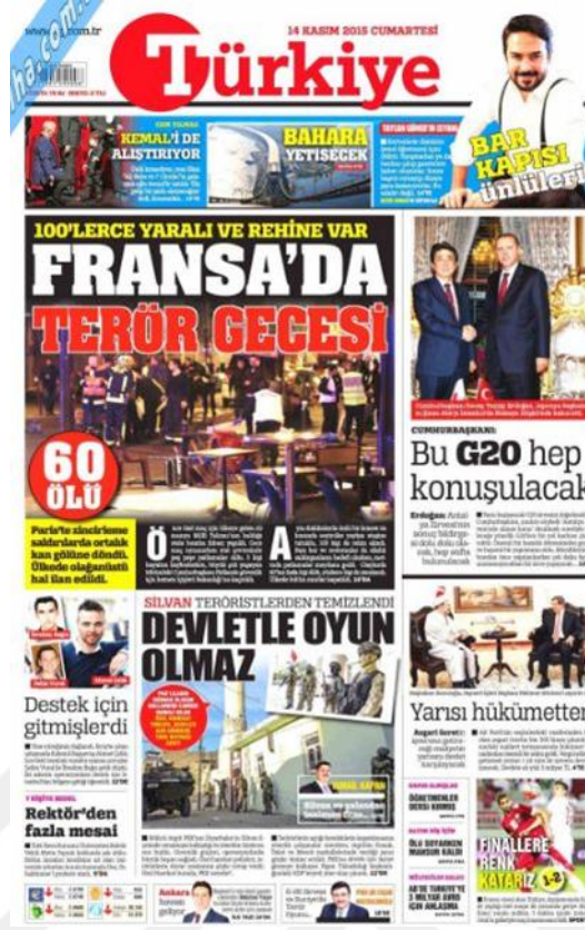
Görsel 4.5. Türkiye Gazetesi Paris Saldırılarına İlişkin İlk Sayfa Haberi (Türkiye, 11 Ekim 2015: 1)

Gazetenin iç sayfalarında da saldırı haberi verilmeye devam etmiştir. ‘Paris’te terör zinciri’ (Türkiye, 14 Kasım 2015: 13) başlığında gazete haberde olayı Avrupa’nın 11 Eylül’ü olarak tanımlamıştır. Olayla ilgili elde edilen sayısal veriler paylaşılmıştır. ‘Neden Paris’ (Türkiye, 15 Kasım 2015: 10) başlığı ilk sayfada da yer bulmuştur. Neden Paris sorusunun cevaplarını gazete iç sayfa haberinde vermeye çalışmıştır. Saldırının nedeninin son zamanlarda milliyetçilik adı altında Müslümanlara yönelik ayrımcılığın ve şiddetin artmış olması ve Suriye’de çok fazla Fransız vatandaşı olmasına bağlanmaktadır. ‘Fransa, 51 bombacı teröristin peşinde!.. (Türkiye, 16 Kasım 2015: 13) şeklindeki başlıkta belirtildiği gibi olası saldırıların istihbaratı hakkında bilgilere yer verilmiştir. ‘Avrupa diken üstünde’ (Türkiye, 17 Kasım 2015: 13) şeklindeki haberde saldırının üzerine çok büyük önlemler alınmış ve bunlar hakkında açıklamalara değinilmiştir. 18 Kasım’da iç sayfalarda saldırıya yer verilmemiştir. ‘Avrupa’da Herkes Şüpheli Abarttılar!’ (Türkiye, 19 Kasım 2015: 10) ifadelerinde daha önce ilk sayfada kullanılan başlığın tam sayfa haberi detaylı bir şekilde aktarılmıştır. 20 Kasım 2015’de saldırı haberi