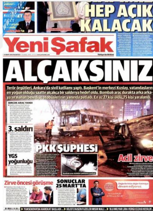
Görsel 4. 25. Yeni Şafak Gazetesinin Ankara Güvenpark Saldırısına İlişkin İlk Sayfa Haberi (Yeni Şafak, 14 Mart 2016: 1)

Ankara’da gerçekleşen üçüncü saldırı ‘Alçaksınız’ (Yeni Şafak, 14 Mart 2016: 1) başlığı ile manşetten normal bir fotoğraf kullanılarak, öznel bir ifade ile kaynak kullanılmadan verilmiştir. Aynı şekilde ‘Canlarımız’ (Yeni Şafak, 15 Mart 2016: 1) başlıklı haberde terör saldırılarına karşı duyulan üzüntüyü yansıtmaktadır. ‘Onlar Diz Çökecek’ (Yeni Şafak, 16 Mart 2016: 1) terörle mücadelede gösterilen kararlılığı göstermektedir. ‘Bombada Kobani’den’ (Yeni Şafak, 18 Mart 2016: 1) başlıklı haber saldırının faillerine işaret etmektedir. 17-19 ve 20 Mart 2016’da haber yapılmamıştır. Yeni Şafak gazetesi terör saldırılarına yönelik duygusal tavrını korumuş, haberlerinde neredeyse tamamı öznel bir üslupla, kaynak belirtilmeden, normal fotoğraflar eşliğinde ve yoruma dayalı başlıklar kullanmıştır.