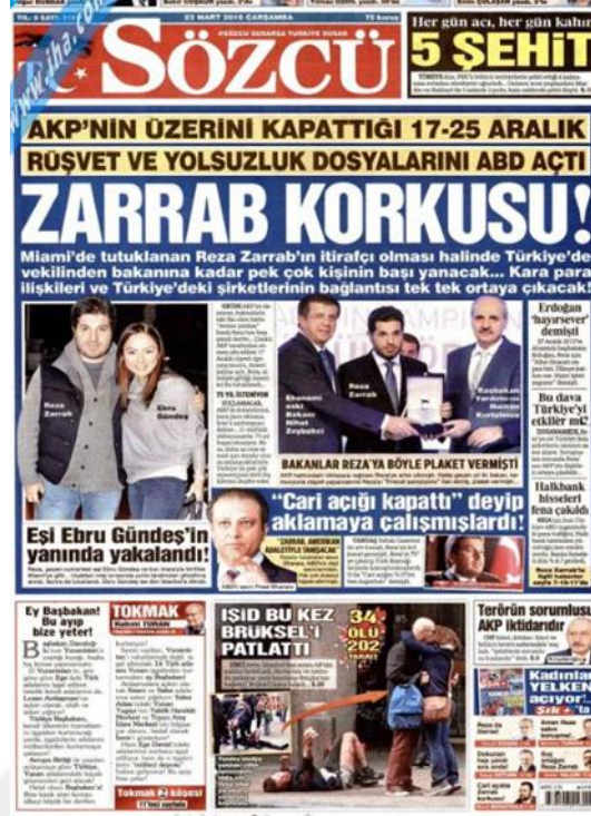
Görsel 4. 32. Sözcü Gazetesi Brüksel Saldırına İlişkin İlk Sayfa Haberi (Sözcü, 23 Mart 2016: 1)

Üçüncü saldırının iç sayfalarda da çok fazla yer almaması Türkiye gündeminin daha önemli gördüğü konularla değişmiş olmasıdır. 'İŞİD Terörü' (Sözcü, 23 Mart 2016: 20) başlığıyla iki sayfalık bir haber yapmıştır. Saldırının sonrasında yaralıların ve hayatını kaybedenlerin kanlı fotoğrafları da tam sayfa gösterilmiştir. Saldırı hakkında edinilen ilk bilgilere göre saldırganın bir resmi ve dinci bir terörist olduğu haberde yer almıştır. Belçika hükümetinin Türk mahallerinde yaptığı baskınları ve yakalanan şüphelileri de kapsayan bir haber yapmıştır. 'Brüksel'i kana bulayan teröristler kardeş çıktı' (Sözcü, 24 Mart 2016: 11) haberinin devamında Cumhurbaşkanı Erdoğan'ın saldırganı sınır dışı edip saldırı hakkında Belçika'yı uyardıklarını belirtmektedir. Son olarak 'Saldırıda ihmalleri ortaya çıkan iki bakan istifa etti' (Sözcü, 25 Mart 2016: 24) haberinde içişleri bakanı ve adalet bakanının konuyla ilgili sorumluluklarını yerine getiremediklerinden dolayı istifaları hakkında bilgi verilmektedir.