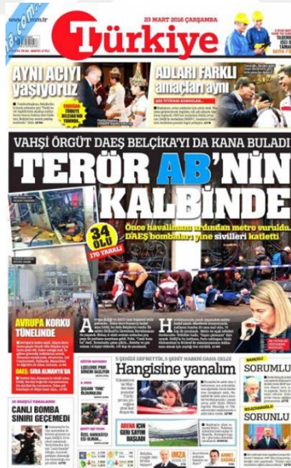
Görsel 4.6. Türkiye Gazetesi Brüksel Saldırısına İlişkin İlk Sayfası Haberi (Türkiye, 23 Mart 2016: 1)

Avrupa’da gerçekleşen saldırılardan araştırmaya konu edilen üçüncü ve son saldırı Belçika’nın başkenti Brüksel’de meydana gelmiştir. 22 Mart 2016’da Brüksel Havaalanında ve metroda gerçekleşen saldırı incelenmiştir. Gazete ‘Terör AB’nin Kalbinde’ (Türkiye, 23 Mart 2016: 1) manşetiyle Brüksel saldırısını ve yarattığı korkuyu gündemine taşımıştır. ‘Çok Güzel Hareketler’ (Türkiye, 24 Mart 2016: 1) manşetinin altında Belçika halkının terör eylemlerine karşı tek yürek oluşunu ve hayatını kaybedenlere son görevlerini yerine getirmek amacıyla toplandıklarını göstermektedir. ‘Avrupa, DAESH İçin Kendini Sorguluyor Ankara Haklı’ (Türkiye, 25 Mart 2016: 1) başlıklı haberde Ankara’nın saldırganlar konusunda Belçika’yı uyarmasına rağmen önlem almaması konusunda yapılan eleştirileri aktarmaktadır. 26 ve 27 Mart 2016 tarihli yayınlarında gazete saldırı haberi vermemiştir. ‘Brüksel Yürüyüşü Güvenliğe Takıldı’ (Türkiye, 28 Mart 2016: 1) şeklinde sayfa eteğinde verilen haberde teröre karşı yapılması planlanan yürüyüşün yeni bir terör saldırısı korkusuyla iptal edildiğini bildirmektedir. 29 Mart 2016’ da saldırı haberi yapılmamıştır.