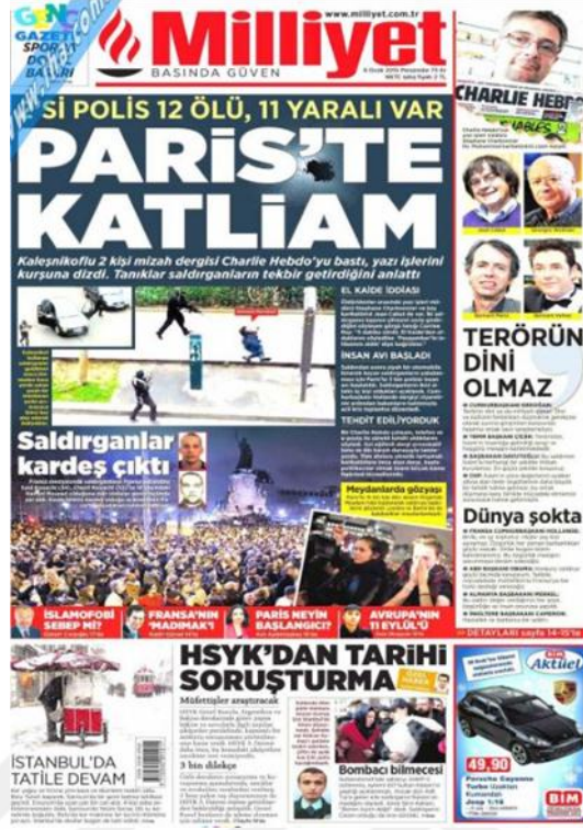
Görsel 4.16. Milliyet Gazetesi Charlie Hebdo Saldırısına İlişkin İlk Sayfa Haberi (Milliyet, 8 Ocak 2015: 1)

Charlie Hebdo saldırısının iç sayfa haberlerinin ilki ‘Yazı işleri masasına kanlı baskın: 12 ölü’ (Milliyet, 8 Ocak 2015: 14) başlıklı, saldırı anının tanıklar tarafından anlatımlarını içeren bir haberdir. Gazete Fransız yetkililer tarafından kimlikleri hemen belirlenen teröristler hakkında ‘Taşrada Kovalamaca’ (Milliyet, 9 Ocak 2015: 14) başlıklı haberde bazı bilgiler vermektedir. Milliyet, saldırganların kimliğini tespit ettikten hemen sonra Fransız polisinin saldırganları yakalayıp, öldürdüğü haberini ‘Kanlı Başladı, Kanlı Bitti’ (Milliyet, 10 Ocak 2015: 14) başlıklı haberinde vermiştir. Saldırıya tepki yürüyüşünün ön izlenimlerini gazetede ‘Teröre karşı dev miting’ (Milliyet, 11 Ocak 2015: 21) başlıklı haberinde aktarmaktadır. Mitingin ardından mitingden alınan görüntüler ile gazete ‘Paris, Dünyanın Başkenti’ (Milliyet, 12 Ocak 2015: 12) başlığını atmıştır. Haberde ek olarak 53 ülkeden liderlerin yanı sıra 3 milyon vatandaşında yürüyüşe katıldığı belirtilmiştir. Gazetede mitinge katılanlar kadar katılmayanlarda haber konusu olmuş ve bu durumu ‘Başkan Obama Paris’te ki mitinge neden katılmadı’ (Milliyet, 13 Ocak 2015) başlıklı haberiyle gündeme taşımıştır. Gazete saldırının ardından Müslümanların yaşadığı sorunlara da yer vermiş ve ‘Müslümanlara 50 saldırı’ (Milliyet, 14 Ocak 2015: 16) başlığıyla göstermiştir. Ancak aynı başlığın yanında gazetenin dikkat