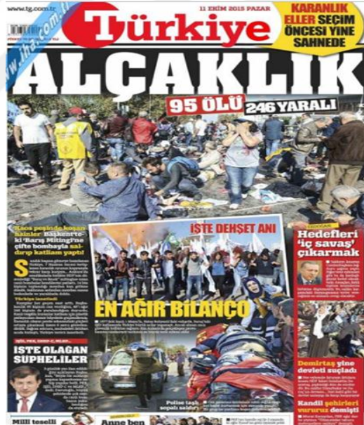
Görsel 4.1. Türkiye Gazetesi Ankara Gar Saldırısına İlişkin İlk Sayfa Haberi (Türkiye, 11 Ekim 2015: 1)

saldırıyı manşetten, ‘Alçaklık’ (Türkiye, 11 Ekim 2015: 1) başlığı ile vermiştir. Haberde kanlı bir fotoğraf kullanılarak patlamanın etkisini gözler önüne sermiştir. Ancak kanlı bir fotoğraf ve yoruma dayalı bir başlık olaya ne kadar duygusal yaklaşıldığını da göstermektedir. Yayınlanan ilk haberlerin ardından ele alınan bir haftalık süreç boyunca patlama haberleri yapılmaya devam edilmiştir. Gazete, haberlerde genel olarak öznel bir dil kullanmış ve başlıklarını yoruma dayalı atmıştır. Alıntı yapılan başlıklarda genellikle konuya yönelik devlet yetkililerinin sert açıklamaları yer almıştır. ‘Gerekirse PYD’yi de vururuz’ (Türkiye, 14 Ekim 2015: 1) alıntı yapılan başlıklardan biri iken yoruma dayalı başlıklar; ‘Kalles iş birliği’ (Türkiye, 15 Ekim 2015: 1), ‘Acıya saygı lütfen’ (Türkiye, 13 Ekim 2015: 1) şeklinde terör eyleminin nasıl gözüküğünü ve etkisini yansıtmaktadır. Saldırıların sonrasında HPY’ ye karşı tutum da oldukça net ‘HDP Acıyı çalıyor’ (Türkiye, 16 Ekim 2015: 1) başlığıyla birlikte HDP’ nin acıya saygı duymadığı düşüncesinin manşetlerde yer bulmuş halini yansıtıyor.