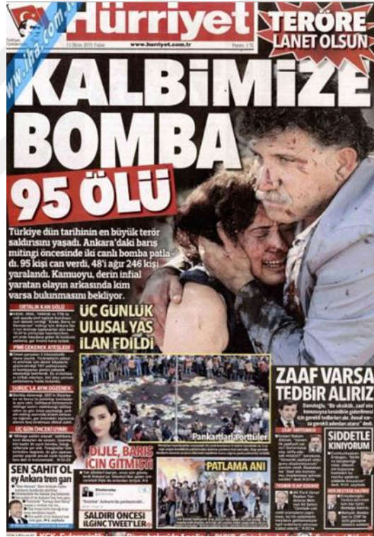
Görsel 4.7. Hürriyet Gazetesi Ankara Gar Saldırısına İlişkin İlk Sayfa Haberi (Hürriyet, 11 Ekim 2015: 1)

günlerde yapılan haberler bombalı saldırının sorumluları ve sonuçlarını anlamaya yönelik haberlerdir. ‘Polis IŞİD İzi Sürüyor’ (Hürriyet, 12 Ekim 2015: 1), ‘Barışı Nasıl Anlatacağım’ (Hürriyet, 13 Ekim 2015: 1), ‘Bir Aileden 18 Cenaze’ (Hürriyet, 14 Ekim 2015: 1) başlıklarında görülmektedir ki saldırı sonucu saldırıyı gerçekleştirenler ile ilgili elde edilen ipuçları ve saldırıda yakınlarını kaybedenlerin betimleyici ifadeleri başlıklara taşınmıştır. Başlıkların çoğu ise yoruma dayalıdır: ‘İhanetin son 3 günü’ (Hürriyet, 16 Ekim 2015: 1), ‘Önce bırak, sonra ara’ (Hürriyet, 17 Ekim 2015: 1). Gar saldırısının ardından Hürriyet, 7 gün boyunca terör olaylarına yer vermiştir. İlk gün hariç kanlı bir fotoğraf kullanmak yerine olay yeri, normal fotoğraflar ile haberler yapılmıştır. Saldırıların boyutunun büyük oluşu gazetenin olaylara yorum katarak anlatmasının temel nedeni olarak gösterilebilmektedir.