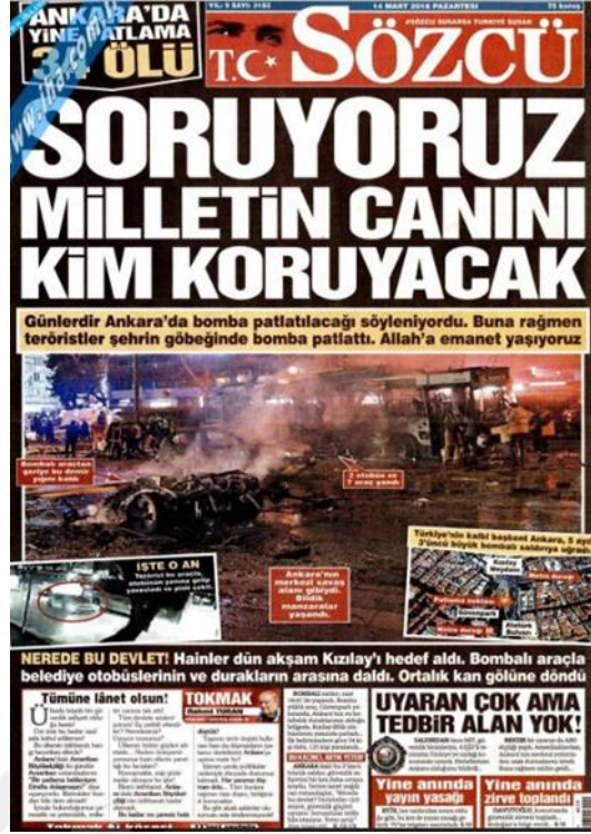
Görsel 4. 31. Sözcü Gazetesi Ankara Güvenpark Saldırısına İlişkin İlk Sayfa Haberi (Sözcü, 14 Mart 2016: 1)

Gazete üçüncü saldırıyı da iç sayfalarına taşımış ve detaylarını aktarmaya devam etmiştir. 'Ankara'da Yine Patlama' (Sözcü, 14 Mart 2016: 12) başlığı ile iki tam sayfa boyunca patlamanın ardından çekilmiş görüntüler eşliğinde haber yapılmıştır. 'Yine' kelimesi saldırıların sıklığından korkulması gerektiğini belirtmektedir. Haberin alt başlıklarında saldırının ardından Türkiye'de yetkililerin konuyla ilgili açıklamaları, istihbarat zafiyetleri ve dünyanın saldırıları kınama mesajlarına yer verilmiştir. Patlama anını gösteren görüntülerde habere eklenmiştir. İç sayfalarda birden fazla başlıkla haberler yapılmıştır. Bunların arasından en dikkat çekici olanları analize taşınmıştır. 'Ankara'yı Kana Bu Hain Buladı' (Sözcü, 15 Mart 2016: 10) haberinde gazete saldırganın resmini ve saldırganla ilgili elde ettiği bilgileri aktarmaktadır. 'Kana buladı' cümlesinde de görüldüğü gibi gazete ölüm korkusu da yaratmaktadır. Gazete saldırıyı yine iki tam sayfa boyunca anlatmıştır. Başbakan Ahmet Davutoğlu'nun açıklamalarına ve saldırıda hayatını kaybedenlerin kimliklerin belirlenmesi sürecini de 15 Mart 2016 tarihli sayısında iç sayfa haberi olarak yayınlamıştır. Saldırının yankıları ve saldırganlarla ilgili bilgiler ilerleyen günlerde de gazetede yer almıştır. 'Çirkin politikaların kurbanı oldu bu çocuklar' (Sözcü, 16 Mart 2016: 10) manşetinin devamında iç sayfalarında saldırganının