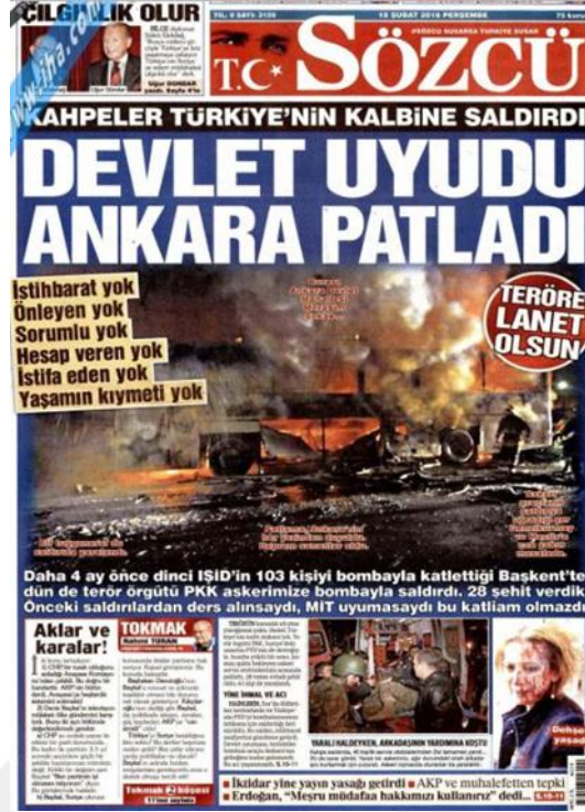
Görsel 4. 30. Sözcü Gazetesinin Ankara Genelkurmay Saldırısına İlişkin İlk Sayfa Haberi (Sözcü, 18 Şubat 2016: 1)

Gazetenin iç sayfalarında saldırı ile ilgili daha detaylı haberlere yer verilmiştir. ‘Kurtulmuş: Planlı bir eylem’ (Sözcü, 18 Şubat 2016: 10) Türkiye’nin önemli kurumlarının yakınlarında gerçekleşen saldırıyı Hükümet Sözcüsü Numan Kurtulmuş tarafından konuyla ilgili açıklamalarına yer verilmiştir. Haberde hükümet yetkililerinin görüşlerine de değinilmiştir. ‘Devletin kalbinde patlayan araba tüm Türkiye’yi dolaşmış!’ (Sözcü, 19 Şubat 2016: 9) başlıklı haberde bombanın bulunduğu araç sahte plaka ile Türkiye’yi bir baştan bir başa dolanmış ve bundan yetkililerin nasıl haberi olmamış sorunun cevabını aramaktadır. Dünya basınının Ankara saldırısına tepkisi de haberde yer almaktadır. ‘Davutoğlu’ndan 28 şehidimiz için 28 karanfil!’ (Sözcü, 20 Şubat 2016: 5) başlığının altında cenaze töreninden görüntüler ile haber yapılırken, ‘Ankara saldırısını TAK üstlendi’ başlığının devamında TAK hakkında bilgi verilmektedir (Sözcü 20 Şubat 2016: 5). 21 Şubat 2016 (Sözcü, 21 Şubat 2016: 12) yayınında saldırıda hayatını kaybedenlerin yakınları hakkında bilgiler yer almıştır. 22 Şubat 2016’da ise saldırının kimliği açıklanmış ve ailesinin röportajına yer verilmiştir. ‘MİT Emniyet’i uyardı ama tedbir alınmadı’ (Sözcü, 23 Şubat 2016: 12) saldırının nasıl gerçekleştiğini ve neden önlem alınmadığı konusunda elde edilen bilgiler paylaşılmıştır. Gazetenin ‘Canlı