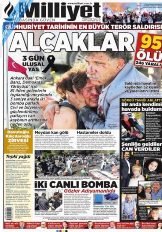
Görsel 4.13. Milliyet Gazetesi Ankara Gar Saldırısına İlişkin İlk Sayfa Haberi (Milliyet, 11 Ekim 2015: 1)

Gar saldırısının (birinci) ardından ‘Alçaklar’ (Milliyet, 11 Ekim 2015: 1) öznel başlığı altında manşetten kanlı bir fotoğrafla ve kaynak gösterilmeden verilmiştir. Olayla ilgili kısa süre içinde elde edilen bulgular doğrultusunda ‘İki örgüt’ (Milliyet, 14 Ekim 2015: 1), haberinde nesnel bir dil kullanılırken, ‘Katliama yayın yasağı’ (Milliyet, 15 Ekim 2015: 1), ‘Bedeli bu kadar ağır olmamalıydı’ (Milliyet, 12 Ekim 2015: 1: 1) başlıklı haberlerde de öznel bir dil kullanılmıştır. Saldırının gerçekleştiği yerle ilgili olarak ‘Katliam Meydanına Barış Anıtı’ (Milliyet, 13 Ekim 2015: 1) haberinde gerçekleşen olaya verilen önemi vurgulamaktadır. ‘Demokrasi Meydanı Oldu’ (Milliyet, 16 Ekim 2015: 1), başlıklı haberde saldırının gerçekleştiği meydana verilen isim üzerine nesnel bir içerik taşıyan, normal bir fotoğrafla sayfanın sağ köşesinde yer verilmiştir. 17 Ekimde saldırı haberi yapılmamıştır.