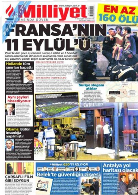
Görsel 4.17. Milliyet Gazetesi Paris Saldırılarına İlişkin İlk Sayfa Haberi (Milliyet, 14 Kasım 2015: 1)

Paris 13 Kasım 2015’ de ikinci bir saldırıyla terörle karşı karşıya gelmiştir. ‘Fransa’nın 11 Eylül’ü (Milliyet, 14 Kasım 2015: 1) manşetli haberde Fransa’nın bir gece içerisinde hem silahlı hem bombalı saldırıların hedefi olduğuna, pek çok kişinin hayatını kaybettiğinin yanı sıra hayatını kaybedenlerinde ciddi bir sayıya ulaştığını, Fransa’nın sınırlarda dâhil aldığı tedbirleri içermektedir. Hayatta kalanların saldırı anını anlattıkları röportajlar ile Fransız yetkililerin açıklamaları ‘Şovun Parçası Sandık’ (Milliyet, 15 Kasım 2015: 1) şeklindeki haberde saldırı hakkında bilgi verilmektedir. Fransa’da yapılan operasyonlar kısa sürede sonuç vermiş çok sayıda kişi öldürülmüştür. Gazete ‘Öldürülen terörist katliamın beyni çıktı’ (Milliyet, 20 Kasım 2015: 1) başlıklı haberde öldürülen teröristlerden birinin saldırıyı planlayan kişi olduğu belirtilmiştir. Milliyet gazetesi saldırıya yoğun olarak yer vermiştir.