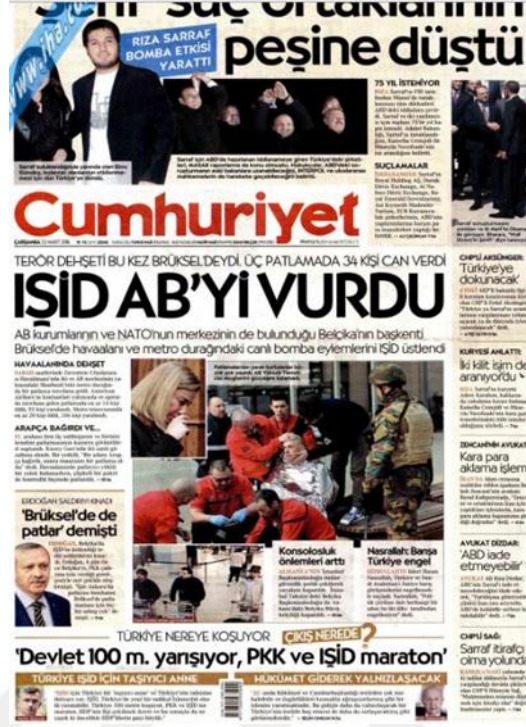
Görsel 4.22. Cumhuriyet Gazetesi Brüksel Saldırısına İlişkin İlk Sayfa Haberi (Cumhuriyet, 23 Mart 2016: 1)

Gazetenin iç sayfalarına gelindiğinde Türkiye’de gerçekleşen üçüncü saldırının hemen ardından meydana gelmesine rağmen olaya yer verilmeye devam edilmiştir. ‘AB kalbinden vuruldu’ (Cumhuriyet, 23 Mart 2016: 10) konu ile ilgili ölenlerin sayısı saldırının gerçekleştiği yerler ve saldırı sonrası görüntülerin yer aldığı bir başlıktır. ‘Brüksel’de patlamaması için bir sebep yok’ (Cumhuriyet, 24 Mart 2016: 13) bu açıklama Cumhurbaşkanı Erdoğan’ın teröristlere ev sahipliği yapan bir ülke olduğu için Belçika’nın terörist saldırıların gerçekleşmeyeceğini göstermediğini ifade etmektedir. Cumhurbaşkanı ayrıca teröristi yakalayıp sınır dışı ettiklerini ancak Belçikalı yetkililerin gerekeni yapmadıklarını da sözlerine eklemektedir. Saldırıların ardından güvenlik zafiyeti olup olmadığı sorusunu da akıllara getirmiştir. ‘Havalimanında güvenlik eksik mi’ (Cumhuriyet, 25 Mart 2016: 13) başlıklı haberde bu sorunun cevapları verilmeye çalışılmıştır. Aynı tarihli yayında gazetede İŞİD’Lİ teröristlerin Avrupa’da sayıca çok fazla oldukları bilgisi verilmektedir. ‘İki kardeş patlattı’ (Cumhuriyet, 26 Mart 2016: 13) başlıklı haberde saldırıyı İŞİD’Lİ iki kardeşin yaptığı ve bu kardeşlerin geniş bir suç geçmişine sahip oldukları bilgisi verilmiştir. Bombalı saldırının faillerinden olan bir şüphelinin yakalanmasının ardından ‘Belçika’da kritik gözaltı’ (Cumhuriyet, 27 Mart