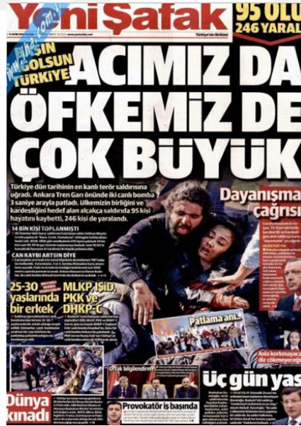
Görsel 4.23. Yeni Şafak Gazetesinin Ankara Gar Saldırısına İlişkin İlk Sayfa Haberi (Yeni Şafak, 11 Ekim 2015: 1)

Yeni Şafak gazetesi 'Acımızda öfkemizde çok büyük' (Yeni Şafak, 11 Ekim 2016: 1) başlıklı haberinde 10 Ekim'de gerçekleşen Ankara Gar (birinci) saldırısını 11 Ekimde böyle yayınlamıştır. Olayın kanlı görüntülerine kanlı bir fotoğraf da yer vermiş ve kaynak kullanmamıştır. Anlatımında öznellik ağır basmaktadır. Saldırının üçüncü gününde elde edilen bulgulara yönelik haberler yapılmaya başlanmıştır: '33 Yelek Alarmı' (Yeni Şafak, 12 Ekim 2015: 1), 'Bir isme çok yaklaştık' (Yeni Şafak, 13 Ekim 2015: 1) manşet ve sürmanşette yer alan bu haberlerde hem nesnel hem öznel bir dil kullanılmış, fotoğraflar normal içerikli seçilmiş ve kaynak kullanılmamıştır. Yetkililerin konuyla ilgili çalışmalarına ve saldırganlar hakkında elde edilen bilgilere yönelik haberlere de yer verilmiştir: 'Devlet Denetleme Kurulu Görevde' (Yeni Şafak, 14 Ekim 2015: 1), 'İŞİD – PKK ortaklığı' (Yeni Şafak, 15 Ekim 2015: 1), 'İhanet İçeride' (Yeni Şafak, 16 Ekim 2015: 1). 17 Ekim'de saldırıya yönelik haber yapılmamıştır.