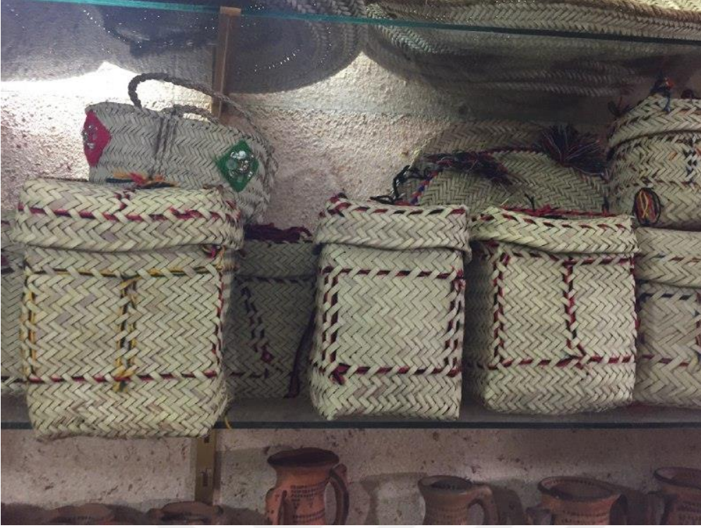
Fotoğraf 3. Zahedan'da yerel halk tarafından üretilen hasır sepetler