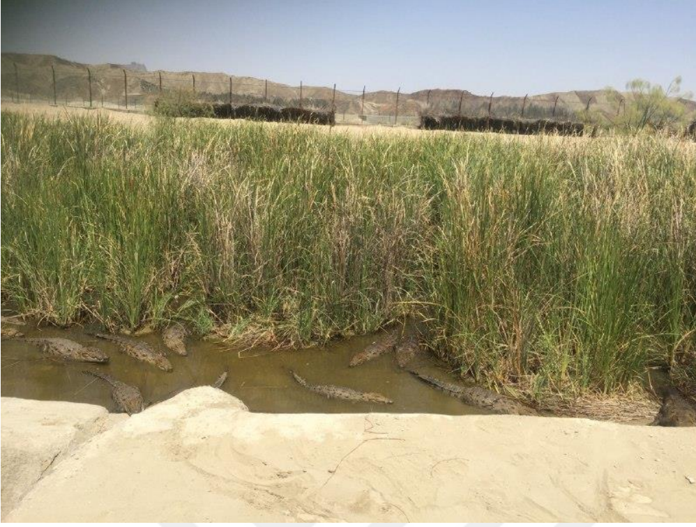
Fotoğraf 6. Sistan ve Belucistan Bölgesi 'nde Gesr-i Gend şehrinde yüzen timsahlar