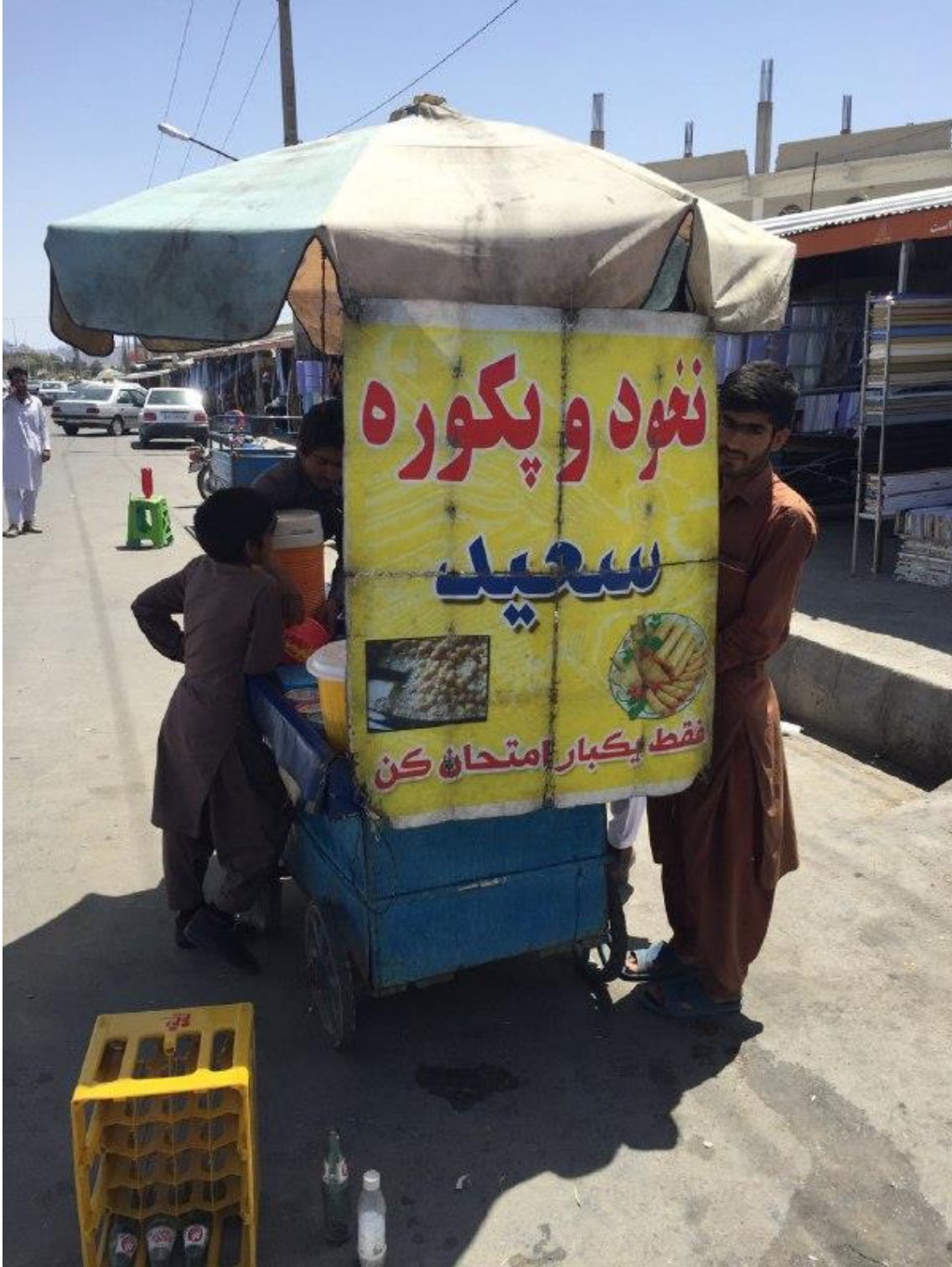
Fotoğraf 1. Zahedan sokaklarında bir seyyar yemek satıcısı