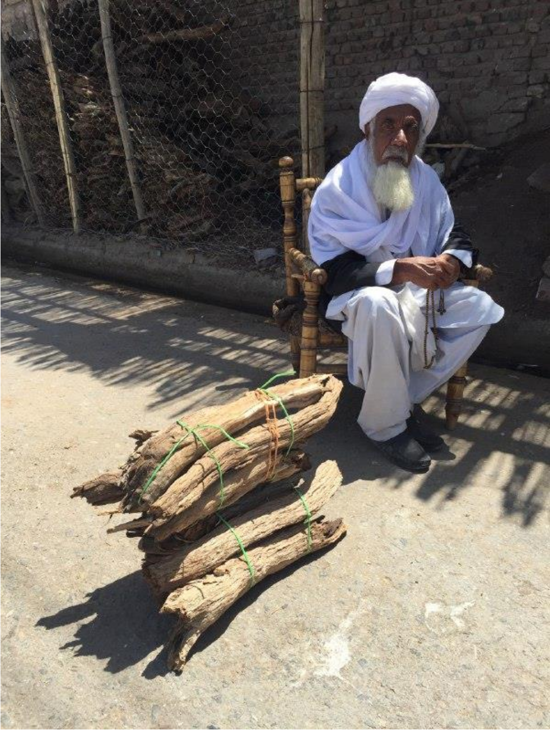
Fotoğraf 5. Sokakta günlük yerel kıyafetler içerisinde oturan Beluci bir beyefendi