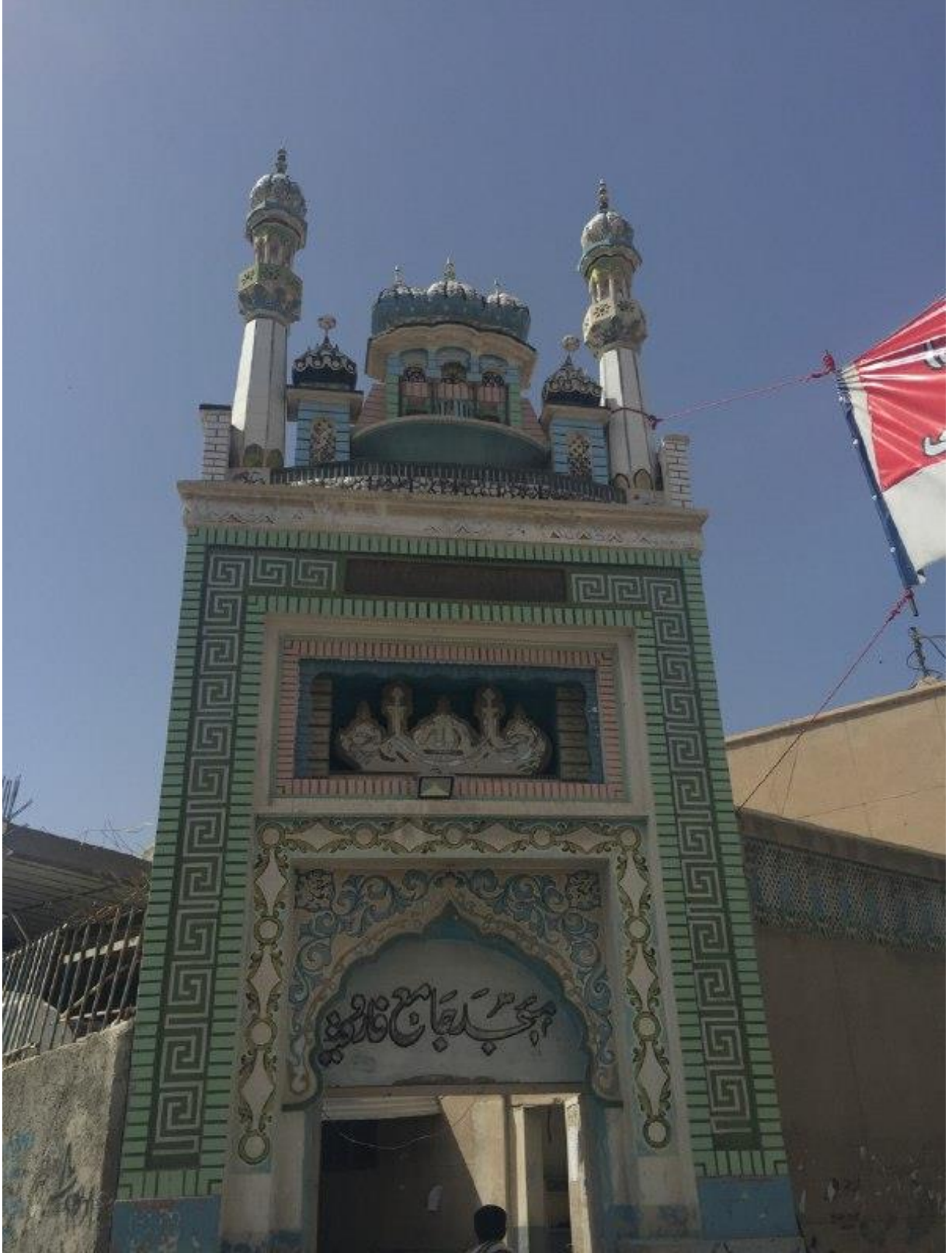
Fotoğraf 9. Sistan ve Belucistan Bölgesi'nde bir cami (Masjed-e Jame'e Farooqi)