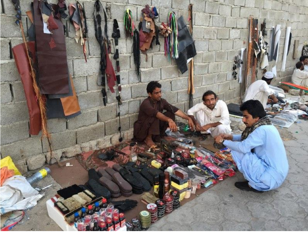
Fotoğraf 7. Zahedan sokaklarında satıcılık yapan bir grup insan