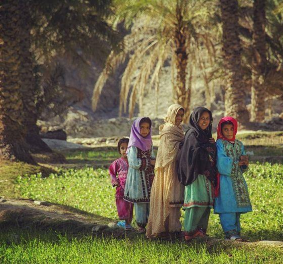
Fotoğraf 4. Serbaz civarındaki Kan köyünde oyun oynayan Beluci çocuklar