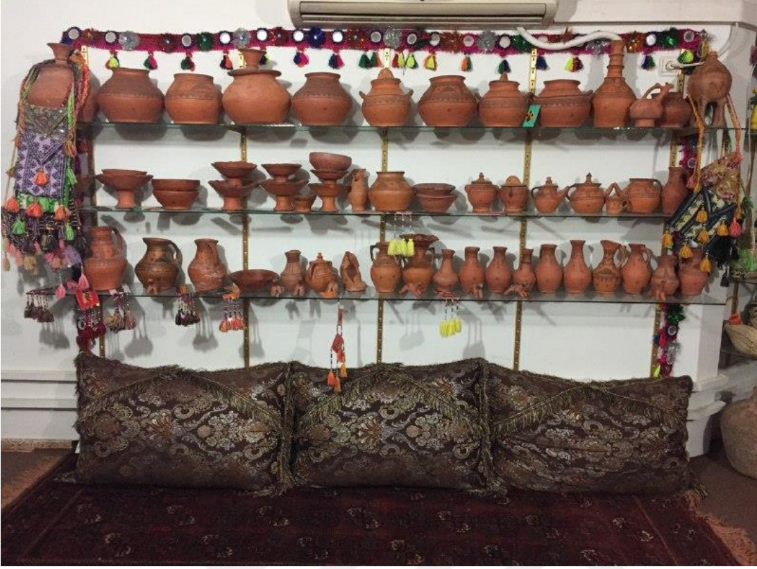
Fotoğraf 10. Zahedan'da çanak çömlek imalatının ve satışının yapıldığı bir dükkan.