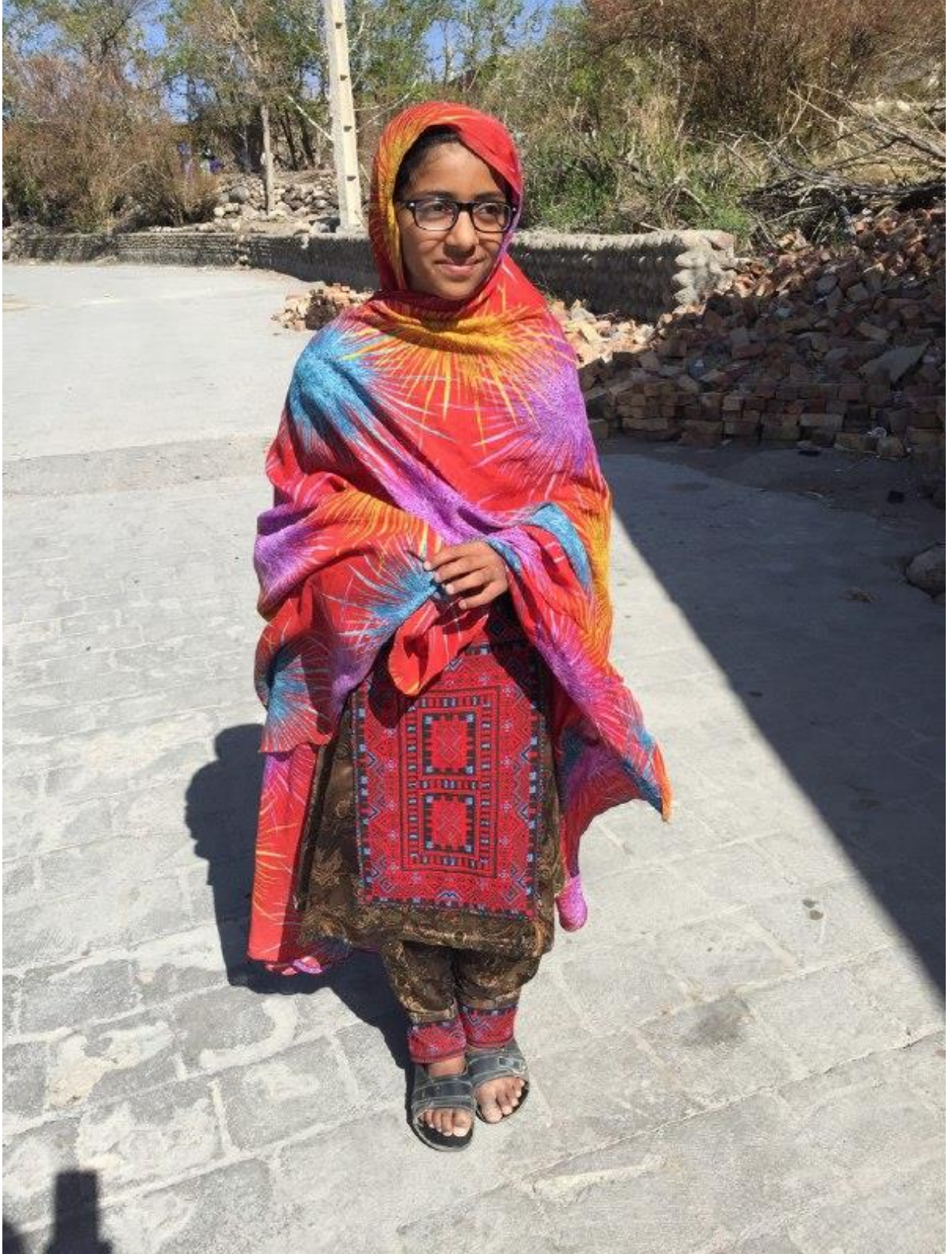
Fotoğraf 2. Gnlk yerel kıyafetler ierisinde Beluci bir kız ocuėu