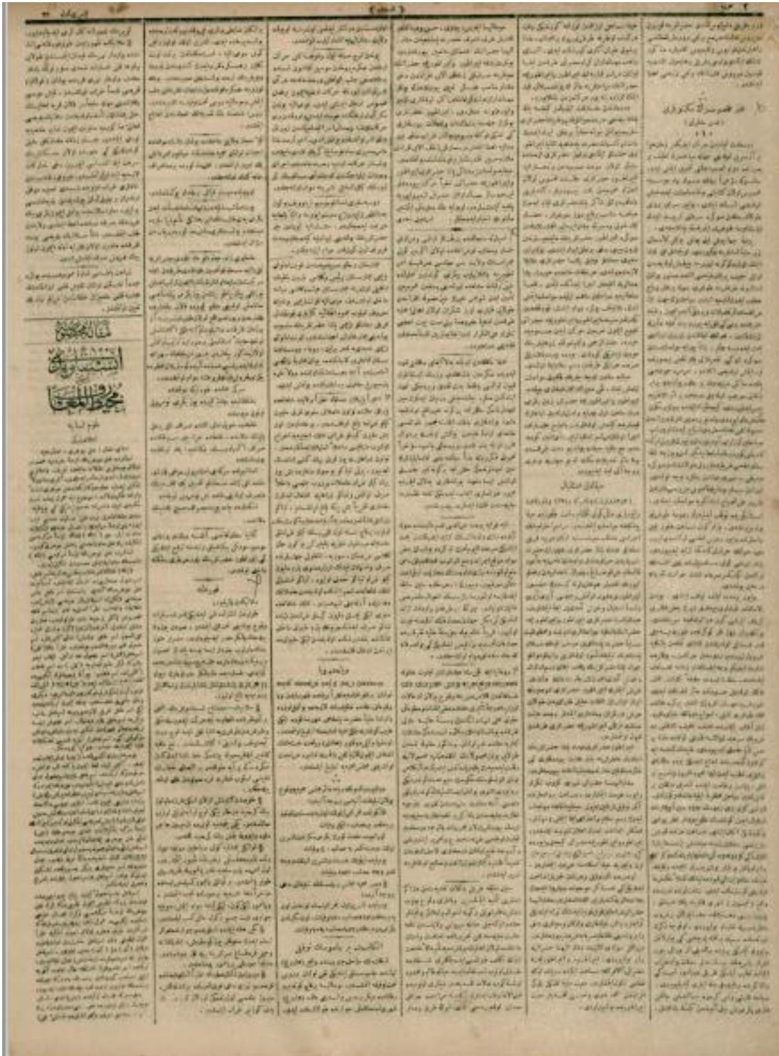
Kaynak: İkdam, 4 Teşrinisani 1898, 1.