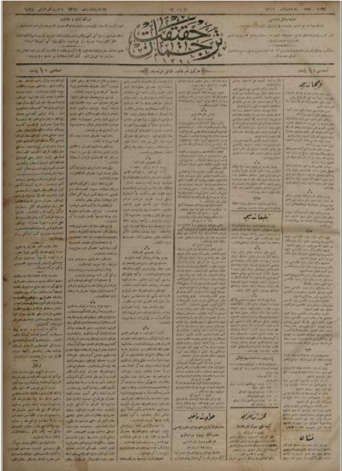
Kaynak: Tercüman-ı Hakikat, 6 Teşrinisani 1898, 1.

Tercüman-ı Hakikat gazetesinin 6297. nüshasından itibaren yayınlamaya başladığı, İmparatorun Kudüs seyahatine dair bilgilerin yer aldığı Havadis-i Dâhiliye başlıklı yazı dizisinden ilki.