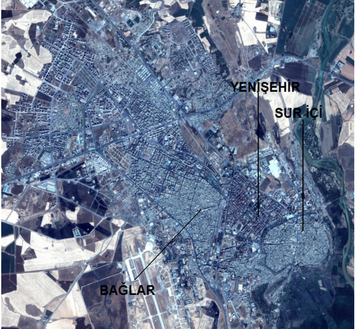
Grafik 3 Diyarbakır'ın Kuşbakışı Görünümü