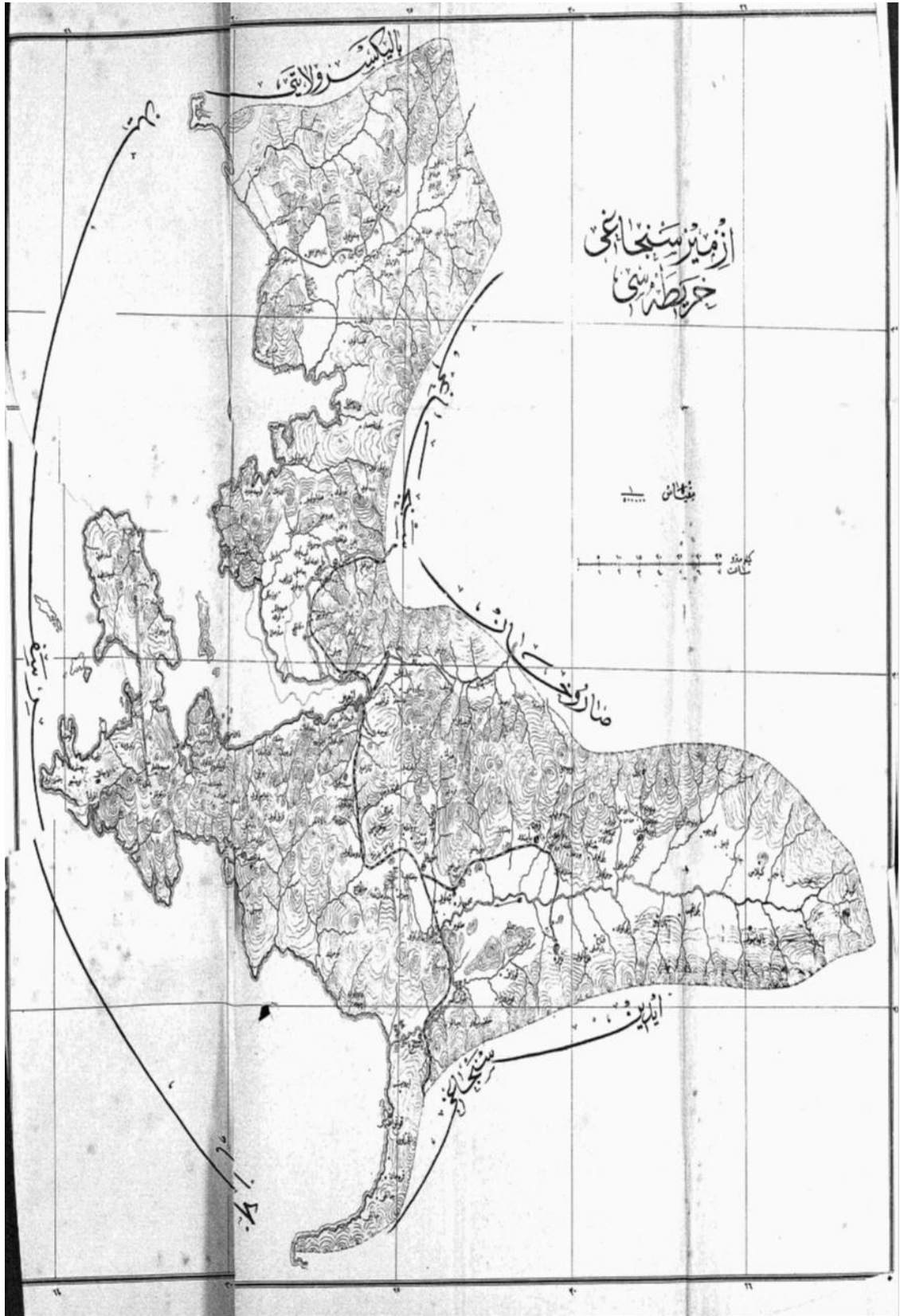
1301Hicri (M.1884) (Def'a 6) Aydın Salnamesinde İzmir Sancağı Haritası