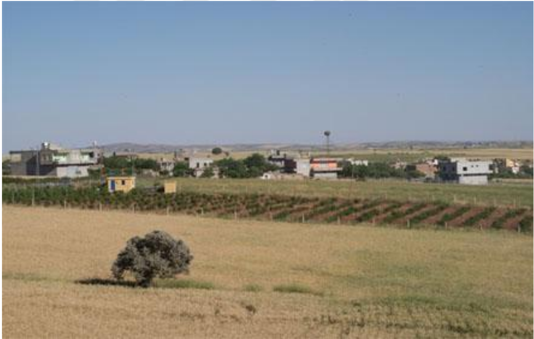
Resim 2: Ortanca köyünden bir görünüm.

Eski adı Süsyan olan Ortanca Köyü'nde genelde akraba aileler yaşamaktadır. 34 Köyün başlıca geçim kaynağı çiftçiliktir. 35 Köyde yetişen en önemli ürünler arpa, buğday, nohut, mercimektir. 36 Hayvancılık daha çok kendi ihtiyaçlarını karşılamak amacıyla yapılmaktadır. 37