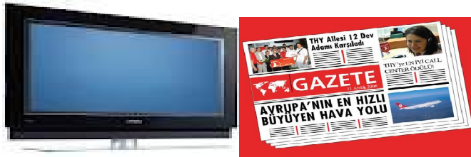
Şekil 3- Günümüz gözetleme, denetleme araçlarından bir kaç tanesi ( Özellikle televizyon, sinema, gazete gibi kitle iletişim araçları, zihinlere empoze edilmek istenen olgunun, bilinç altında imgesinin seyirciye verildiği araçlardır.)