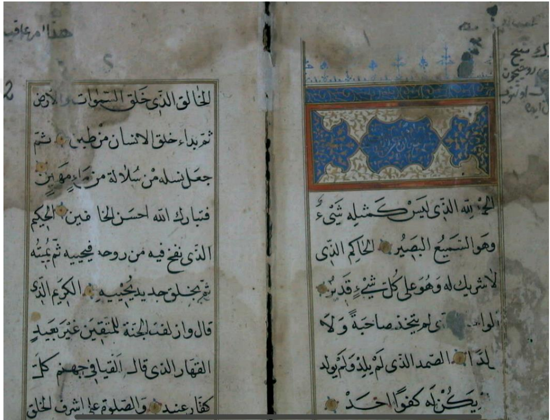
Risâle fi'r-reddi ale'l-millet'in-Nasrâniyyeti bi'l-Încîl min kabeli ilmi'l-kelâm yazmasının ilk iki sayfası