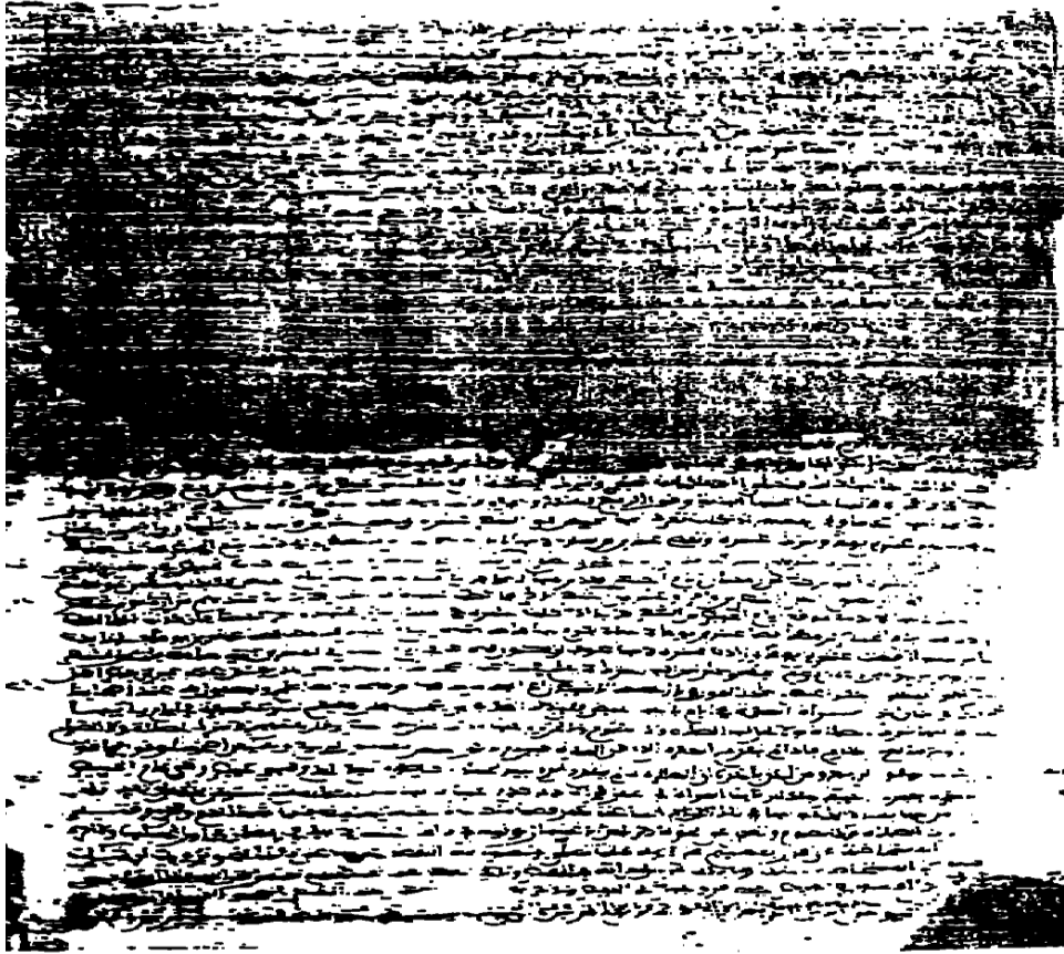
2 nushanın örneği