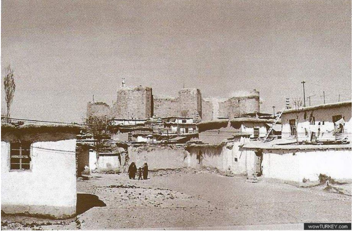
RESİM 1. Karaman Kalesi çevresinden kale görünümü( http://www.kerimusta.com/1905-yilinda-karaman-resimleri fotoğraf, Erş: 25.10.2014)

1905 yıllarında kimine göre gezgin, kimine göre ajan olan Bayan Gertrude Bell Karaman'a gelerek fotoğraflar çekmiştir. Bu fotoğraflardan 9 adeti Karaman'ın eski görünümünü göstermektedir.