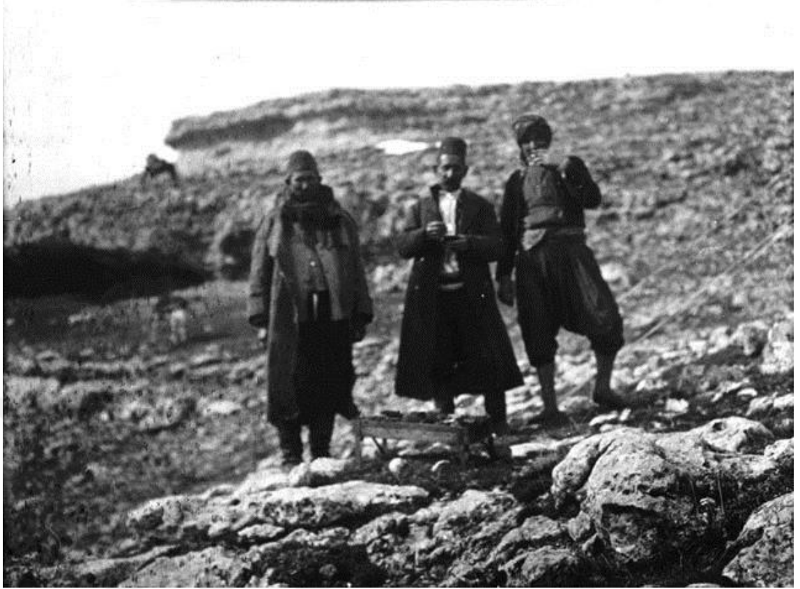
Sivil ve askerden bir Görünüm