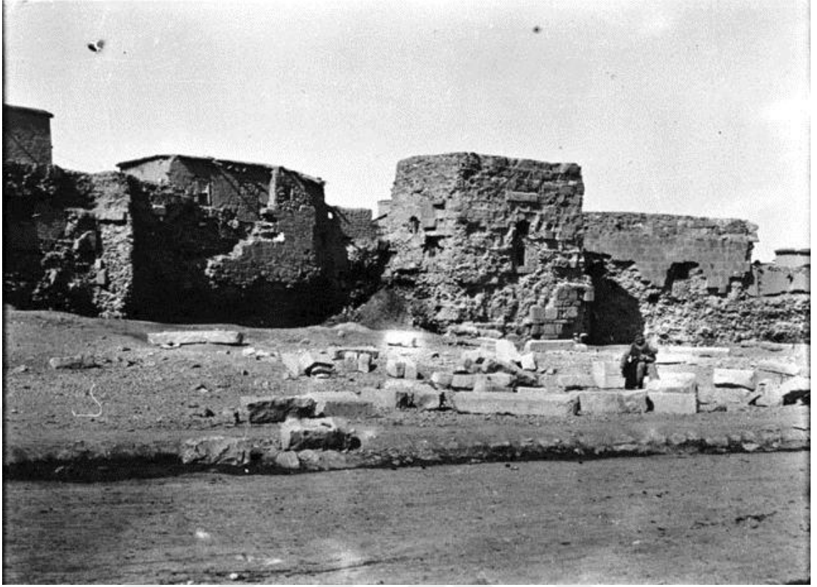
Karaman Kalesi Orta Kale Duvar kalıntıları