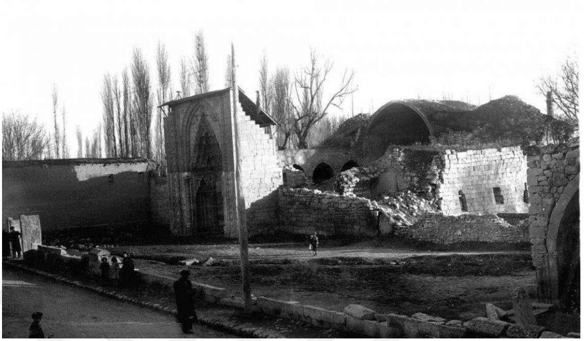
Hatuniye Medresesi