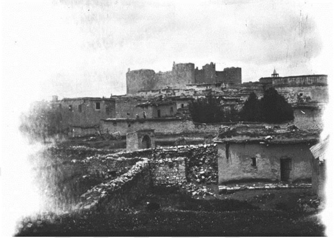
Karaman kalesi 1905