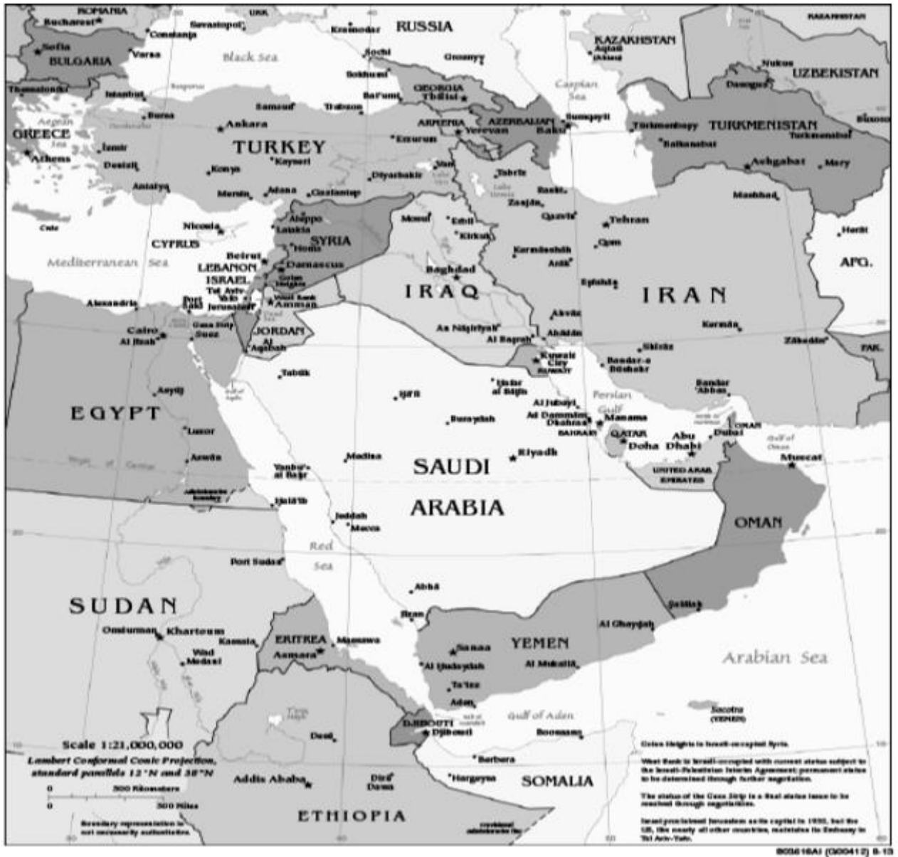
Şekil 1: Ortadoğu Haritası 68