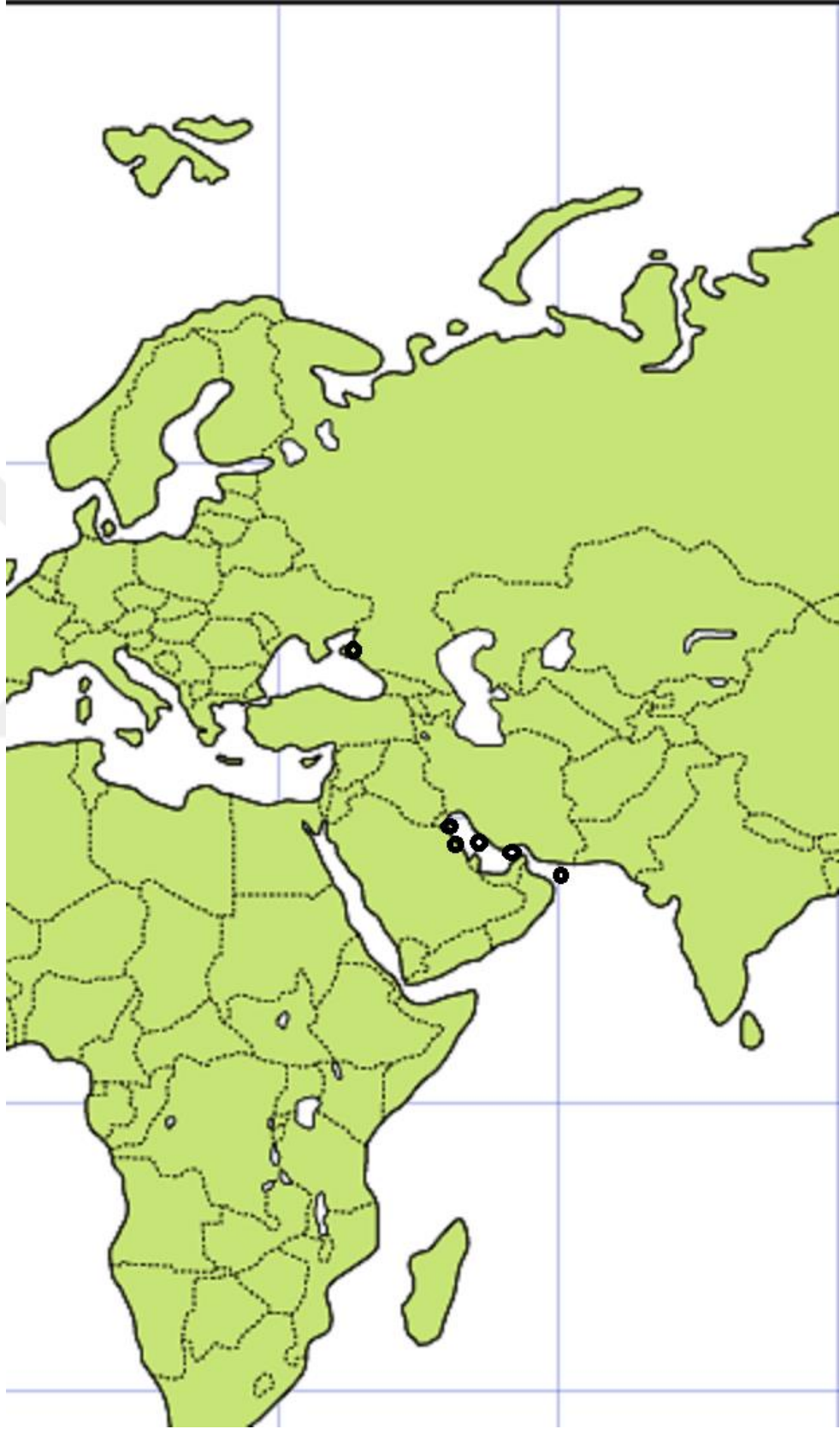
Resim 2: Evliya Çelebi Seyahatnâme'sinde geçen inci dalış yerleri