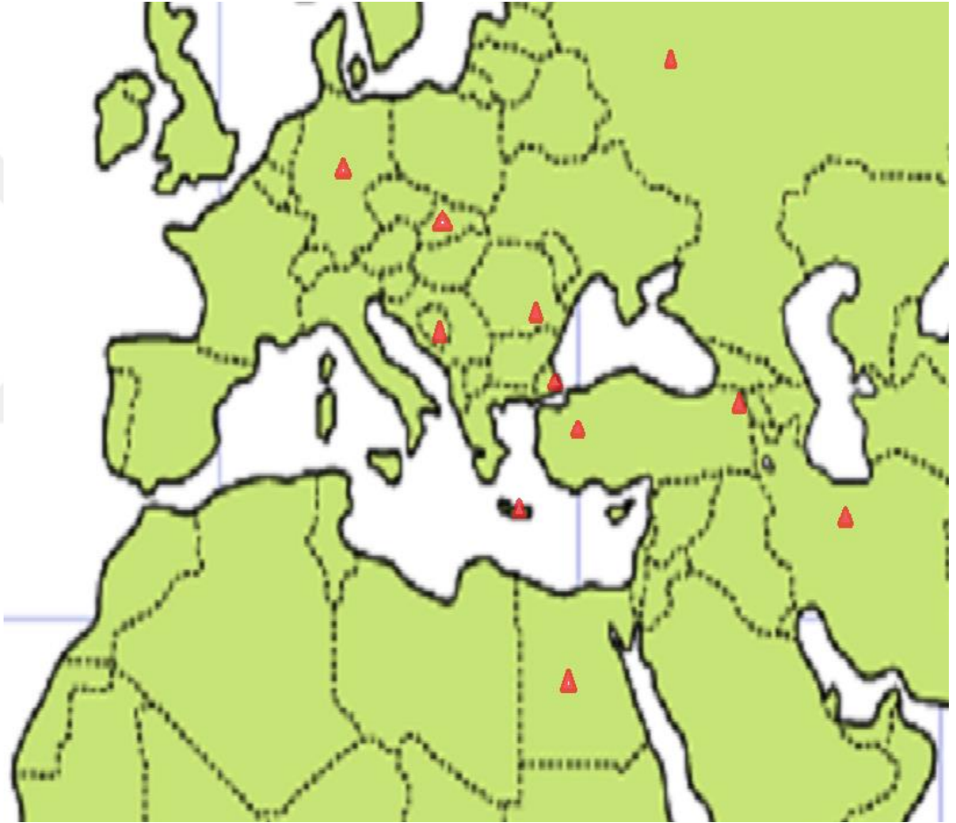
Resim 1: Evliya Çelebi Seyahatnâmesinde geçen altın madenleri

Evliya Çelebi Seyahatnâme'inde adı geçen Sarıyer, Kütahya, Kağızman, Akra Dağı, Bosna, Filibe, Almanya, Levice, Romanya (Bükreş), Moskova, Mısır ve Girit adasında çıkarılan altına harita üzerinde bakacak olursak: