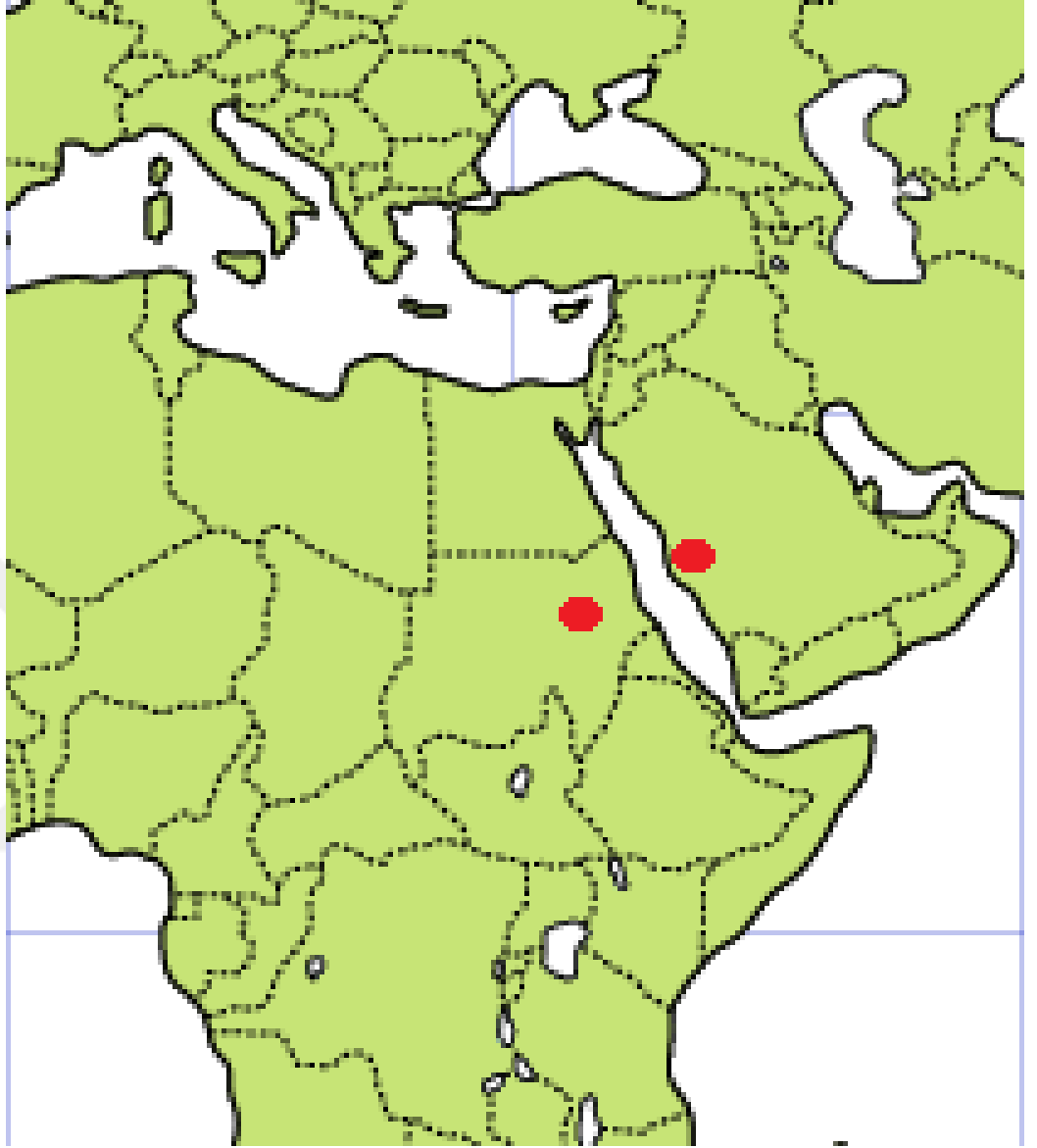
Resim 3: Evliya Çelebi Seyahatnâmesi'nde geçen zümrüt madenleri