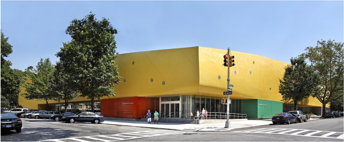
Brooklyn Children’s Museum

19. yüzyılın son çeyreği ile 20. yüzyılın başlarında ortaya çıkan çocuk müzeleri ise önemli müze türlerindedir. Günümüzden yaklaşık 100 yıl önce Amerika’nın New York şehrinde kurulan “Brooklyn Children’s Museum” bilinen ilk çocuk müzesidir. Amerika’da günümüzde sayıları 300’ü bulan çocuk müzesi bulunmaktadır. Bu müzeler okullardaki eğitim içeriğiyle uyumlu bir şekilde sergi ve rehberlik hizmeti vermektedirler (Zilcioğlu, 2008:19-20).