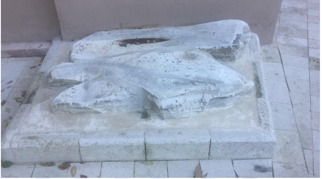
İstanbul Müftülüğü'nün içerisinde yer alan Cellat taşı

orijinal bir fikirdir. Saltanatın göz alıcı noktalarına, saray hayatına ve kazanılan zaferlere yer veren romanların aksine Cellat Taşı'nın üzerinden Osmanlı Devleti'nde yaşanmış acılara, acı olaylara yer verilir.