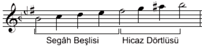
Şekil.12 Segah makamı dizisi