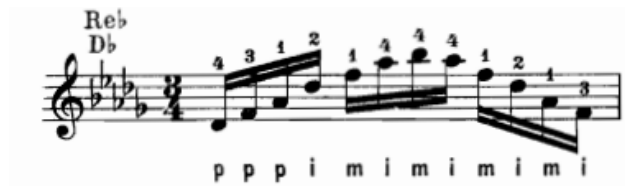
Şekil.20 Gitarda arpej tekniği için bir örnek.

Akorlardaki seslerin değişik sıralamalara göre çalınması ya da tınlatılmasıdır. Klasik gitarda arpej tekniğini çalmak için; sağ el parmakları, sol elin basarak hazırlanmış olduğu akorları ayrı zamanlarda tınlatmalıdır. Arpej de, eşlik etmede kullanılan diğer teknikler gibi üç veya daha fazla tel kullanılarak çalınabilir.