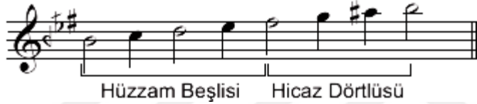
Şekil.14 Hüz zam makamı dizisi

“Makam dizilerinin komalı sesleri tampere sistemde en yakın seslerle birleştirildiğinden koma si bemol (segâh) sesi; si natürel, bakiye mi bemol (hisar) sesi ise mi bemol olarak çalınır(Yıldırım-Çelikkanat, 2014:57). İfadesi yer almakta ve dizi aşağıdaki şekilde gösterilmektedir.