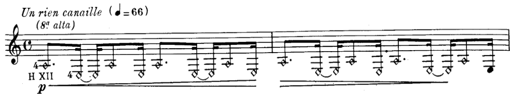
Şekil 21. Flajöle tekniği, Ronald DYENS. Tango en skai eserinin giriş bölümü