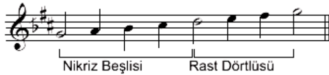
Şekil.9 Nikriz makamı dizisi

Nikriz beşlisinin dörtlüsü tam değil 26 komalık artık dörtlüdür. Beşlisi dörtlüsünün sonuna 1 tanini ilavesiyle yapılmamış, bir küçük mücennep eklenerek meydana getirilmiştir. Ayrıca Nikriz makamı dizisinin güçlü üzerindeki kısmında Rast ve Buselik olmak üzere iki ayrı çeşni bulunur. İşte bu sebepler dolayısıyla Nikriz makamı basit değil, mükerreb (Bileşik) makamdır” (Özkan, 1998:384).