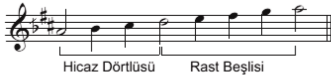
Şekil.7 Hicaz makamı dizisi

(Hicaz dörtlüsü + 4.derecede rast beşlisi).