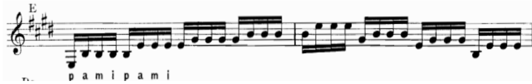
Şekil.26 Tremolo tekniğinin porte üzerinde gösterimi.

Gitarda artarda aynı üç notanın aynı tel üzerinde çalındığı tekniktir. (Roch, 1917:6)