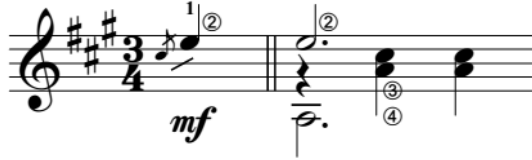
Şekil.23 Glissando tekniğinin porte üzerinde gösterimi.

Çalınan bir notadan diğerine sağ el kullanılmadan sol el ile kayarak ulaşıldığı tekniktir. Tarrega gran vals eserinin giriş bölümü