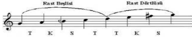
Şekil.2 Rast makamı dizisi

(Rast beşlisi +5. Derecede Rast dörtlüsü).