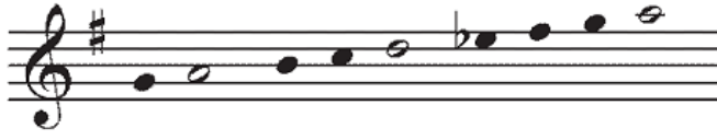
Şekil.17 Tampere sistemde Karcıgar makamı dizisi

GSL 12. Sınıf gitar ders kitabı basılmadığından Karcıgar makamının gitar dersine nasıl uygulandığı hakkında herhangi bir bilgi mevcut değildir. Ancak GSL 11. Sınıf Keman ders kitabında karcıgar makamı dizisi aşağıdaki gibi gösterilmektedir.(Darendelioğlu-Tabrizi, 2014:90)