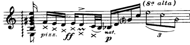
Şekil.22 Pizzicato tekniğinin porte üzerinde gösterimi

Gitardan daha boğuk bir ses elde edilmesi amacıyla tellerin köprüye yakın kısmının sağ el ile kapatılıp bas parmak ile çalındığı tekniktir.