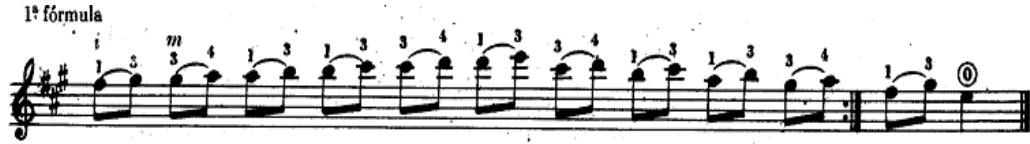
Şekil.24 Legato tekniğinin porte üzerinde gösterimi.

Çalınan iki nota arasında ilkinin sağ el ile çekilip ikinci notanın sesinin sol el yardımı ile elde edildiği tekniktir. Arenas II 1991:9)