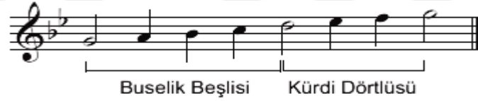
Şekil.11 Nihavent makamı dizisi

(Buselik dördlüsü+ 5. Derecede Kürdi veya Hicaz dördlüsü)