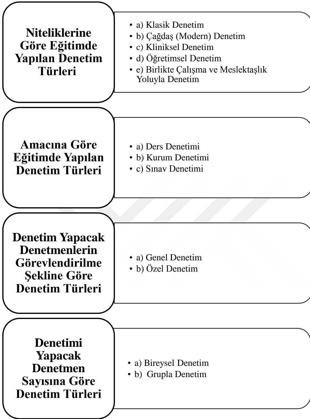
Şekil 1. Denetim Türleri (Kayıkçı, 2004)

Tortop'a (1974: 30) göre yönetimin denetleme yolları;