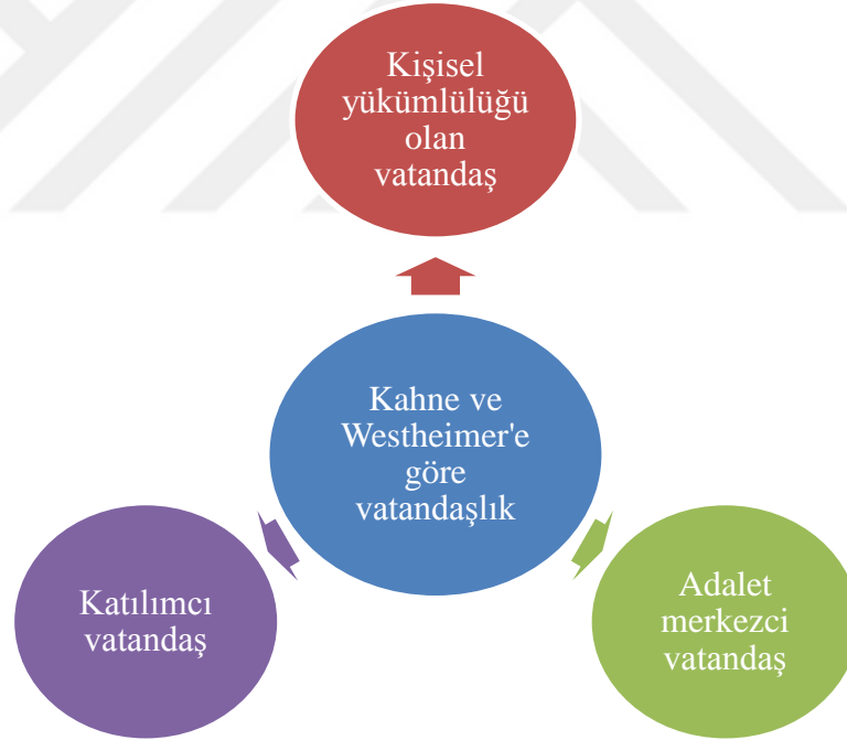
Şekil 2. Kahne ve Westheimer'e Göre Vatandaşlık Türleri

Pierson (2000), vatandaşlık sınıflandırmasında ulus devlette göre vatandaşlığın niteliklerini statü, haklar, görevler, eşitlik ve etkin katılım olarak aşağıda izah etmiştir: