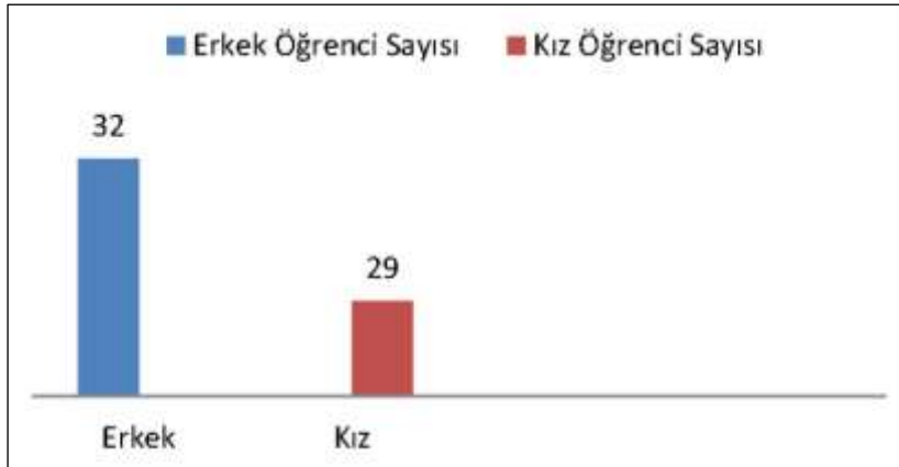
Grafik 1. Öğrenci cinsiyet durumu