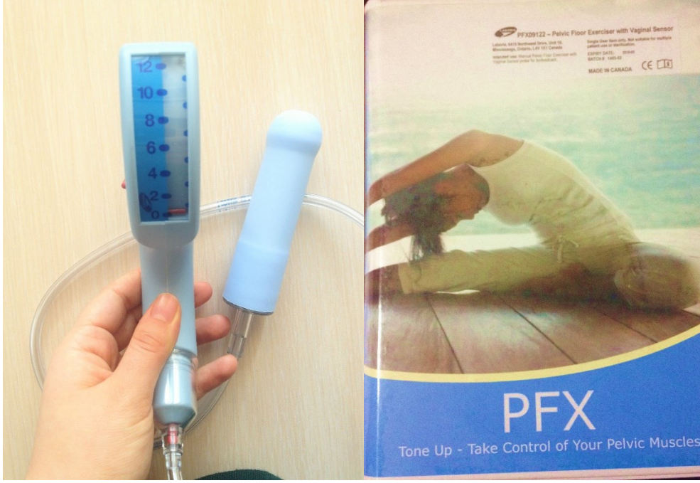
Resim 5.1. Perineometre