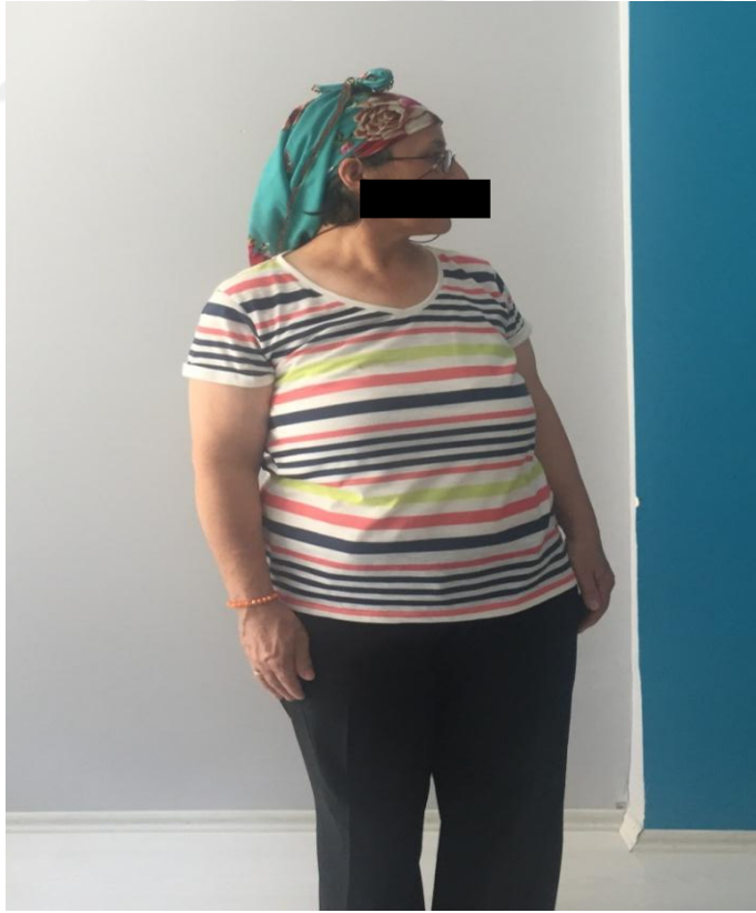
Resim 5.2.1.2.iii. Berg Denge Ölçeđi. Ayaktayken sađ ve sol omuzdan geriye bakma