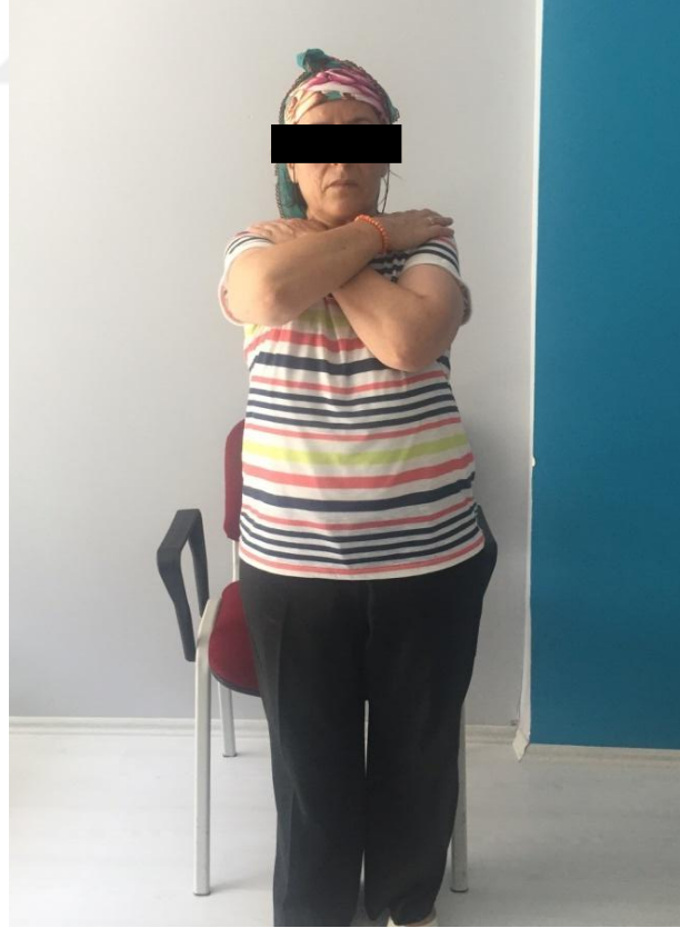
Resim 5.2.1.2.i. POMA testi.Oturmadan Ayađa Kalkma