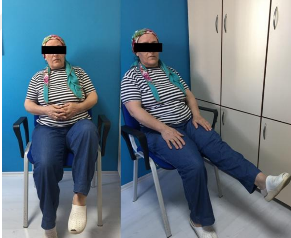
Resim 5.2.2.3.iii. Isınma Egzersizleri Kalça Fleksiyonu- Diz Ekstansiyonu