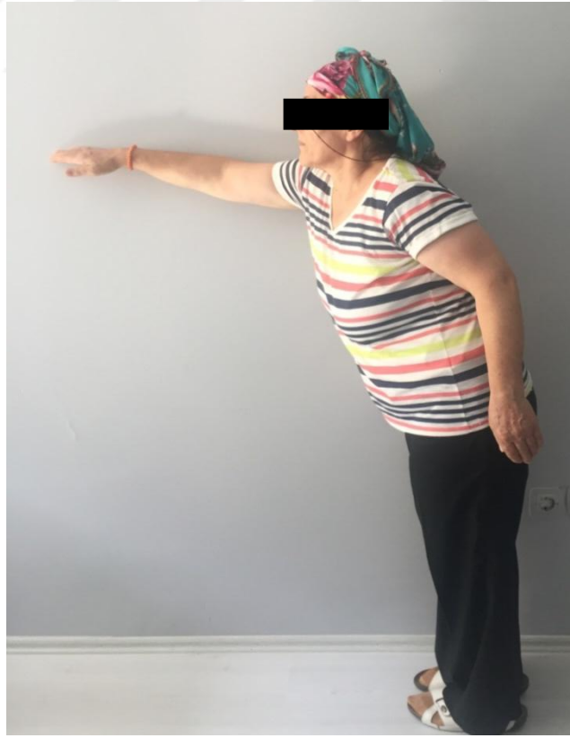
Resim 5.2.1.2.ii. Berg Denge Ölçeđi. Ayaktayken öne uzanma