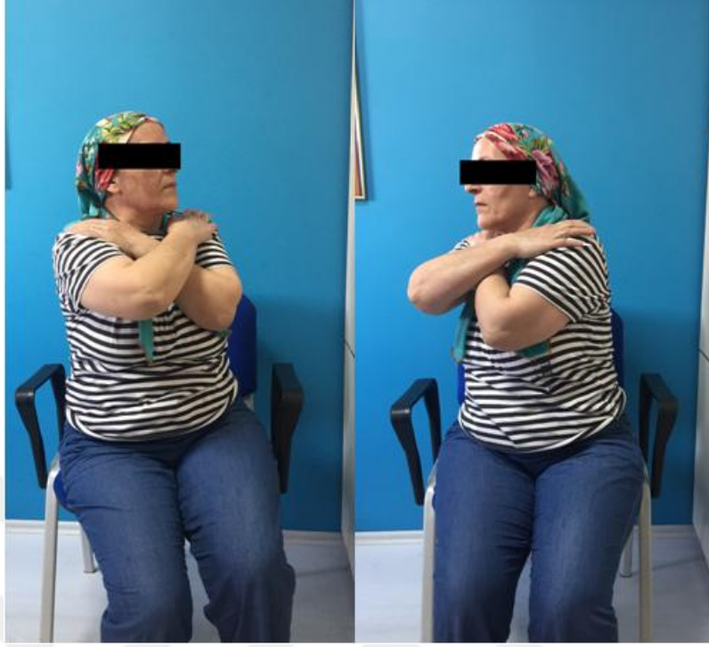
Resim 5.2.2.3.ii. Isınma Egzersizleri Gvde Rotasyonları