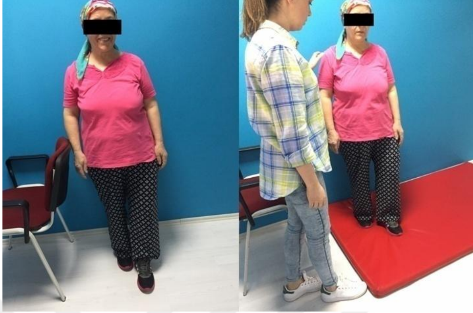
Resim 1.2.2.3.v. Denge Egzersizleri Sert Zeminde Yarı Tandem Duruş- Yumuşak Zeminde Yaritandem Duruş