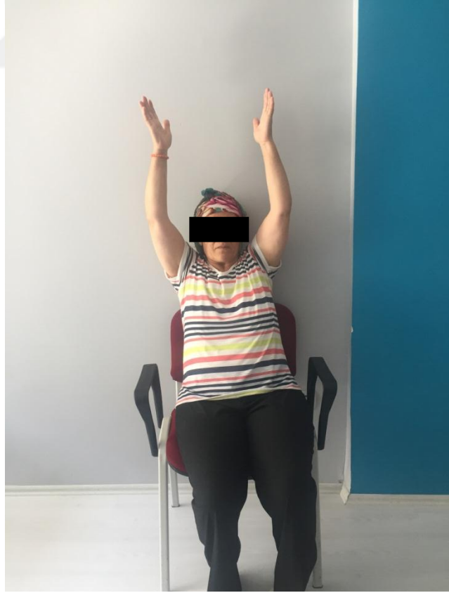
Resim 5.2.2.3.i. Isınma Egzersizleri Omuz Abduksiyonu-Omuz Fleksiyonu