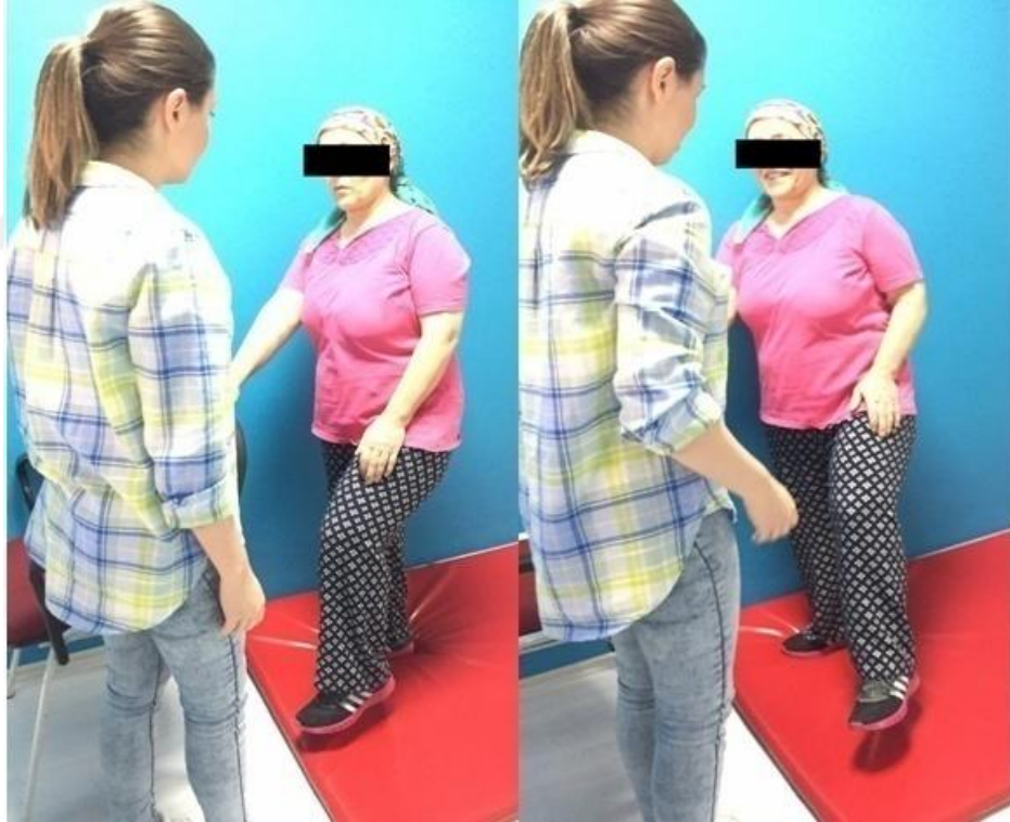
Resim 5.2.2.3.vi. Denge Egzersizleri Yumuşak Zeminde Kalça Diz Fleksiyonu-Kalça Abduksiyonu