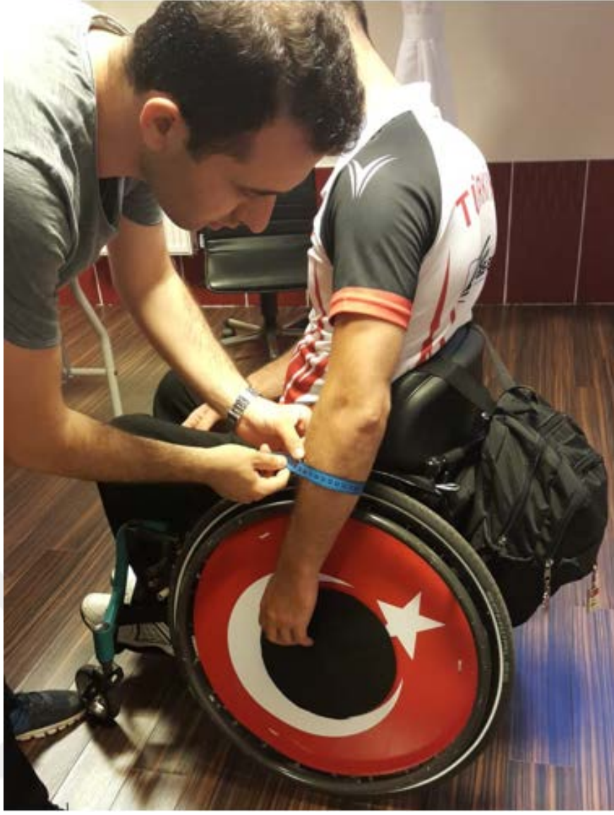
Resim 5.2. Ön kol çevre ölçümü