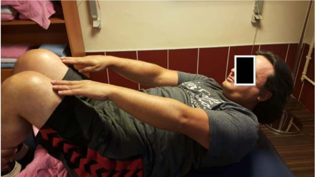
Resim 5.1. Gövde fleksiyon endurans testi

Lateral uzanma testi sırasında sporcular kolçaksız ve sırt desteği olan bir sandalyeye oturtulur. Uzanmalar esnasında sırt desteğinden yararlanılmasına izin verilmez. Sporcular kalça, diz, ayaklar 90 derece fleksiyonda iken ayaklar yerde pozisyonlanmış şekilde sandalyeye oturtulur. Sporcunun acromionu hizasında duvara mezurasabitlenir. Sporcunun dominant kolunun acromionu hizasında duvara sabitlenen mezuradan ilk pozisyonda sporcudan kolunu 90 derece abduksiyona getirmesi istenerek okunan değer kaydedilir. Ölçüm için ulnanın stiloid çıkıntısı referans alınarak kol uzunluğu işaretlendi. Daha sonra sporcudan yana uzanabildiği son uzaklığa kadar uzanması istenir. Yapılabilen maksimal uzanma esnasında ulnanın stiloid çıkıntısının geldiği mesafe kaydedilir. Kontralateral el omblikus üzerinde kompansatuar stabilizasyonu önlemek amacıyla sabitlenir. En yüksek olan değer kaydedilir. Başlangıçtaki ölçüm ile bu değer karşılaştırılır.