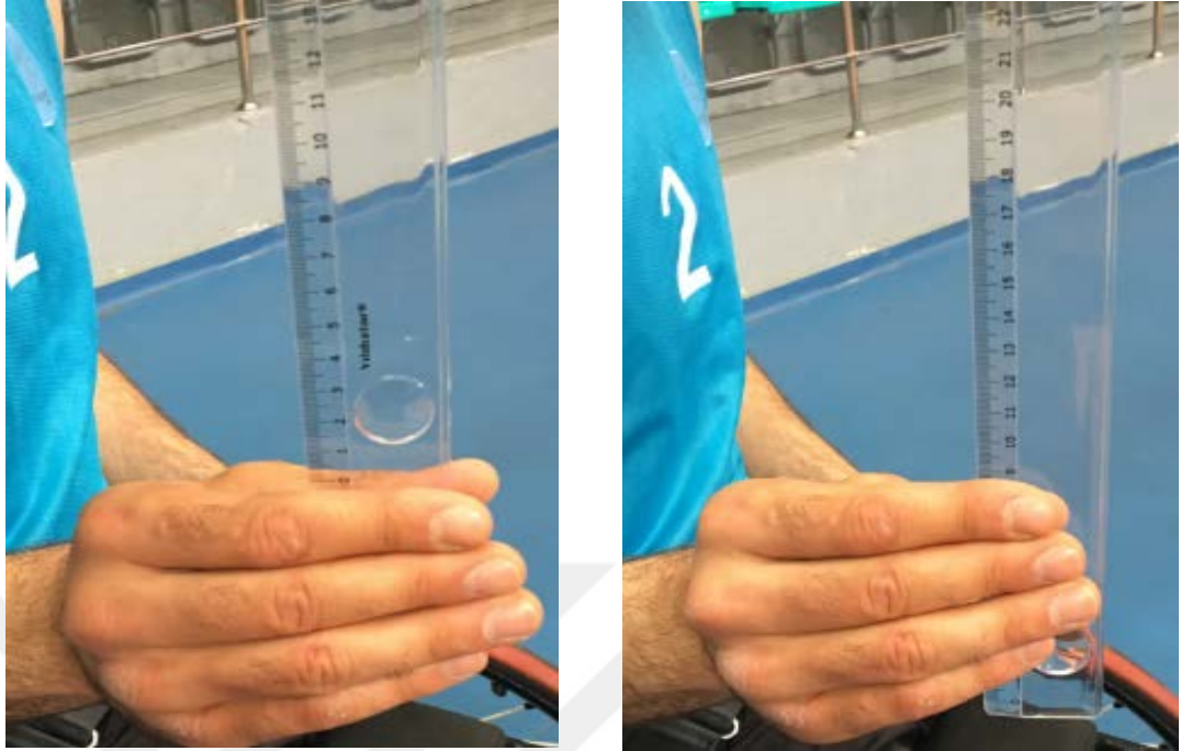
Resim 5.3.4.1. Nelson görsel el reaksiyon testinin yapılışı