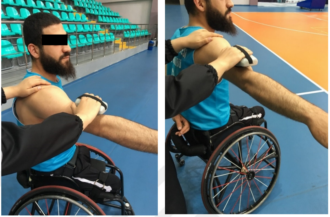
Resim 5.3.5.1. Omuz fleksör ve abdükör kas kuvveti ölçümü