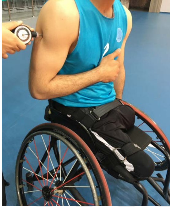
Resim 5.3.2.1. Ağrı eşiği ölçümü