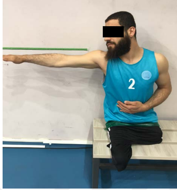
Resim 5.3.7.2. Lateral uzanma testinin yapılışı