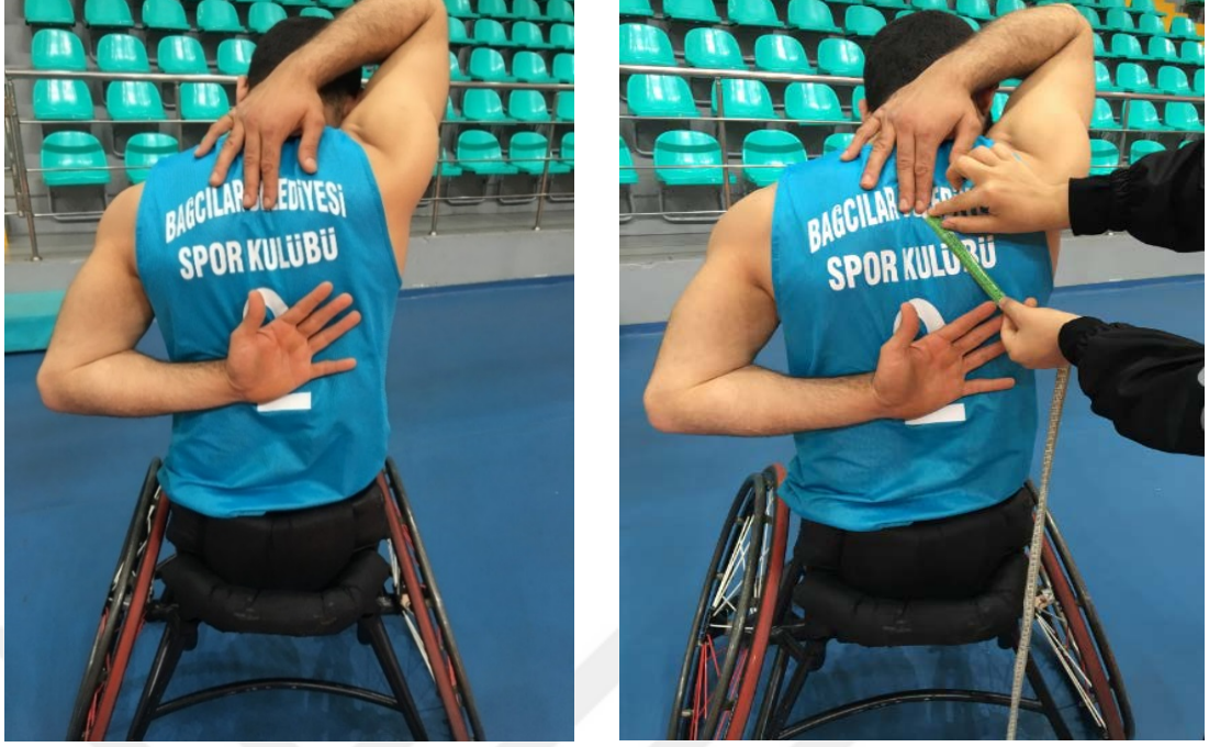
Resim 5.3.3.1. Omuz esnekliğinin değerlendirilmesi