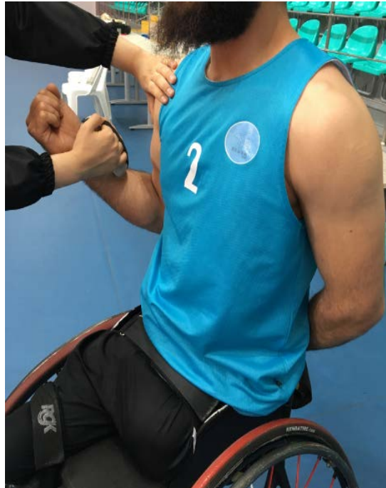
Resim 5.3.5.3. Omuz ekstansör ve dirsek fleksör kas kuvveti ölçümü