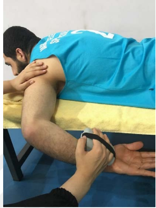
Resim 5.3.5.2. Omuz eksternal ve internal rotatör kas kuvveti ölçümü