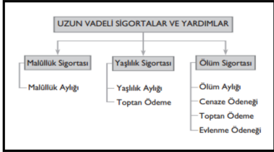
Tablo 2: Uzun Vadeli Sigortalar ve Yardımlar

Kaynak: Sosyal Sigorta Kolları, 15. Ünite, s 56, https://www.anadolu.edu.tr/sites/default/files/unite15.pdf