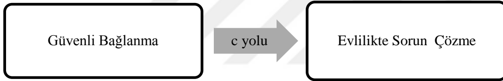
Şekil 5. Güvenli Bağlanma ile Evlilikte Sorun Çözme ilişkisinde Duygusal Zekânın aracılık etkisi.