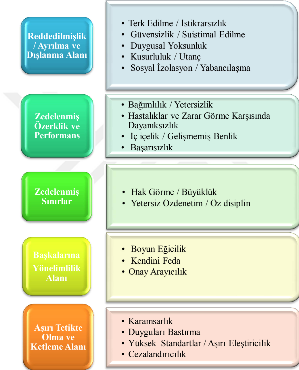
Şekil 1. Şema Alanları ve Erken Dönem Uyumsuz Şemalar

Giderilmemiş duygusal ihtiyaçlar beş genel kategoride, şema alanları ise 18 şema alanı olarak gruplandırılmıştır.